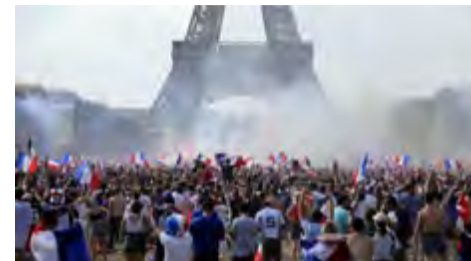
Los parisinos se reunieron junto a la torre-símbolo a celebrar el triunfo.

Aunque jugaron magníficamente bien durante la primera mitad del partido de