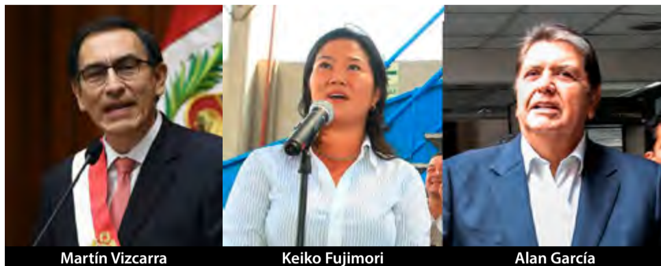
Encabezan la resistencia a la solicitud del presidente Vizcarra, el FP liderado por Keiko Fujimori —que controla el Congreso— y el neoliberal Partido Aprista del expresidente Alan García.

Por su parte, la influyente legisladora del FP Luz Salgado dijo que el propio CNM u otras instancias judiciales deben tomar medidas inmediatas ante el escándalo “sin