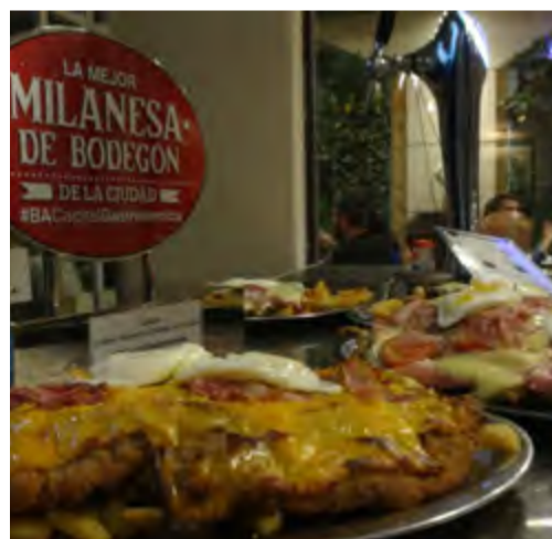
Alimento obligado en esta nación austral.

La milanesa se ha convertido casi en patrimonio gastronómico de los argentinos y de