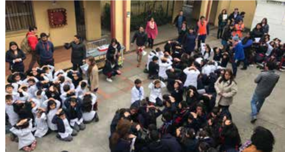
Los chilenos están bien preparados para enfrentar este tipo de eventos.

Ubicado en el Cinturón de Fuego del Pacífico, la estrecha geografía chilena, con una