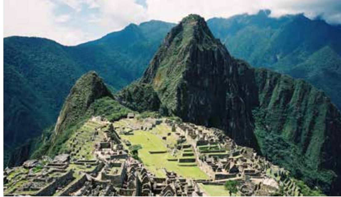
Machu Picchu, "el museo arqueológico creación de un sabio de pura estirpe indígena".

miento revolucionario encabezado por Fidel Castro. Con motivo de su cumpleaños 90, les ofrecemos estas interesantes observaciones críticas de su primer contacto con el contraste de los rezagos de las culturas de la América autóctona, primero en Lima y luego en el Cuzco, Perú, a donde llegó el 31 de marzo de 1952, visitando días después Machu Picchu, vestigio desarrollado de la civilización incaica