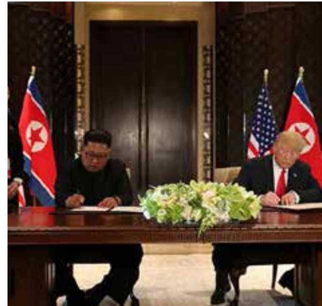
El mundo espera que no haya nada oculto bajo el tapete de este histórico encuentro.

Son décadas de relaciones tirantes entre las dos naciones a causa de la política agresiva de Washington hacia la RPDC que escogió como sistema de desarrollo el socialista, al tiempo que tiene una situación geoestratégica en Asia.