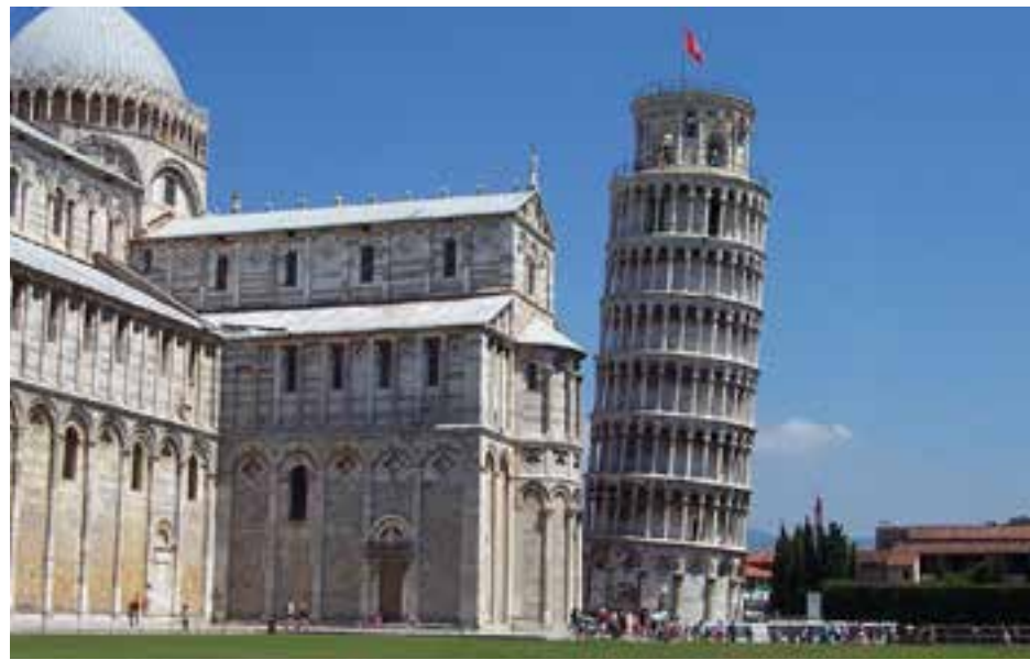
La monumental torre tiene 58 metros de alto y 14 700 toneladas de peso.

En esa cita se analizará el plan de acción en temas de medición y de conceptualización de la Cooperación Sur-Sur, en torno a lo que existen debates muy candentes en la comunidad internacional, añadió. 🇵🇪