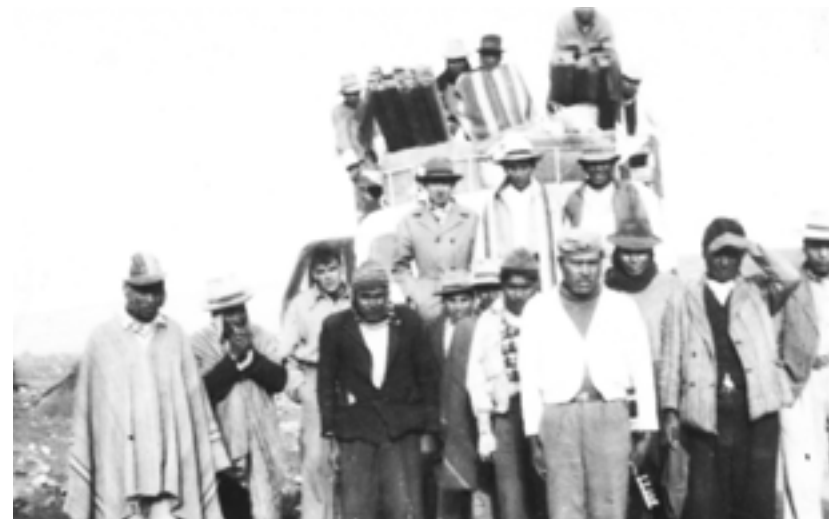
El joven Ernesto Guevara (tercero de izquierda a derecha) durante su primer viaje a Sudamérica.