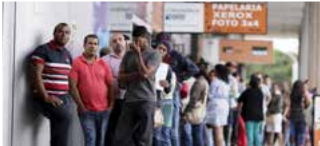
El desempleo en Brasil golpea a 13,7 millones de personas.

En un reciente comentario, el editor del blog O Cafezinho , Miguel do Rosário, señalaba que sería interesante estudiar a fondo las estadísticas ofrecidas en los dos últimos años sobre el crecimiento —mediocre e inestable, dijo— del PIB brasileño, porque estas ocultan "un proceso brutal de concentración de la renta".