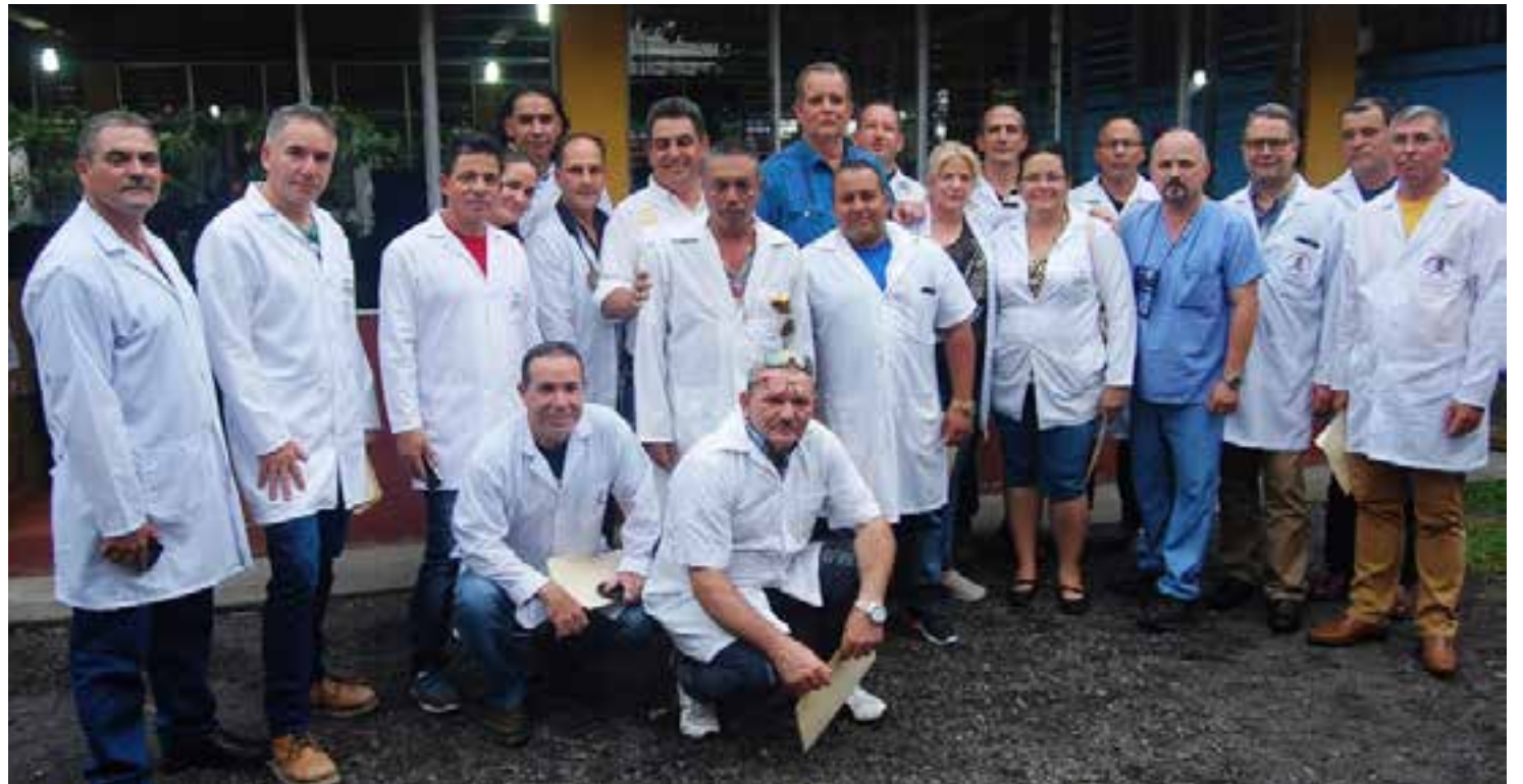
La brigada médica cubana lleva dos décadas de manera ininterrumpida en la nación guatemalteca.

El apoyo de los galenos es vital, sobre todo en horas de la noche y madrugada, cuando