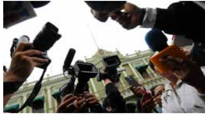
En Venezuela también existe un periodismo comprometido con la Revolución Bolivariana y su verdad.

Esa misma organización plantea que "hay una inseguridad jurídica con el sector radioeléctrico puesto que el gobierno le