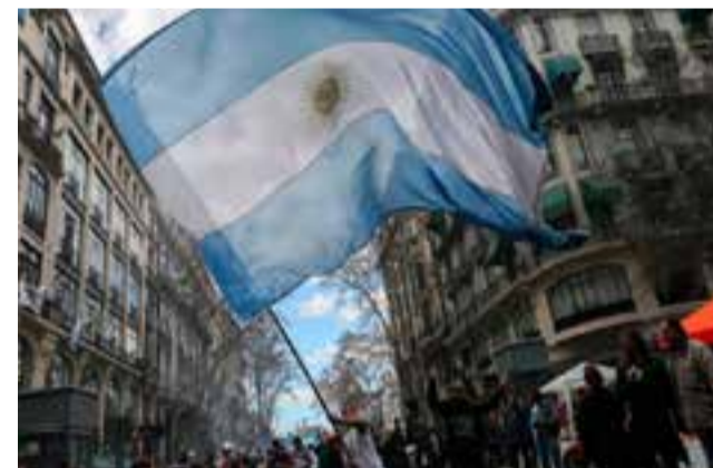
Este fue el tercer paro que enfrenta el Ejecutivo de Mauricio Macri

En medio de la situación, que se sintió dura en la capital, el presidente Mauricio Macri salió a defender las políticas económicas y aseguró que el paro "claramente no contribuye a nada y tampoco suma porque no creo que haya habido un