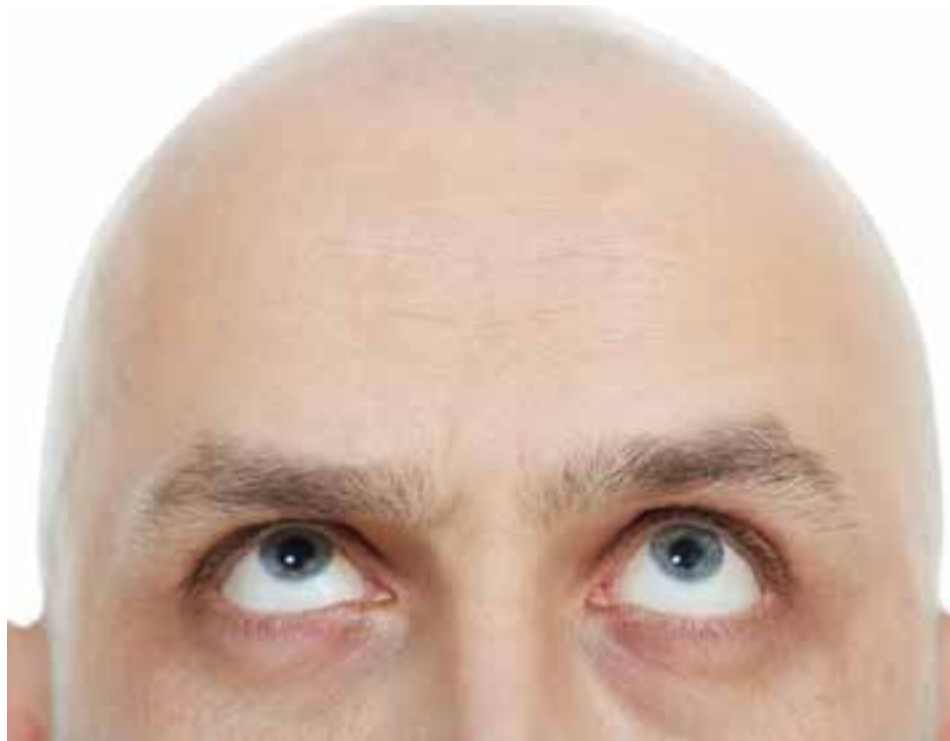
La alopecia es la enfermedad por la cual se produce una p rdida anormal del cabello.

Esta enfermedad puede clasificarse en multitud de grupos, seg n su origen y manifestaciones, pero la forma m s