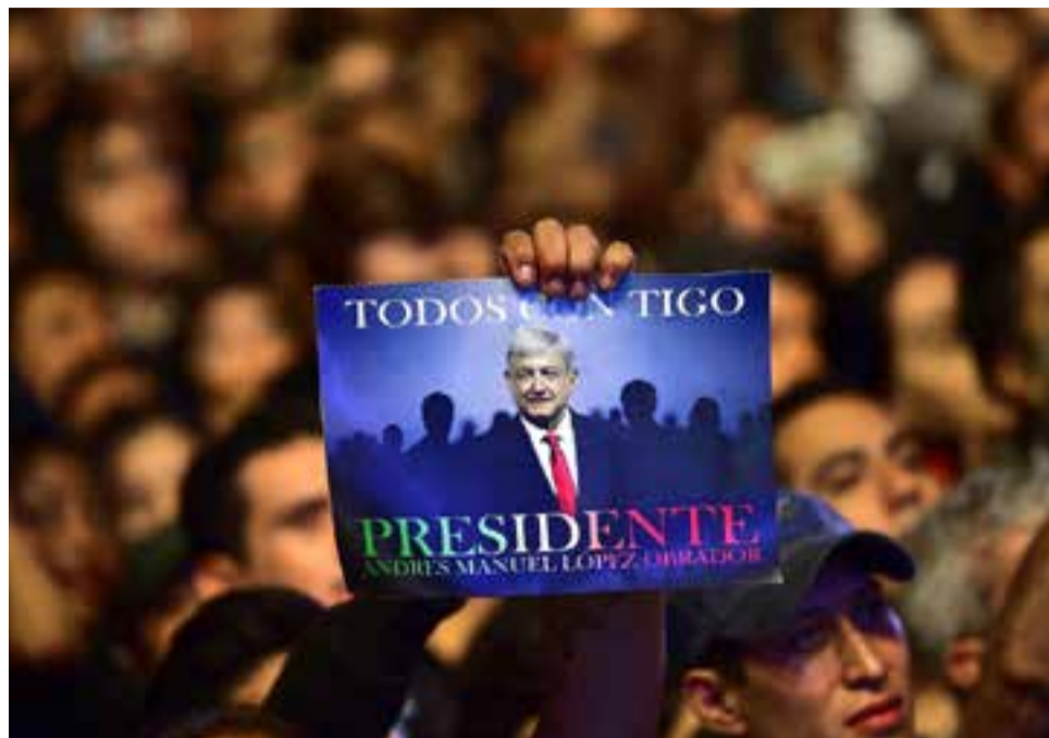
AMLO fue a las urnas por tercera ocasión y esta vez se impuso de manera arrolladora.

López Obrador llegará al gobierno con un amplio colchón de reconocimiento, refrendado también por el avance del Movimiento de Regeneración Nacional (Morena), del cual es líder y fundador.