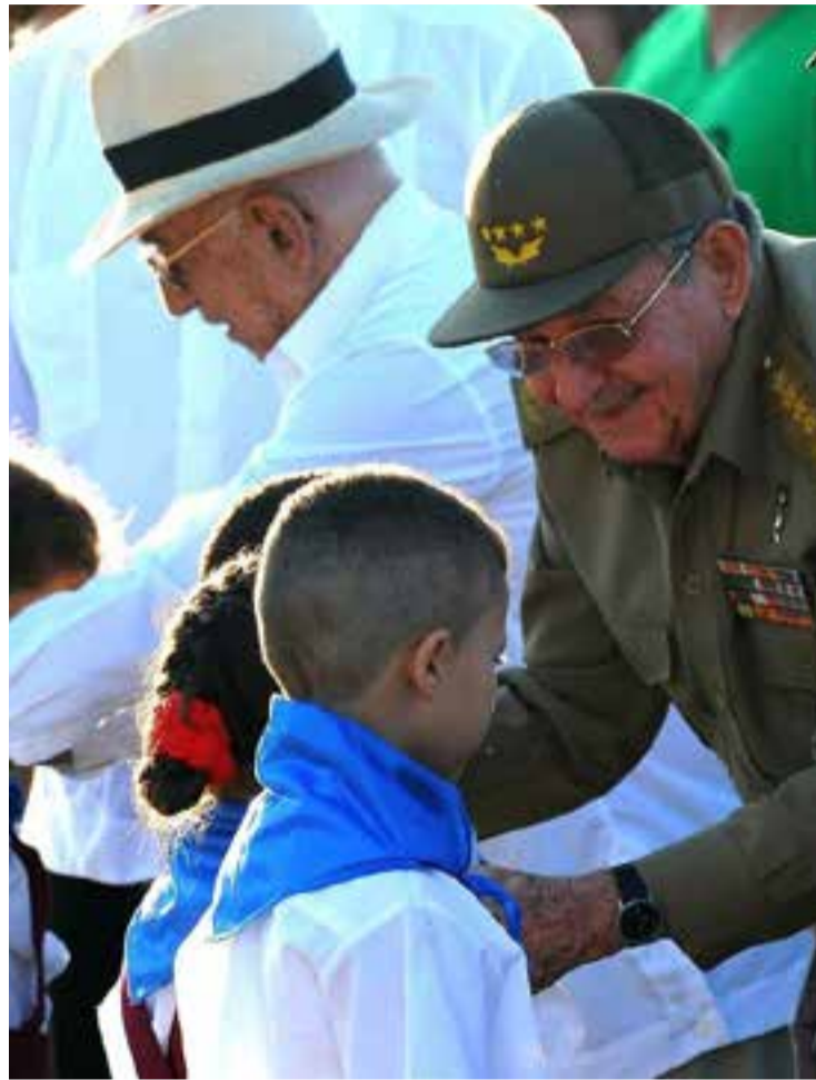
El General de Ejército Raúl Castro, asaltante del Moncada y primer secretario del Comité Central del Partido Comunista de Cuba, junto a José R. Machado Ventura, segundo secretario del máximo organismo político, dedican especial atención a compartir con las nuevas generaciones.

Se vivió entonces una orgía de sangre durante al menos tres días del caluroso vera-