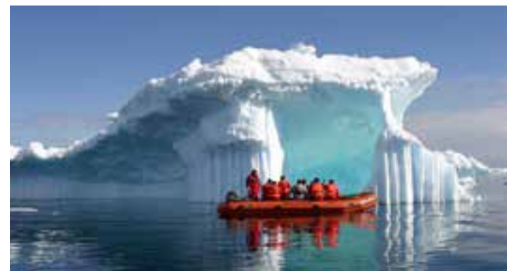
La Antártida es responsable de los tres milímetros que ha aumentado el nivel del mar en el último lustro.

La duración adicional del periodo de observación, la mayor cantidad de participantes, varios refinamientos en nuestra capacidad de observación y una mejor capacidad para evaluar las incertidumbres inherentes, contribuyen a hacer de este el estudio más sólido del balance de masa de hielo de la Antártida hasta la fecha, concluyó Ivins. 📄