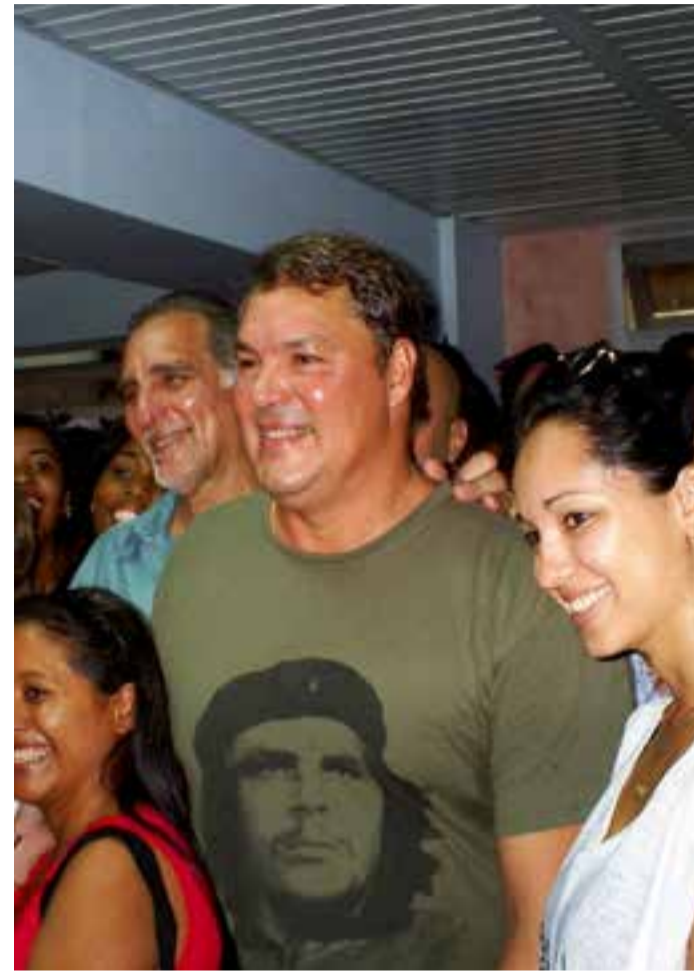
Los jóvenes son protagonistas y seguidores de las hazañas de sus antecesores. En la foto, Ramón Labañino y René González, dos de los cinco héroes que permanecieron prisioneros en Estados Unidos, durante un intercambio con estudiantes.

Cuba es y cada vez lo será más una potencia moral y esperanza de los que creen en un mundo mejor y más justo, afirman las nuevas autoridades del país, fieles a los principios que las sustentan..