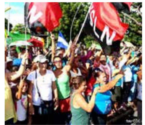
La población mayoritariamente simpatizante del Sandinismo anhela recuperar la paz y seguridad de su país.

“Cómplices de golpistas, cómplices del terrorismo, no queremos más tranques”... vociferaba la ciudadanía visiblemente enardecida, al considerar muchos como una