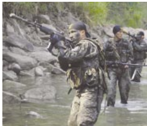
Comandos del Ejército recorren la región.

La fracción senderista, que limitaba a sus acciones al VRAE, abrió con el secuestro un nuevo frente en la cercana selva del Alto