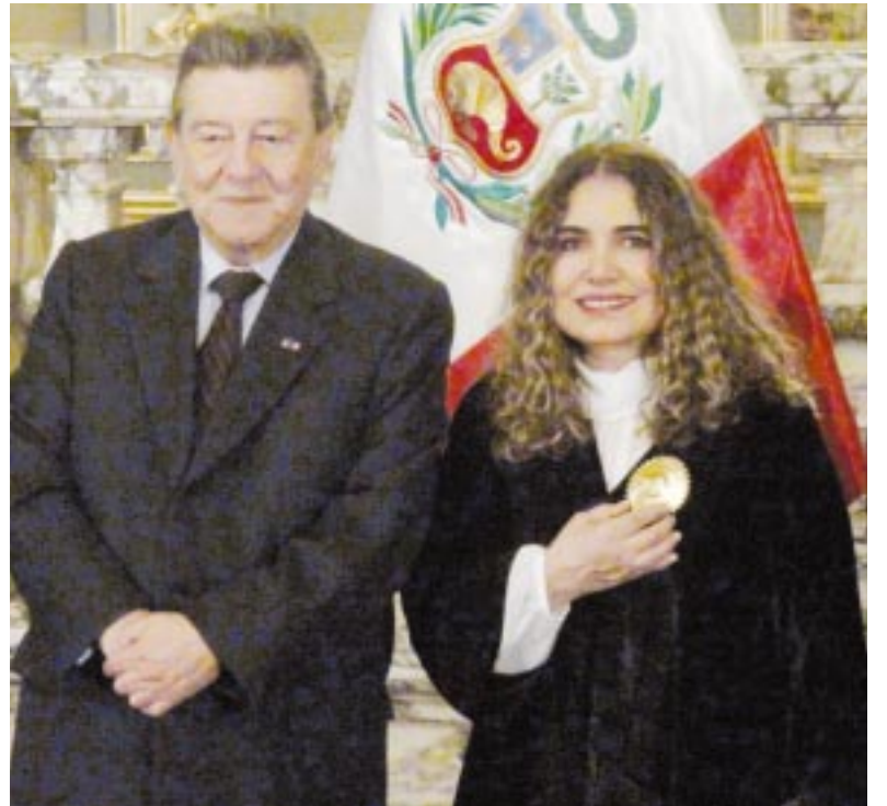
La cantante Tania Libertad con el canciller Rafael Roncagliolo.

Al ser preguntada por su vigencia persistente, dijo: "siempre estoy de moda porque nunca estuve de moda".