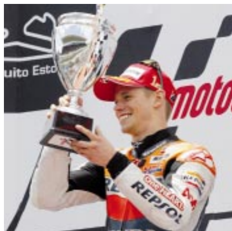
El australiano desplazó del liderato al español Jorge Lorenzo, a quien aventaja solo por un punto.

Fuentes cercanas al piloto italiano aseguraron que IL Dottore había tomado la decisión de retirarse al final de la temporada por el conflicto con la Ducati por los fallidos intentos de tener una moto ganadora.