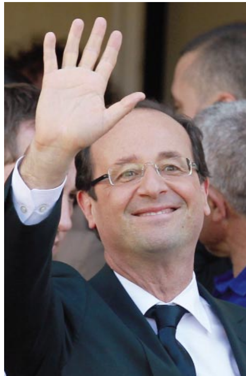
El presidente electo François Hollande.

Recordó que durante los últimos cinco años hubo un ataque permanente al bie-