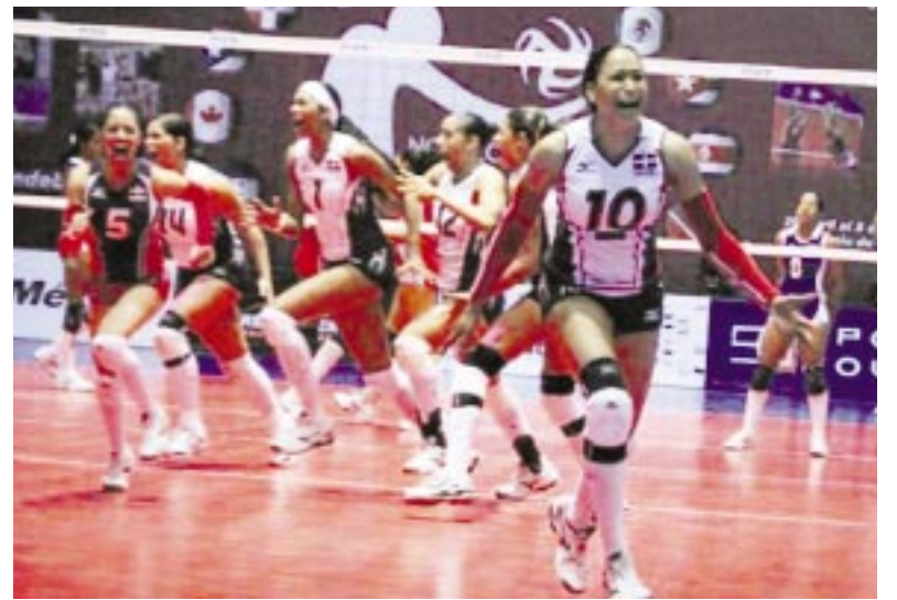
La selección de Santo Domingo celebra la conquista del boleto olímpico por Norceca.

No obstante, las cubanas de manera general encabezaron el ataque y el pase, fueron segundas en el servicio y terceras en el bloqueo, pero cuartas en el recibo y quintas en la defensa, departamentos de peso en el resultado de cualquier elenco.