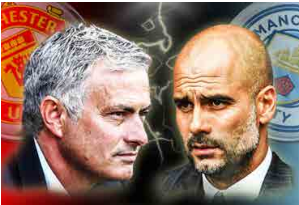
Mourinho y Guardiola mueven los hilos en Manchester.

Sin embargo, el espectáculo al menos estará garantizado hasta junio, así que no lo piense mucho... ¡a ponerse cómodo y padecer por seis meses este dulce virus en forma de balón!