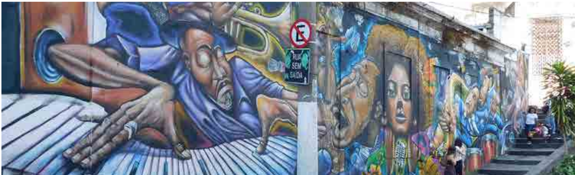
La Piedra de la Sal es el lugar donde siglos atrás se descargaba ese producto de las embarcaciones atracadas en la zona y que devino punto de encuentro de los primeros sambistas, quienes laboraban como estibadores en el puerto.