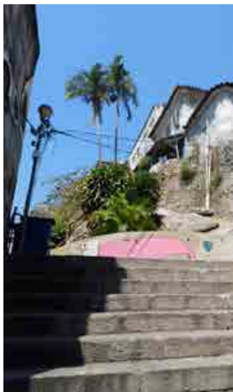
Una de las puertas de acceso al Morro Conceicao, en las inmediaciones del muelle de Valongo.