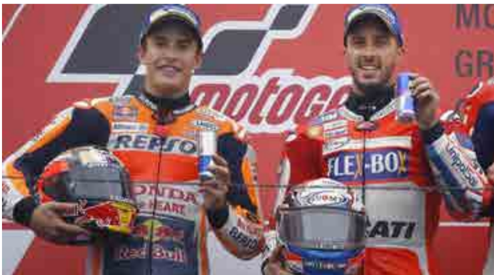
Dovizioso ganó en Japón y cerró el Mundial.

"Fue una batalla tremenda y es muy bueno para el deporte que los dos candidatos al título luchen muy duro uno contra el otro.