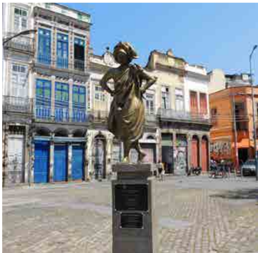
Cerca del muelle de los esclavos, en la plaza de San Francisco de Painha, se rinde homenaje a Mercedes baptista, ícono de la danza "afro" en Brasil.