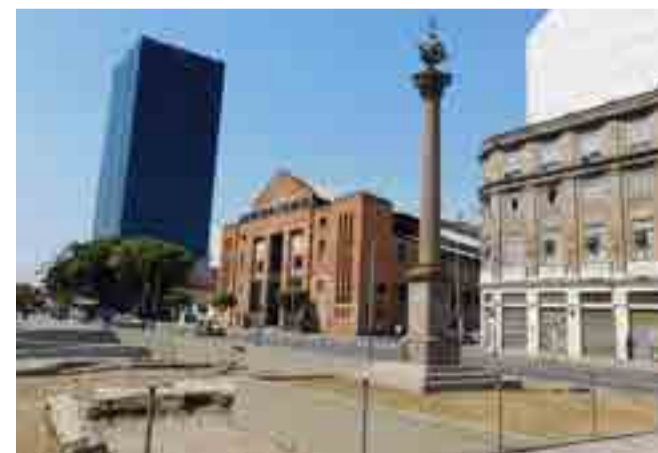
Una enorme columna señala el sitio que resguarda el único vestigio material conservado del desembarque, por diversos sitios, de más de cuatro millones de esclavos africanos en Brasil.