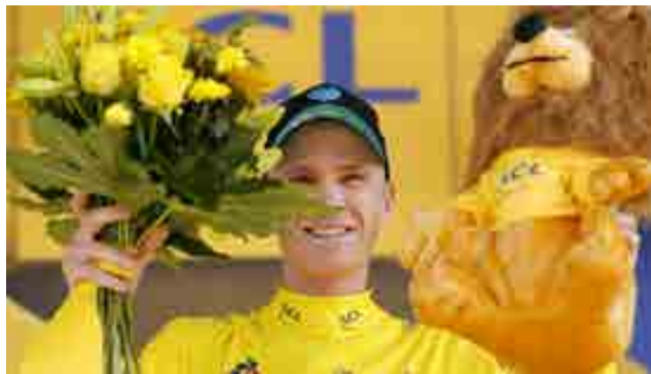
Froome busca su quinto triunfo en el Tour.