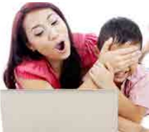
Los niños deben ser educados sobre los peligros del abuso sexual en Internet.

Por Betty Hernández cyt@prensa-latina.cu