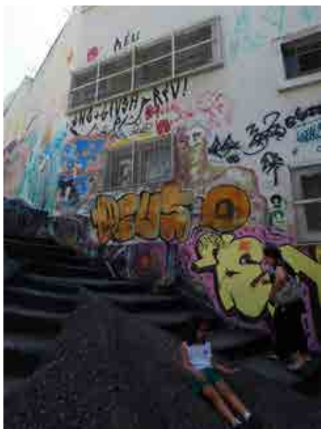
Frente a la empinada escalera de piedra, un enorme grafiti llama la atención del visitante.