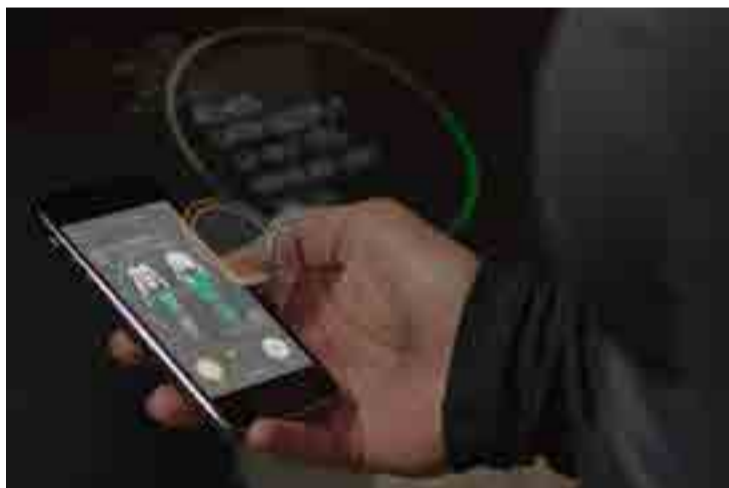
Teléfono y chaqueta se comunican por bluetooth.

Describen sus creadores que la chaqueta inteligente tiene un aspecto similar al de una prenda clásica. Aparte de las funciones tecnológicas, Google y Levi's aseguran que mantiene caliente al usuario mientras camina o practica ciclismo. Es lavable después de quitar la etiqueta donde se halla el núcleo.