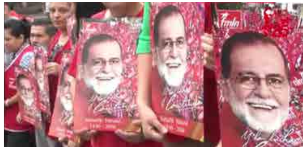
El legado de Schafik Handal acompaña la acción del FMLN.

Tal legado, como el del líder de la izquierda salvadoreña, Schafik Handal (1930-2006), acompaña a un partido que fabrica su plataforma de gobierno a partir de las necesidades de las mayorías.