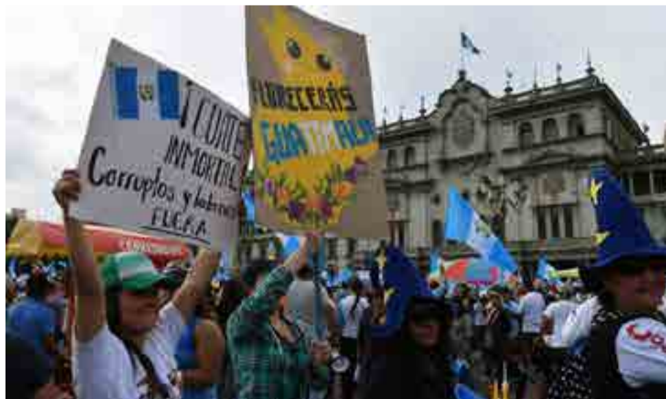
Organizaciones sociales como la recién constituida Asamblea Ciudadana exigen la renuncia del presidente, sobre quien pende la espada de la desconfianza.

Otra tarea, más inmensa aún, supondrá volverse a ganar la confianza de una ciudadanía hastiada de tanta impunidad y corrupción que, como las lluvias, no cesan de salpicar.