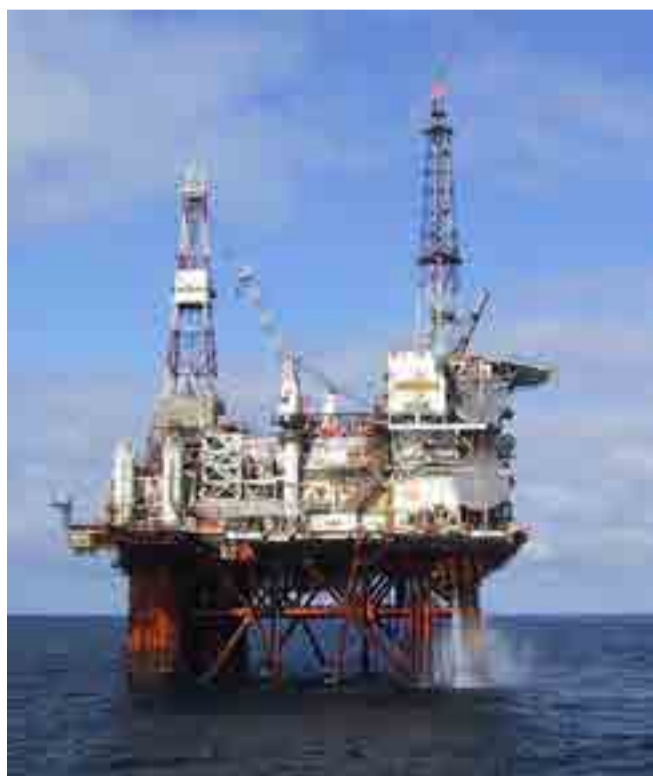
El área en litigio abarca unos 100 000 kilómetros cuadrados y seis bloques petroleros.

Por Lemay Padrón Oliveros africa@prensa-latina.cu