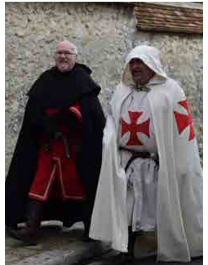
Los legendarios caballeros templarios vuelven a recorrer las callejuelas de la ciudad, gracias a la preservación de las tradiciones en la ciudad de Provins.