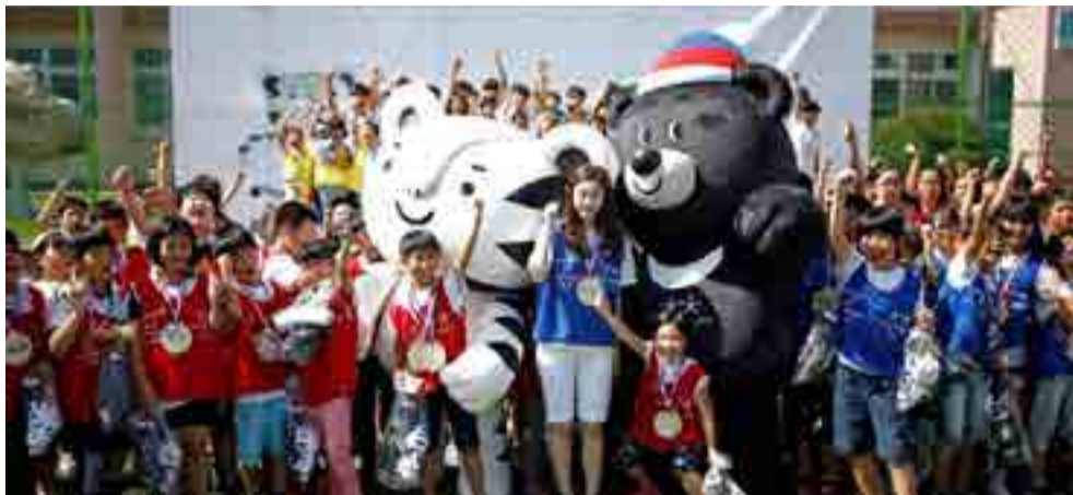
Soohorang (tigre) y Bandabi (oso) son las mascotas de los Juegos Olímpicos de Invierno

en deportes olímpicos como gran salto en snowboard, dobles mixtos en curling, patinaje de velocidad con salida simultánea y esquí alpino con equipos mixtos.