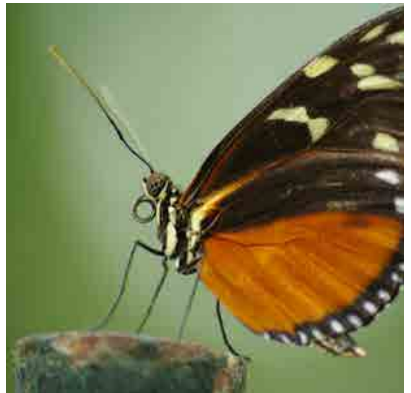
La clave está en su lengua o espiritrompa.

Además advirtieron que el problema jamás se erradicó por completo en el centro y norte costero de California, mientras reapareció en la zona de Salish Sea, en el estado de Washington.