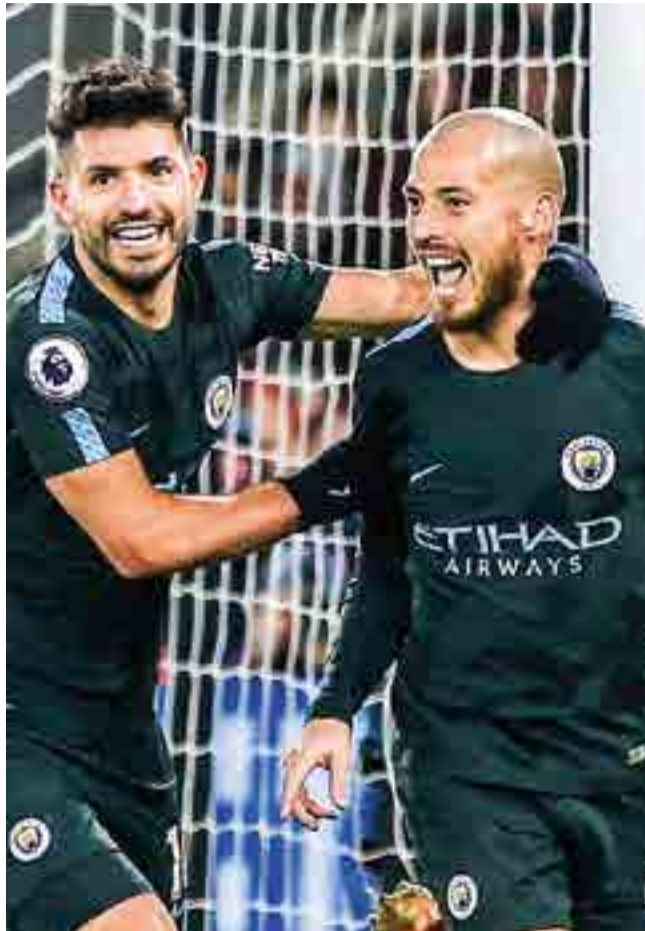
El Manchester City estableció un nuevo récord para la Liga Premier, al ganar 18 partidos consecutivos.

Para colmo, los catalanes reforzaron su plantilla con el fichaje más caro de su historia, tras contratar recientemente