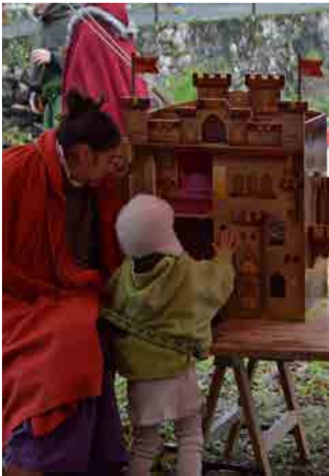
Los niños disfrutaban con los antiguos juguetes de madera.