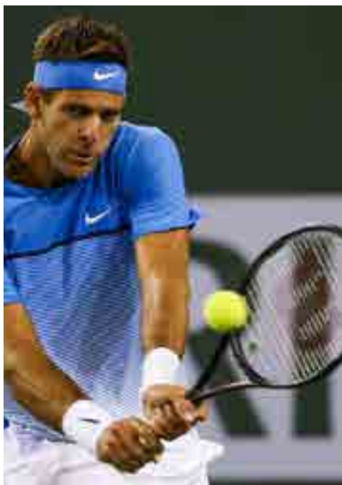
Del Potro buscará su primer título en el Abierto de Australia

La pasada campaña cerró el año con su mejor posición en el escalafón mundial desde agosto de 2014, momento en el que comenzaron las lesiones y las cirugías que lo hicieron caer en el ranking y llegaron a poner en riesgo su carrera.