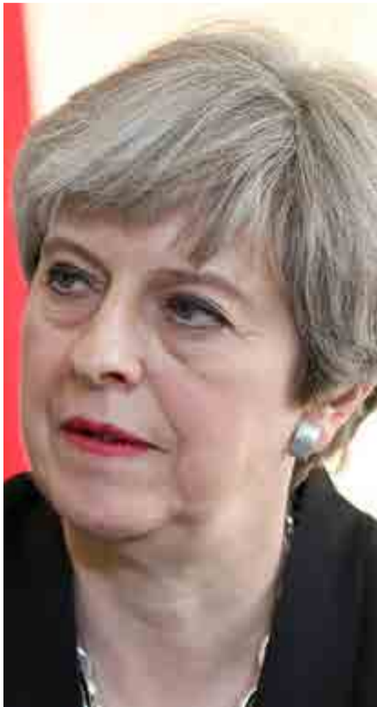
Primera ministra británica, Theresa May.

Asimismo, se especuló sobre la designación de un ministro para un escenario marcado por la falta de acuerdo, iniciativa que finalmente no se concretó.