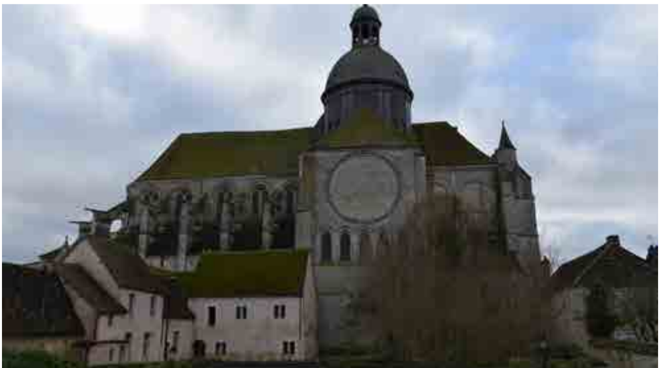
La iglesia de la Santa Cruz, ubicada en lo alto de una colina, es una de las edificaciones más representativas de Provins.