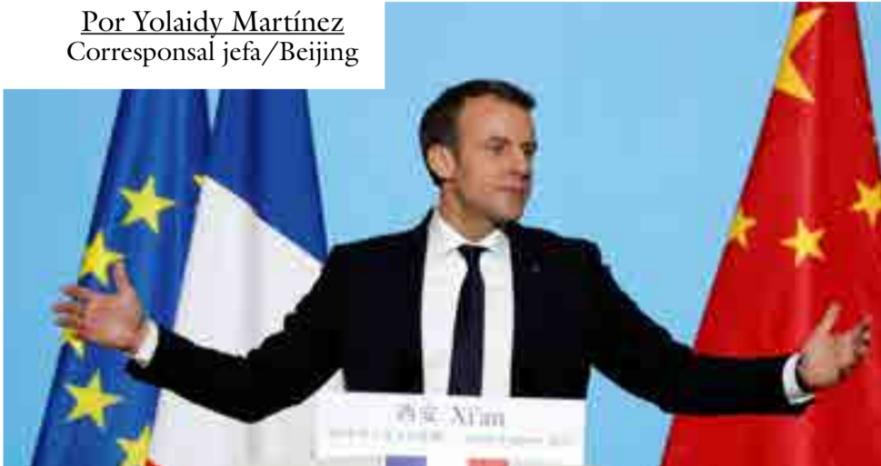
El presidente Macron en su primera visita oficial a China.