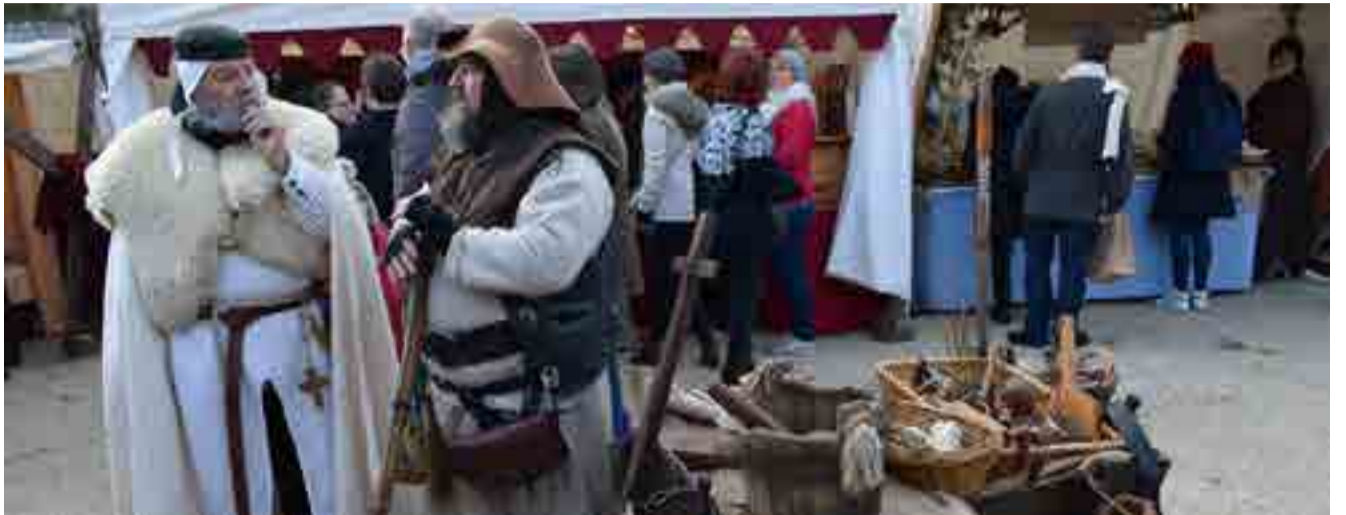
La población local muestra cómo se vestía y se vivía en la época medieval.

El mercado es, además, una oportunidad para los descubrimientos, que van desde aprender a tirar con arco y flecha; divertirse con los antiguos juegos de madera, presenciar procesiones religiosas y hasta bailar al ritmo de una música medieval.