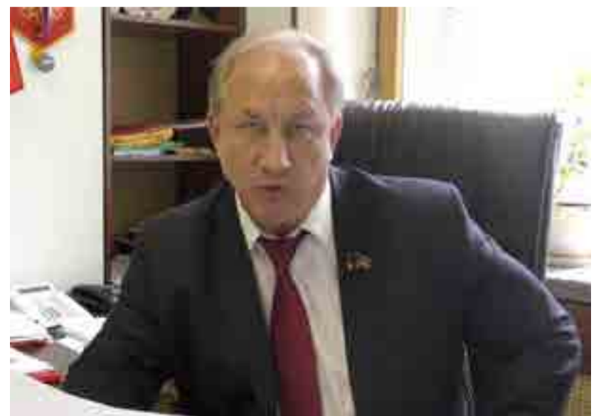
Diputado ruso Valery Razhkin.

Pese a lo ocurrido en la década de 1990, —concluyó— el pueblo ruso evalúa de forma positiva el periodo en que vivieron nuestros abuelos y bisabuelos, y nosotros también, es decir, el periodo soviético.