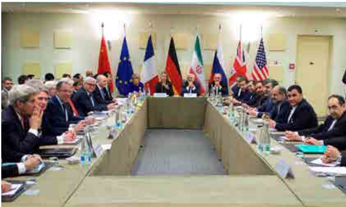
El acuerdo entre Irán y los cinco miembros del Consejo de Seguridad de la ONU más Alemania fue firmado en julio de 2015.