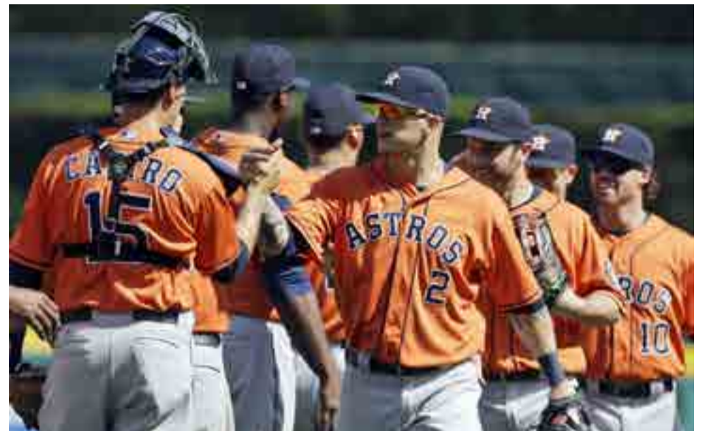
Astros de Houston, equipo titular guiado al bate por el venezolano José Altuve.