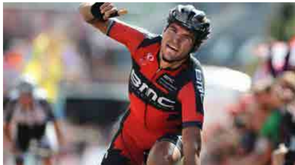
El belga Van Avermaet concluyó el 2017 como líder del World Tour.

Además de su tercer mejor resultado conseguido en eventos del orbe, después de los sendos quintos puestos en las ediciones de 2010 y 2014, Van Avermaet se coronó este año en cuatro de las ahora 37 carreras incluidas en el principal circuito ciclista de ruta.