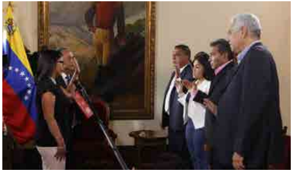
Los cuatro integrantes del tradicional partido Acción Democrática se juramentaron ante la Asamblea Nacional Constituyente.

Otros expertos consideran que la actuación de Guanipa parece estar dictada desde el exterior, ya que las fuerzas imperiales pueden utilizar esa brecha apátrida para consolidar una intervención militar contra Venezuela con inicio en territorio colombiano.