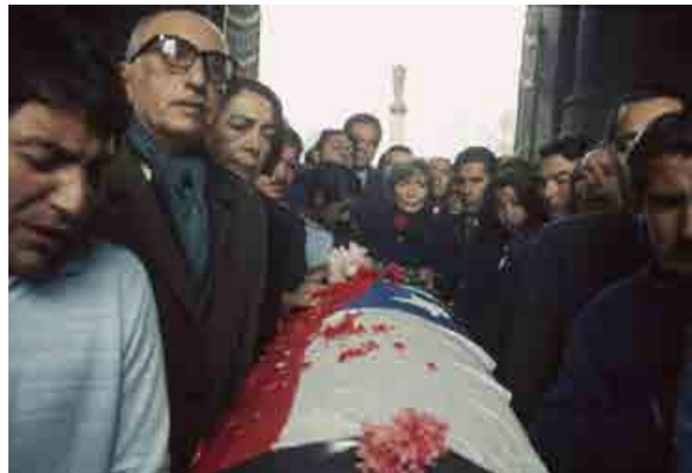
Funeral de Neruda en 1973.