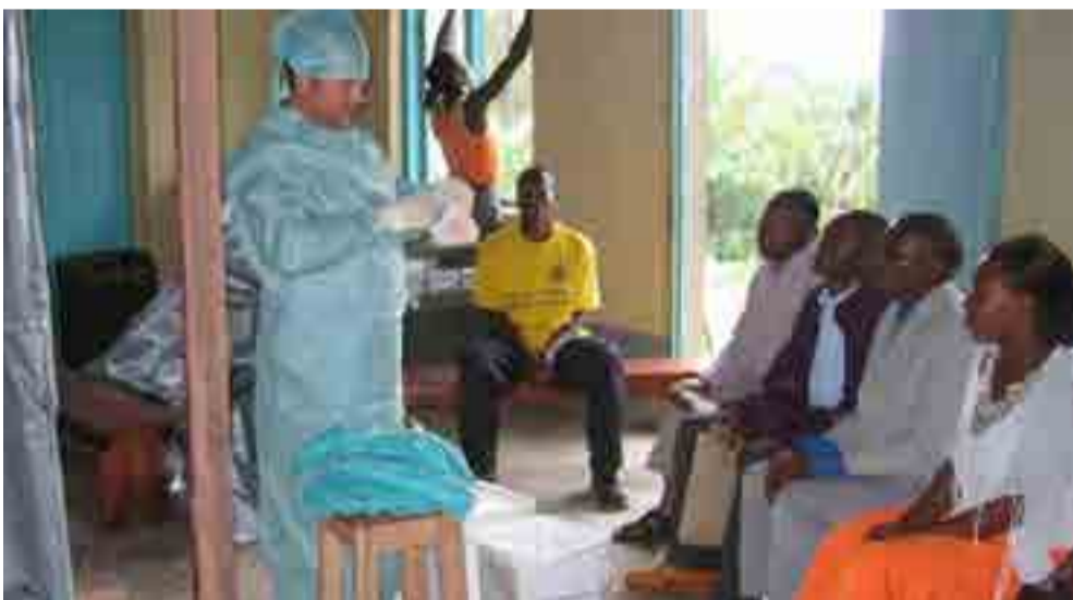
Es una fiebre hemorrágica provocada por un virus de la misma familia que el causante del Ébola.