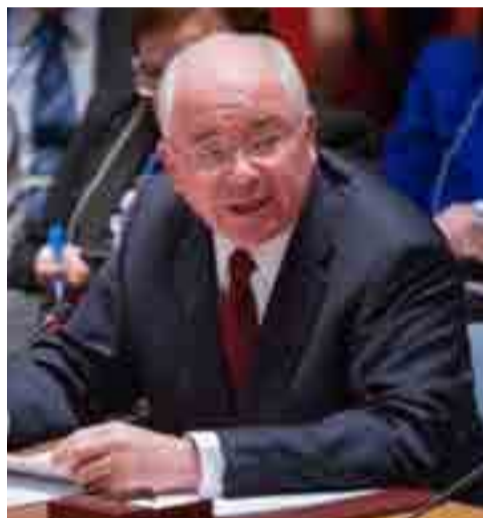
Embajador Rafael Ramírez.