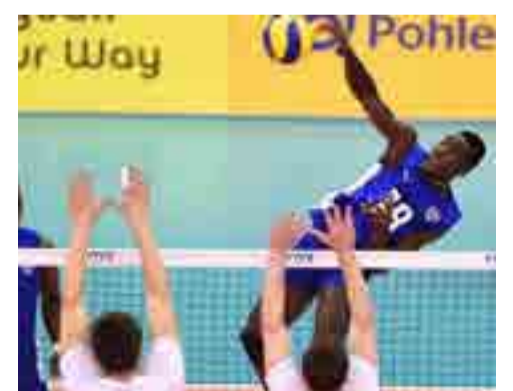
Últimos pasajeros al Mundial