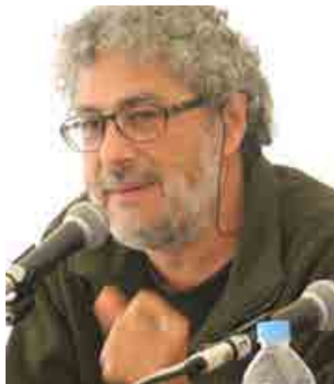
Activista mexicano Gustavo Castro.