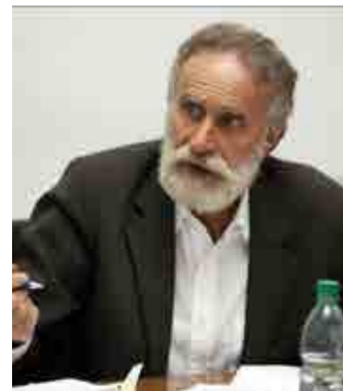
Dirigente político brasileño Florivaldo Fier.