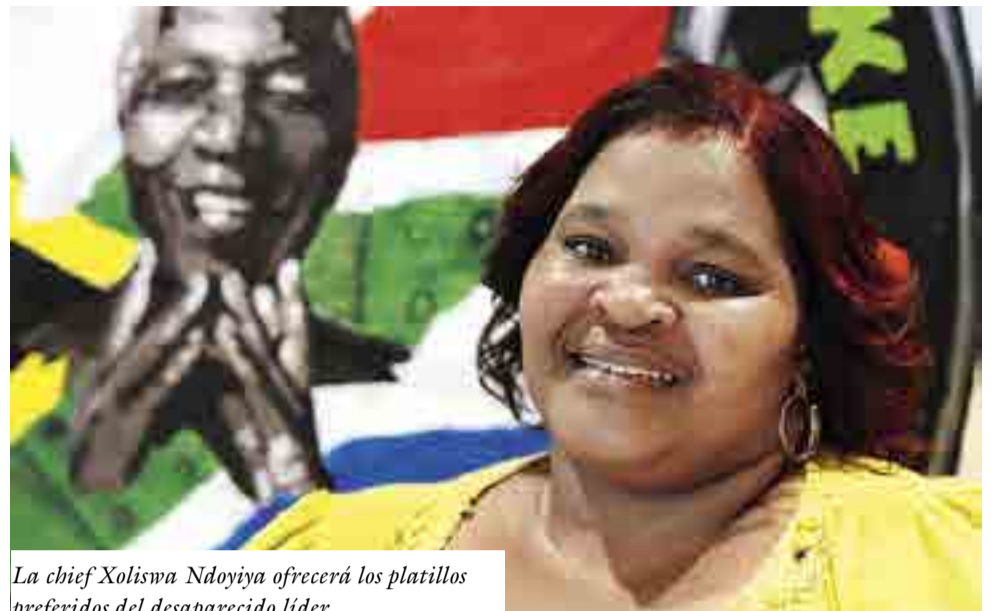
La chief Xoliswa Ndoyiya ofrecerá los platillos preferidos del desaparecido líder.

Sin embargo, expertos sostienen que los robots de servicio también pueden ser de gran utilidad en las actividades de lucha contra el terrorismo, investigación criminal y manejo de explosivos.