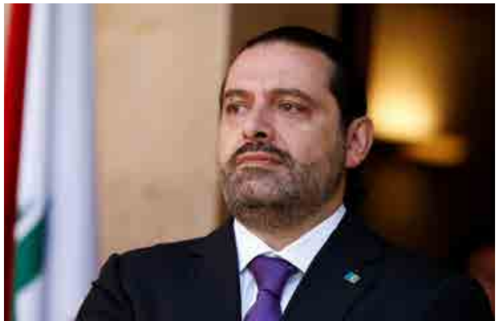
Tras dimitir, el ex primer ministro libanés, Saad Hariri.

"El gobierno libanés será tratado como un gobierno que declara la guerra a Arabia Saudita y todos los libaneses deben darse cuenta de ese peligro y trabajar para resolver los problemas antes de que lleguemos al punto de no retorno", acotó Al-Sabhan.