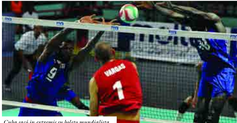
Cuba sacó in extremis su boleto mundialista

Los dos veces medallistas de plata en Campeonatos Mundiales estaban entonces obligados no solamente a vencer a Puerto Rico en el último duelo, sino también a ha-