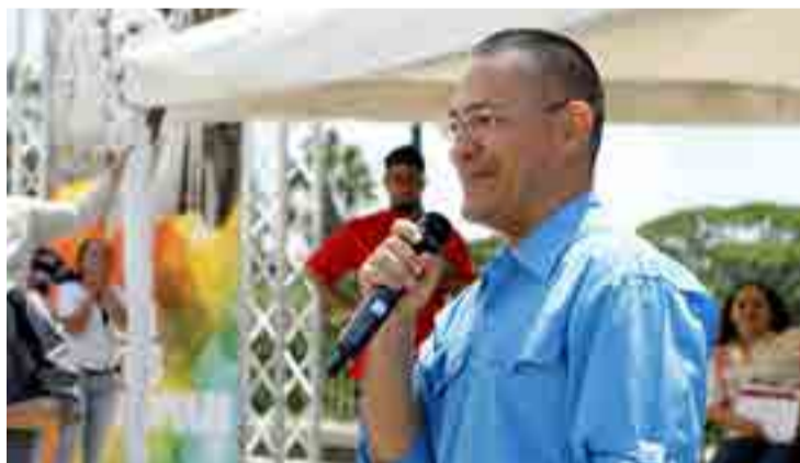
El ministro de Cultura, Ernesto Villegas, destacó la importancia de estudiar el legado de Chávez

Entre otros momentos, destacó la presentación del libro "Buen Día, presidente", en el cual se muestra en 15 entrevistas, realizadas