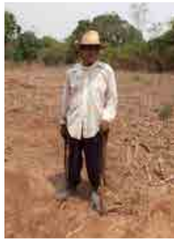
La tierra marca la diferencia entre la subsistencia y la pobreza extrema.

Probablemente ello explica por qué procesos de reforma agraria emprendidos en no pocas ocasiones no han logrado una transformación duradera en la posesión de la tierra.