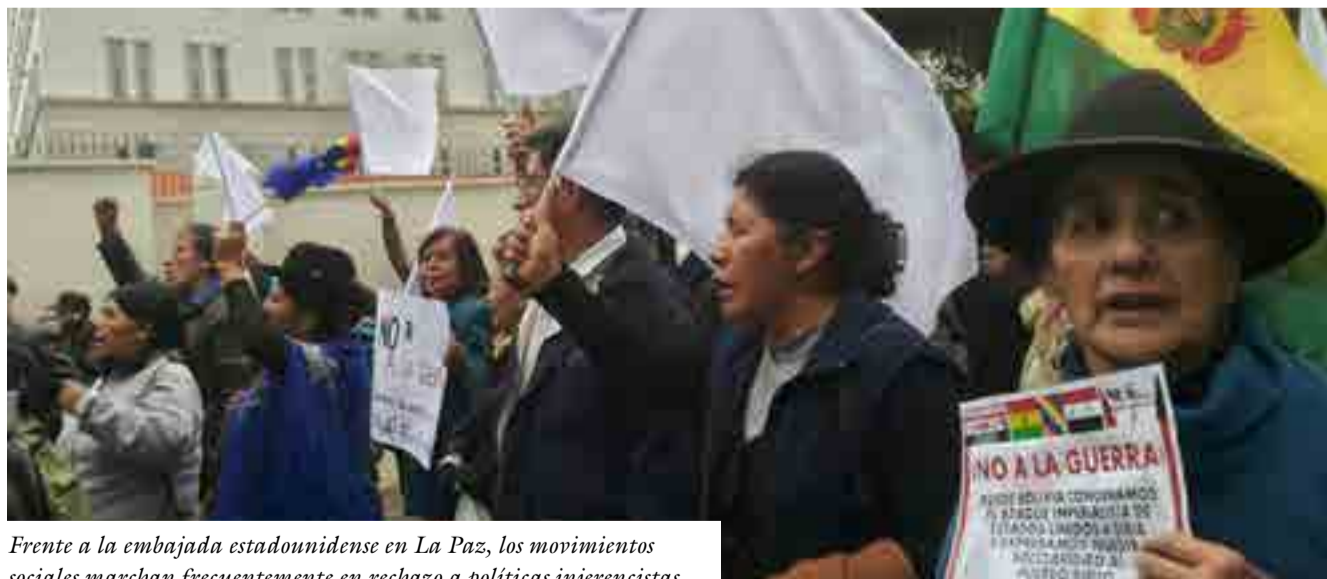
Frente a la embajada estadounidense en La Paz, los movimientos sociales marchan frecuentemente en rechazo a políticas injerencistas.

El presidente advirtió que si su reemplazante en el cargo se dedica a conspirar también "se encontrará con la horma de sus zapatos porque el pueblo boliviano está unido y organizado".