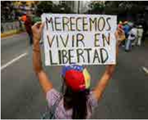
Antichavismo sin rumbo