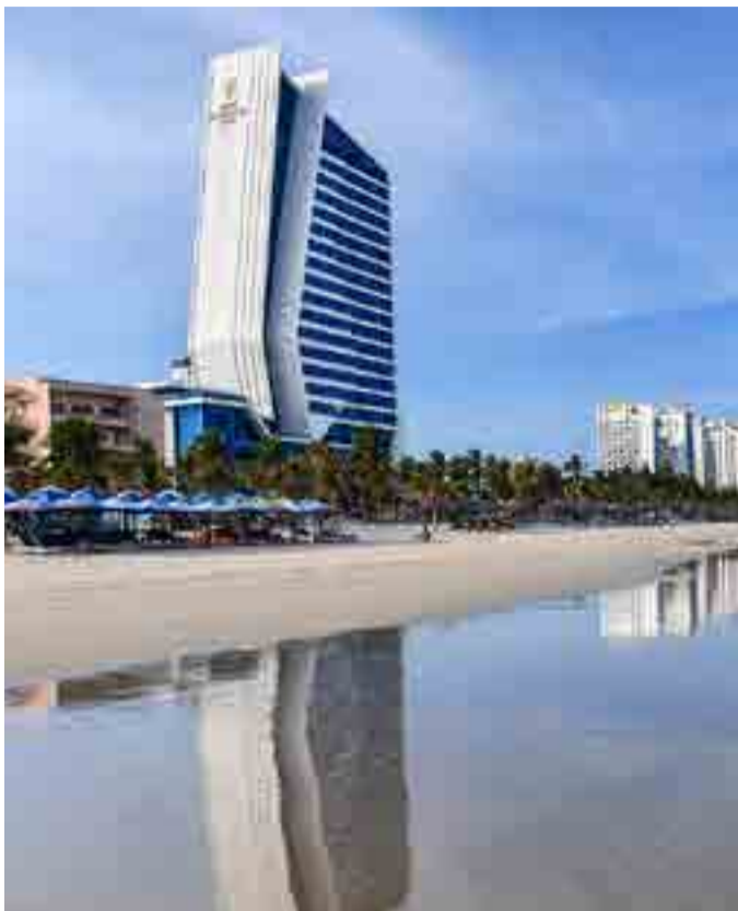
De cara al mar del Este, la ciudad tiene más de nueve kilómetros de cristalinas playas que en nada envidian a las del Caribe.

De noche, la historia es otra y la misma: Da Nang se baña de luces y los cafetines, restaurantes y centros nocturnos halan la mano del visitante, que duda entre si entrar ahora o luego de un paseo por el río Han, con esos puentes radiantes que conectan las orillas de esta urbe abierta al asombro.