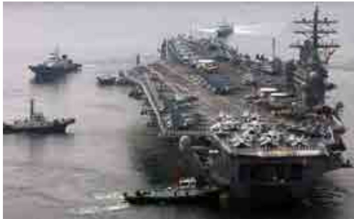
Los arsenales del Pentágono constituyen un freno a la desnuclearización de la península de Corea.

"No, no hemos abandonado esa idea. Continuamos hablando con ellos para asegurar que están comprometidos a aplicar medi-