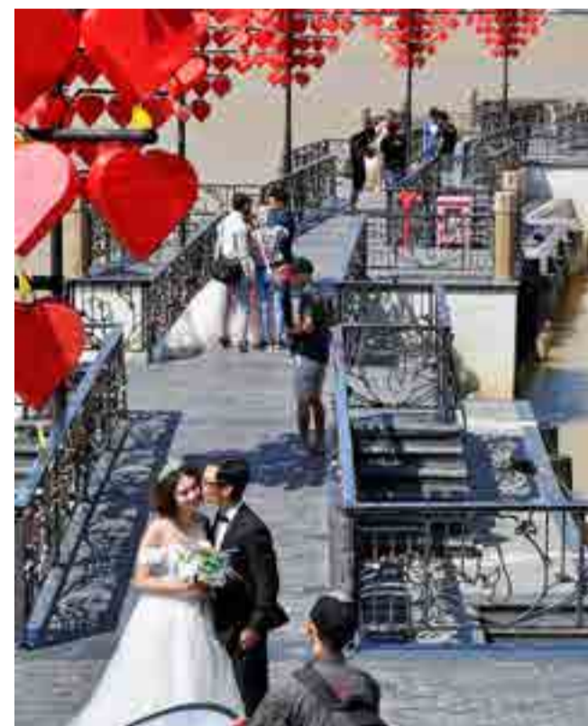
Las áreas inmediatas al río son escenario de una intensa vida social.