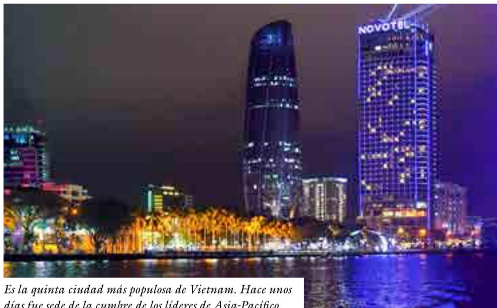
Es la quinta ciudad más populosa de Vietnam. Hace unos días fue sede de la cumbre de los líderes de Asia-Pacífico.