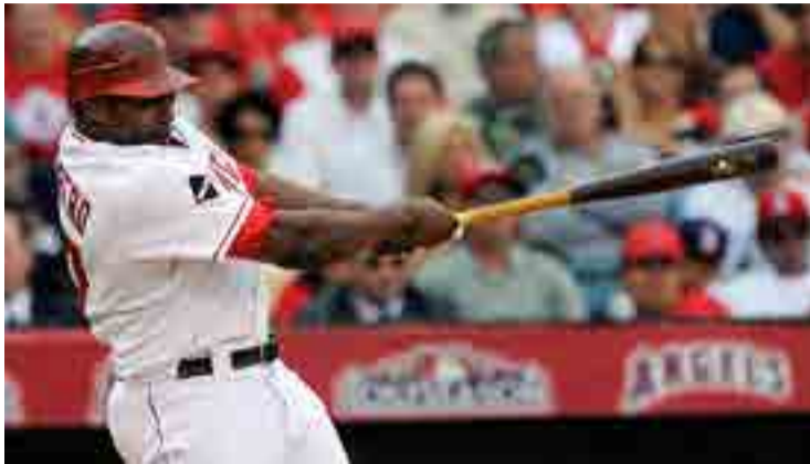
Vladdy asistió a nueve Juegos de Estrellas y ganó ocho bates de plata.

Por Edilberto F. Méndez Corresponsal jefe/Santo Domingo