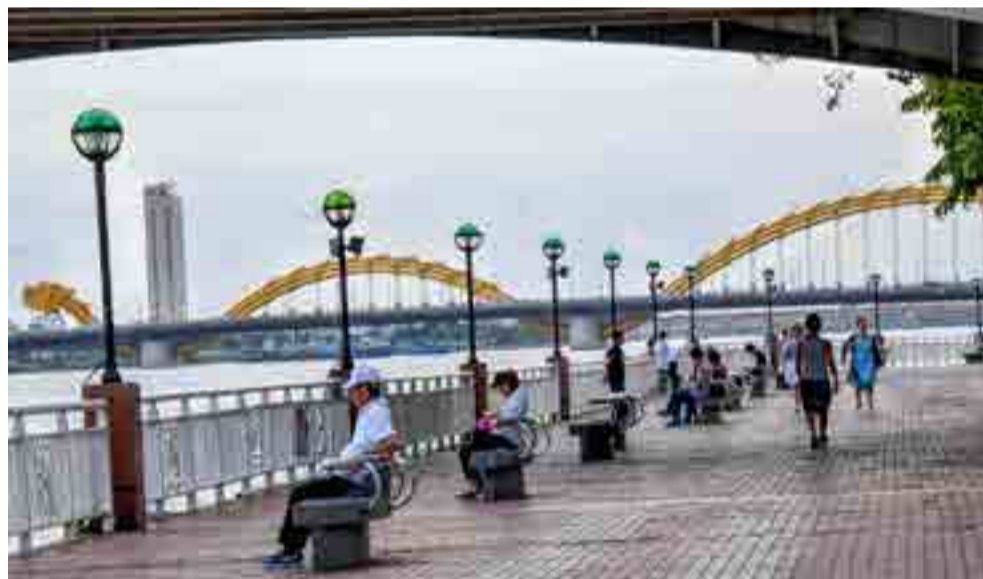
Entre los nueve puentes que cruzan el río Han, probablemente el más famoso sea el del Dragón.