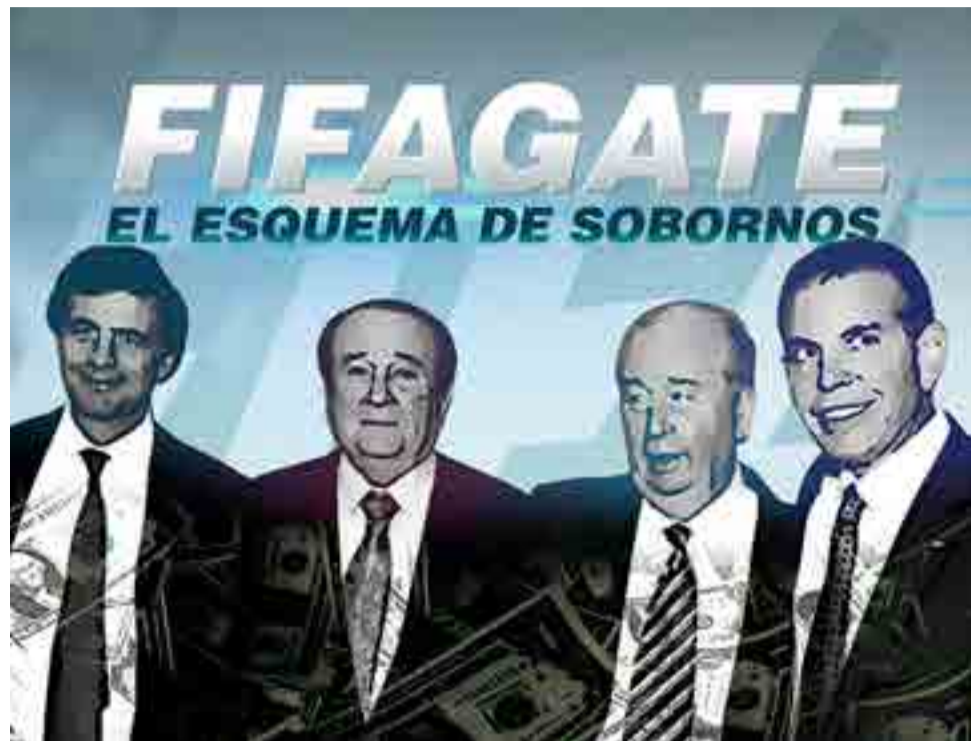
El inicio de los juicios dio una tonalidad más dramática al escándalo denominado FIFAgate.

Por Raúl del Pino Salfrán deportes@prensa-latina.cu