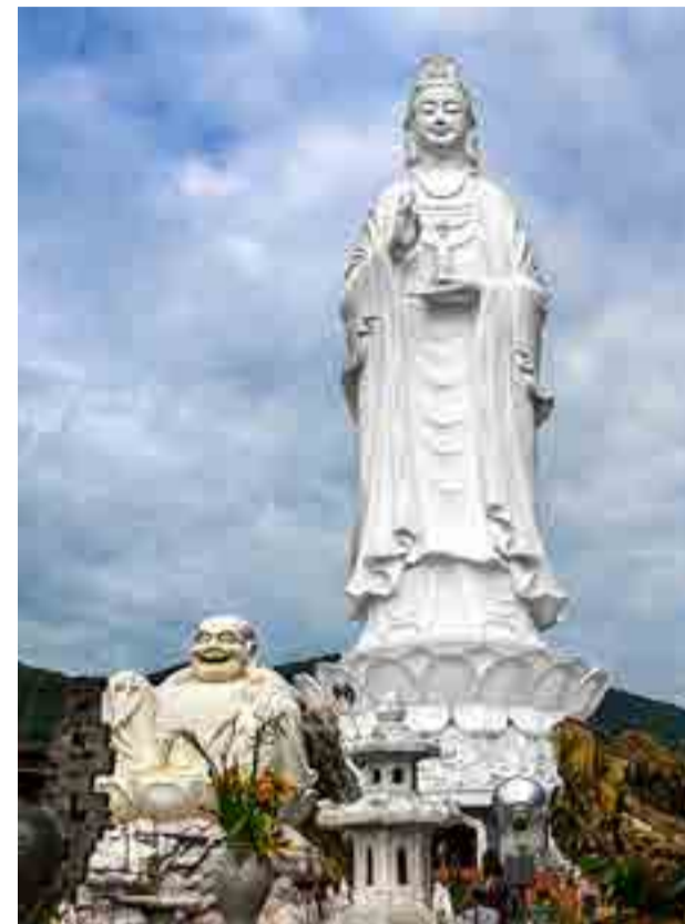
En el cinturón montañoso que contornea a la urbe hay numerosos monumentos, templos y lugares de esparcimiento.