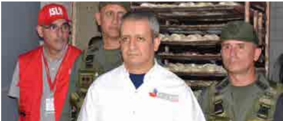
La Superintendencia para la Defensa de los Derechos Socioeconómicos trabaja en coordinación con la Fuerza Armada Nacional Bolivariana.

Por Luis Beatón Corresponsal jefe/Caracas