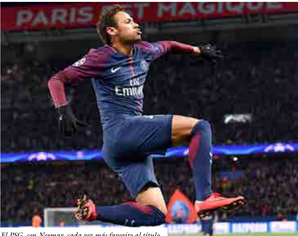
El PSG, con Neymar, cada vez más favorito al título.