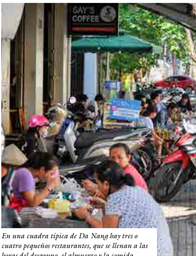
En una cuadra típica de Da Nang hay tres o cuatro pequeños restaurantes, que se llenan a las horas del desayuno, el almuerzo y la comida.