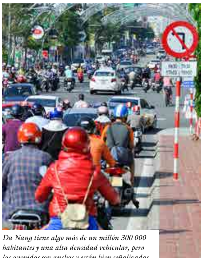
Da Nang tiene algo más de un millón 300 000 habitantes y una alta densidad vehicular, pero las avenidas son anchas y están bien señalizadas.