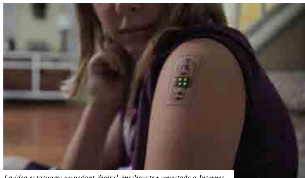
La idea es tatuarse un gadget digital, inteligente y conectado a Internet.

Otras alternativas son el uso de esmaltes con sabor desagradable, llevar un diario de anotaciones con las veces que se muerde las uñas o un tratamiento farmacológico cuando se trata de ansiedad.