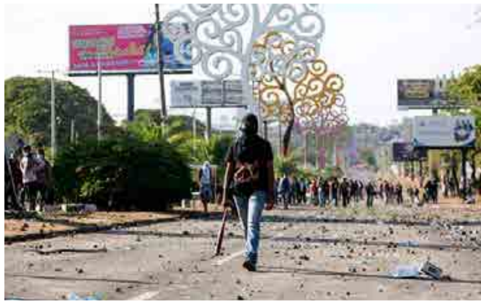
La derecha ha desatado una ola de vandalismo en las calles para intentar imponer sus demandas.

Bombas molotov y morteros artesanales lanzados por individuos encapucha-