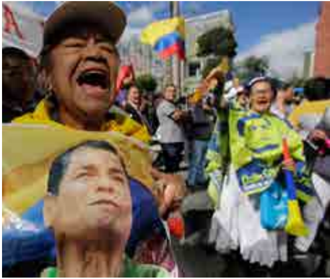
Numerosos partidarios del expresidente condenan el proceso en su contra como otro ejemplo de judicialización de la política.

Por Sinay Céspedes Moreno Corresponsal jefa/Quito