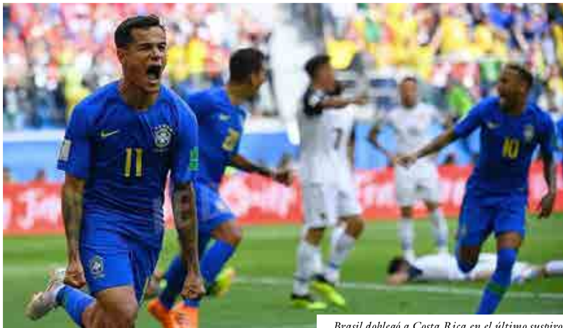
Brasil doblegó a Costa Rica en el último suspiro.