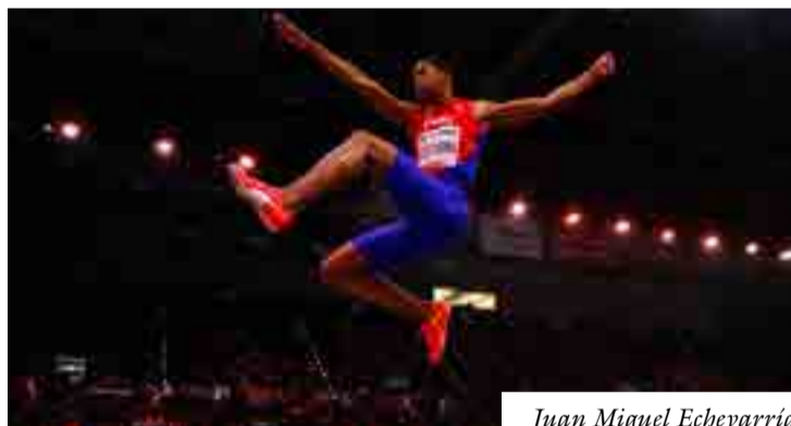
Juan Miguel Echevarría.

El cubano "volaba" 8,83 metros, un salto que por esos pequeños detalles del destino no pudo ser homologado por viento a favor de 2,1 metros por segundo, solo una décima por encima de lo permitido.