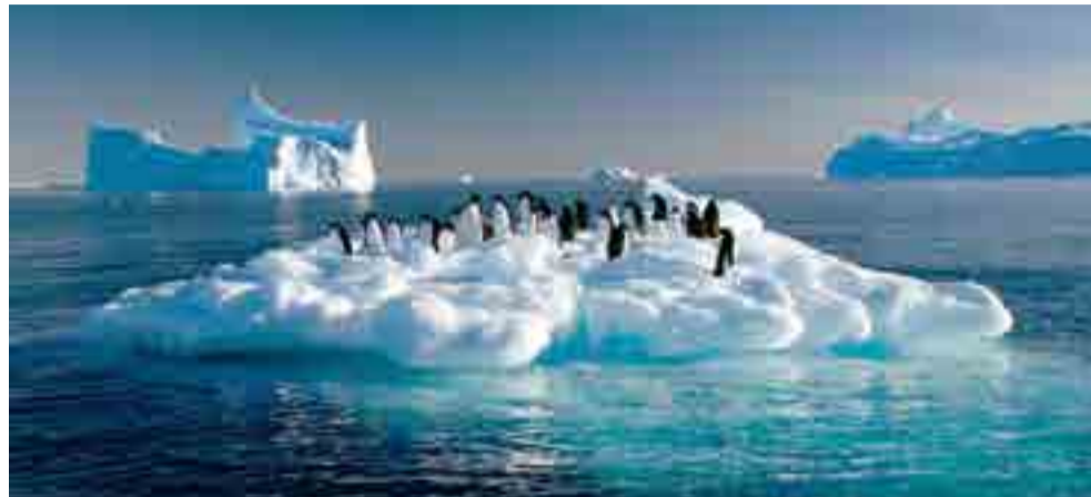
Cada año el continente austral pierde más de 76 000 millones de toneladas de hielo.

Sin embargo, entre 2012 y 2017, la pérdida supera el anterior escenario, al esfumarse en esa región de nuestro planeta 219 000 millones de toneladas de hielo cada 365 días, tributándole anualmente 0,6 mm de líquido.