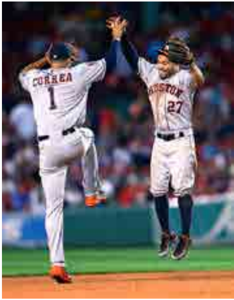
Por Diony Sanabia Corresponsal/Washington

Bajo el liderazgo del segunda base venezolano José Altuve, casi 30 peloteros latinoamericanos, sin contar a lanzadores, pretenden ser convocados al próximo Juego de las Estrellas de las Grandes Ligas del béisbol estadounidense.