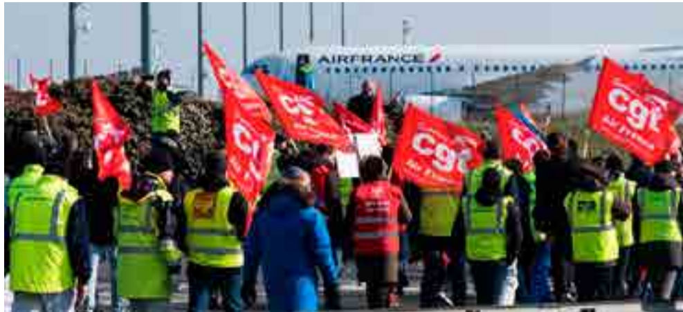
Las huelgas de los transportistas amenazan con prolongarse en julio.

El líder de CGT-Cheminots, Laurent Brun, declaró que "como no hemos obtenido las garantías demandadas, seguiremos en julio y agosto con un calendario diferente, pero que permitirá mantener la movilización".