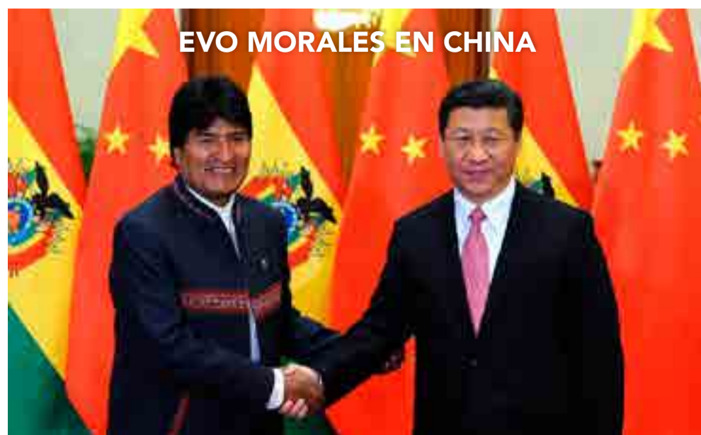
EVO MORALES EN CHINA

El presidente boliviano suscribió importantes acuerdos con su par chino.