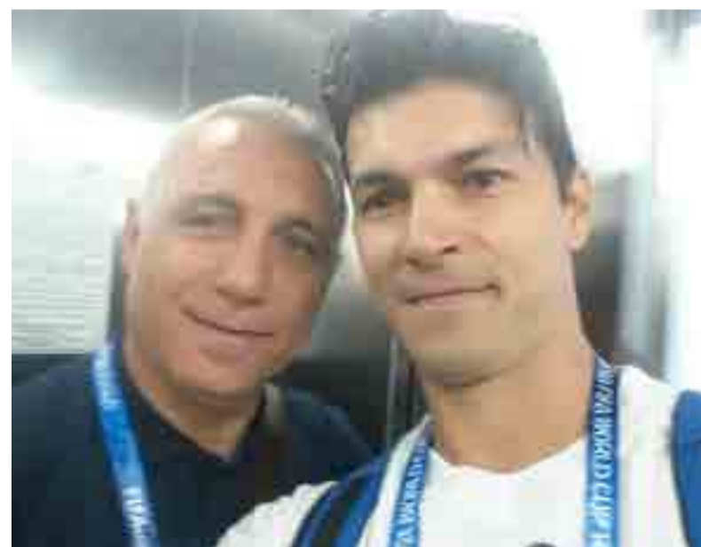
Stoichkov saluda a los lectores de Orbe desde Rusia.

Y, como Stoichkov, el cinco veces ganador del Balón de Oro no me defraudó, al marcar el tanto de la victoria sobre Marruecos con un cabezazo marca de la casa, y realizar, con sus 33 abriles, un estratosférico despliegue físico para ayudar a sus compañeros en todas las tareas.