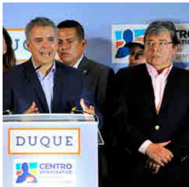
Iván Duque ocupará la Presidencia de Colombia.