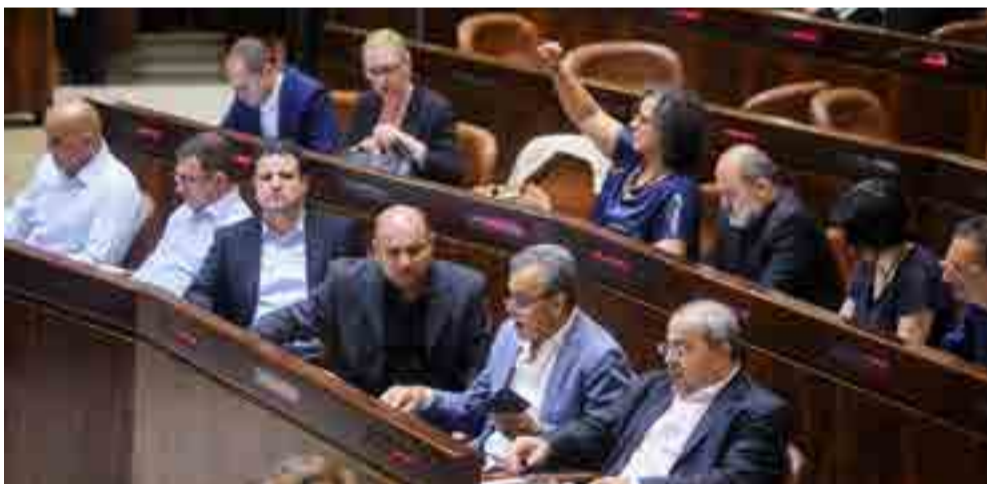
Dentro del Parlamento existe desacuerdo respecto a la ley que define a Israel como Estado Nación del Pueblo Judío.

En ese sentido, el mensaje contra Irán podría apuntar a una maniobra de distracción, pero eso no significa que no sea también una forma de preparar el terreno para la esperada reimposición de sanciones.