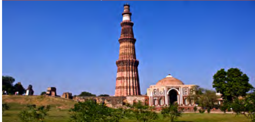
El minarete de ladrillos más alto del mundo, declarado Patrimonio de la Humanidad.