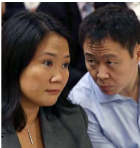
El conflicto entre los hermanos Fujimori, contribuye a que FP esté perdiendo sus electores.