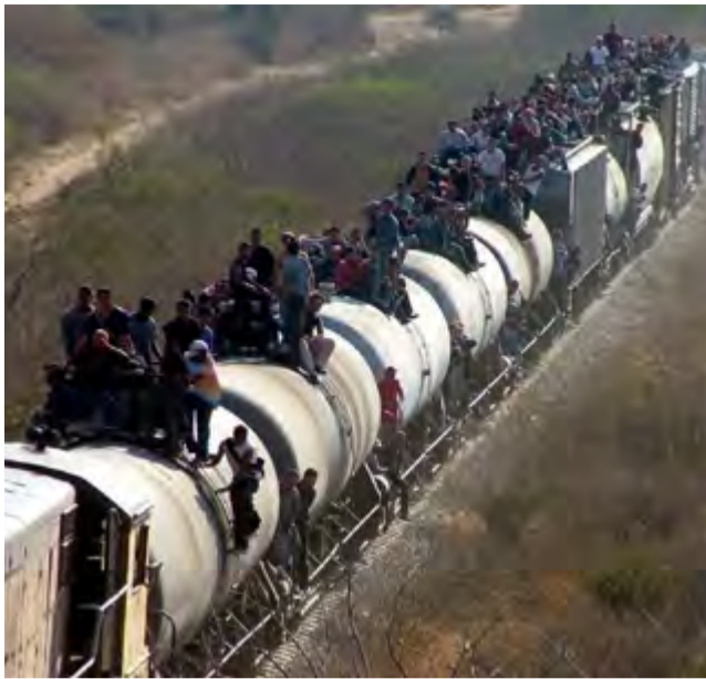
Parten en oleadas, huyen de la pobreza extrema, los desastres naturales, la violencia y los enfrentamientos fratricidas.

Por Rafael Cuevas Molina* Para Firmas Selectas de Prensa Latina