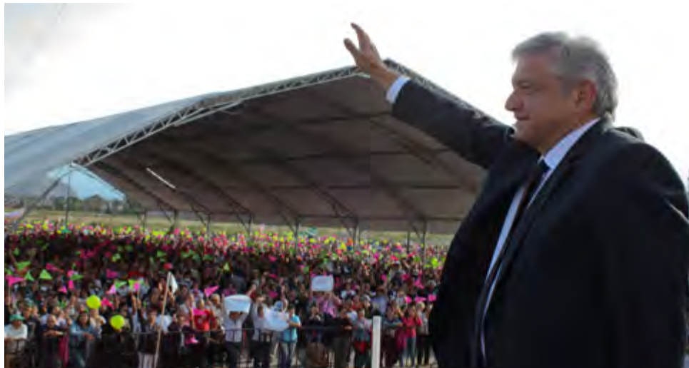
AMLO anuncia la cuarta refundación del país, que tiene como principios básicos desterrar "la corrupción de la mafia del poder" y trabajar por los más necesitados.

López Obrador llegará a la presidencia con un amplio colchón de reconocimiento, refrendado también por el avance del Movimiento de Regeneración Nacional (Morena), del cual es líder y fundador. Morena es el partido con más joven registro nacional y, en alianza con los partidos del Trabajo