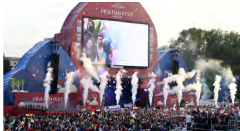
El Fan Fest invita a pasar un momento mágico, de esos que marcan la vida de la gente, por diverso y enriquecedor.

A esas alturas ya corrieron ríos de cerveza por el organismo de los presentes. Para algunos, literalmente, la pantalla gigante se tambalea y entre risas, sus amigos los toorean. Las cosas son caras, pero no tanto; muchos estaban dispuestos a pagar un dineral para ver un partido —cualquiera— de su selección. Son sus ahorros de mucho tiempo y los dilapidan en su felicidad, que es esa, aunque a veces choque comprar una cerveza en pleno día por casi seis dólares (350 rublos). Es el Mundial. Ese fenómeno deportivo y sociocultural que cada cuatro años detiene al planeta y abre caminos, crea alianzas,