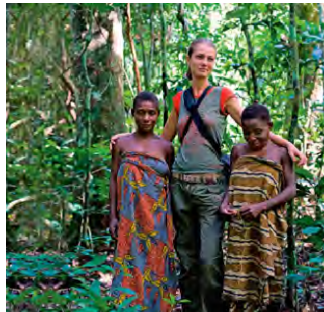
La estatura de los pigmeos adultos es de entre 1,2 y 1,4 metros.

El fenómeno se materializa en particular en Camerún y, al menos de momento, deja intocados a los grupos de esa etnia que viven en los territorios de Gabón y el Congo, pero nada garantiza que la epidemia no se extienda. La pesquisa, patrocinada por el Centro de Investigaciones Científicas de Francia, estableció que la disminución de los partos se debe al consumo desmedido de la mezcla diabólica, sin pasar por alto el daño orgánico que causa