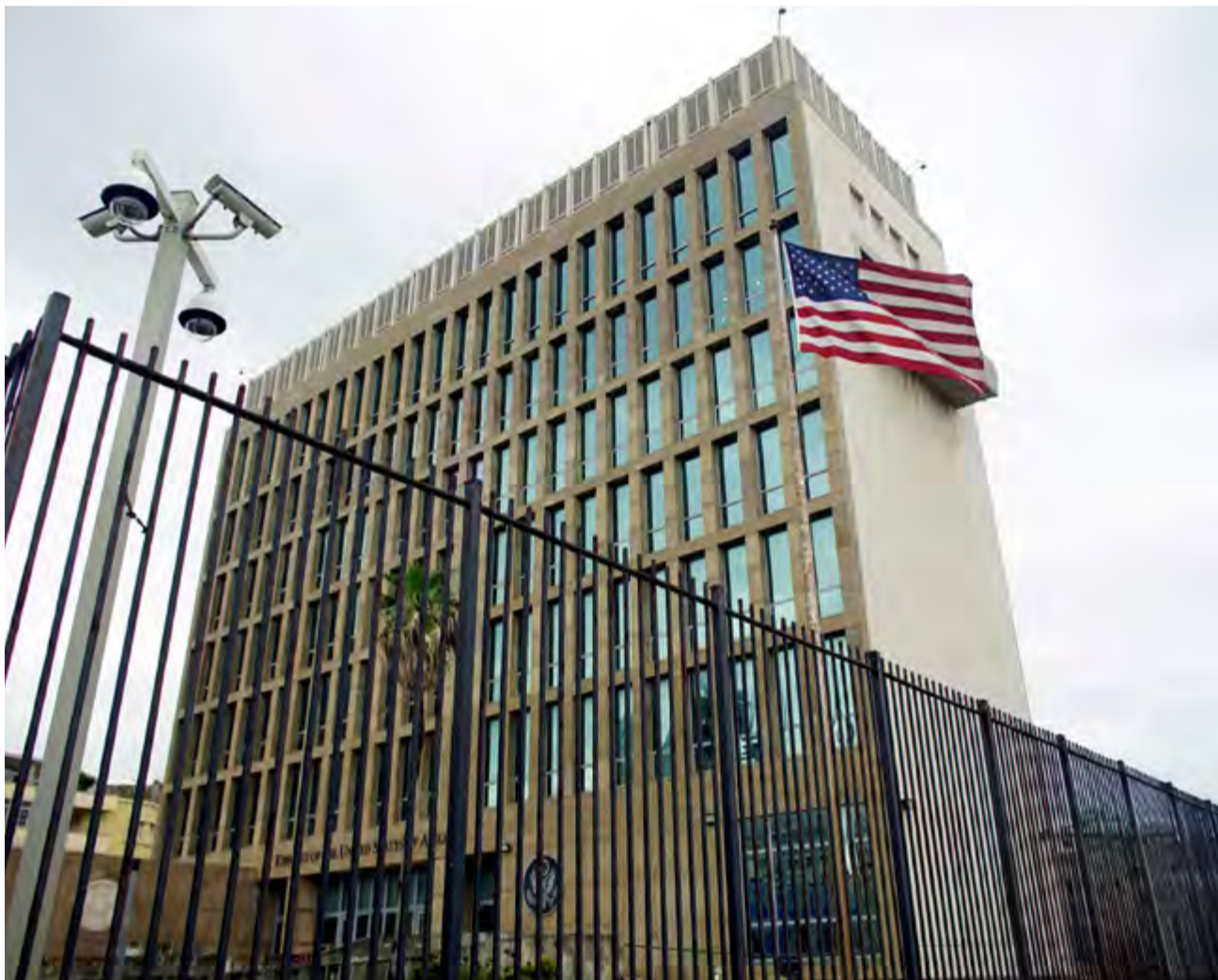
Estos incidentes sirvieron de justificación al Gobierno estadounidense para reducir considerablemente el personal en su embajada de La Habana y expulsar a 17 diplomáticos cubanos de Washington.

personas afectadas. De acuerdo con el especialista, quien se centró en la parte del documento relacionada con su campo, la neurociencia cognitiva, la evidencia sobre esa área es falsa ya que los autores del artículo usaron un umbral para la patología que es demasiado indulgente, y no corrigieron sus datos para comparaciones múltiples. A decir del experto, los datos que el informe divulga son perfectamente compatibles con cualquier distribución normal. “Es decir, no hay evidencia de que seis personas que fueron examinadas con tareas cognitivas presenten algún déficit”.