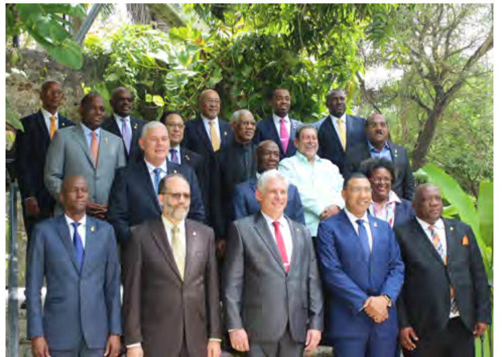
El presidente cubano, Miguel Díaz-Canel (primera fila, centro), quien asistió al encuentro en calidad de invitado especial, sostuvo un intercambio de criterios con los líderes caribeños.

La presencia del presidente cubano constituyó una oportunidad para fortalecer los históricos lazos de amistad, solidaridad y