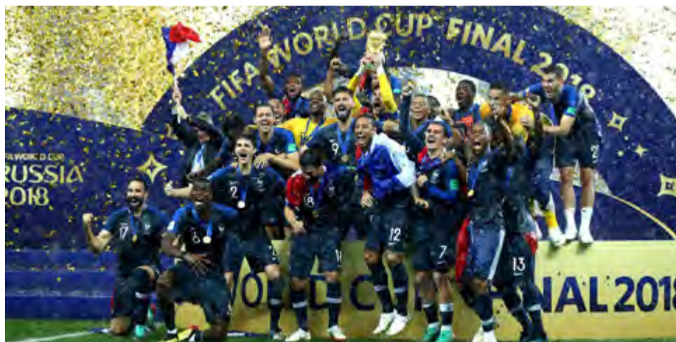
¡Francia campeón mundial!

versal para la nación de la torre Eiffel, con Zinedine Zidane en roles protagónicos.