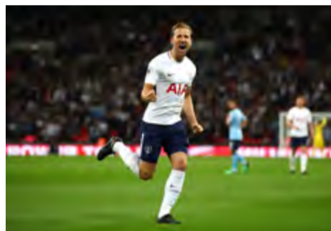
Bota de Oro: Harry Kane, Reino Unido.

Luego de mandar a placer en el grupo D con victorias sobre Nigeria (2-0), Argentina