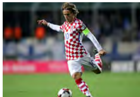
Balón de Oro: Luka Modric, Croacia.

De esa manera, el estratega francés se unió al brasileño Mario 'El Lobo' Zagallo y al alemán Franz 'El Káiser' Beckenbauer