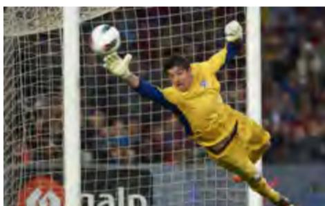
Guante de Oro: Thibaut Courtois, Francia.

como los únicos con el mérito de haber alzado el trofeo en la doble función de jugador y técnico.