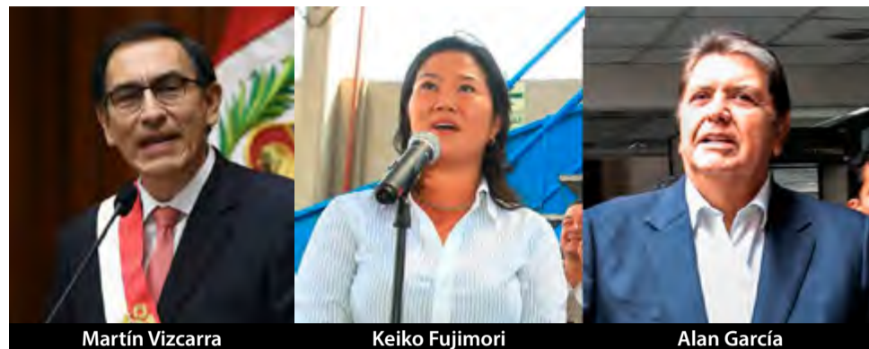
Encabezan la resistencia a la solicitud del presidente Vizcarra, el FP liderado por Keiko Fujimori —que controla el Congreso— y el neoliberal Partido Aprista del expresidente Alan García.