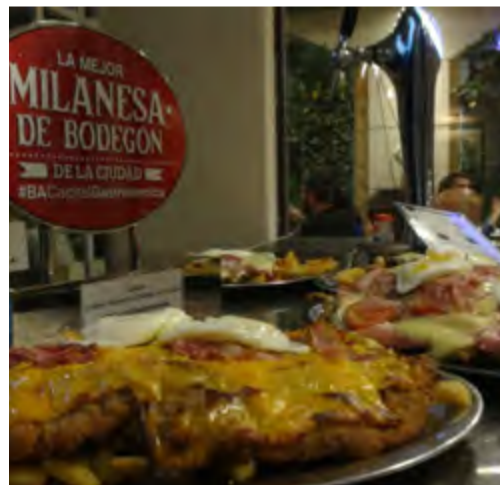
Alimento obligado en esta nación austral.

La milanesa se ha convertido casi en patrimonio gastronómico de los argentinos y de