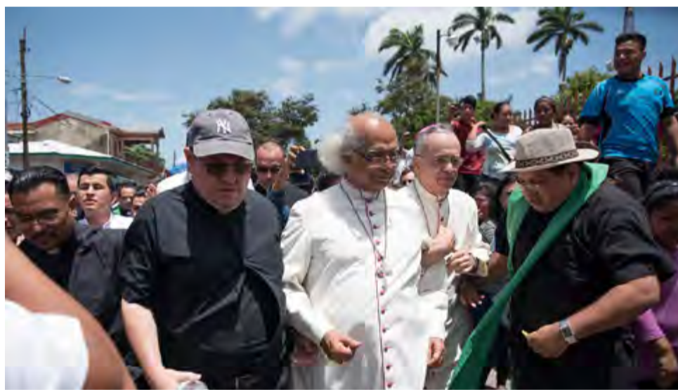
En Diriamba reclamaron a los religiosos por su tardía presencia, pues cuando la ciudad estaba inmovilizada y varios sandinistas fueron torturados, asesinados y vejados, fueron a auxiliarlos.

Incluso cuando se refieren al pueblo, pareciera que solo una parte, aquella que adversa al Gobierno, lo es, mientras el resto son “turbas sandinistas”, “paramilitares” y “parapoliciales”. Lo sucedido en Diriamba, más allá de que pueda ser objeto de críticas y rechazo, revela un hartazgo popular frente a la zozobra y el caos que ciertos sectores de la oposición insisten en mantener, al margen de las leyes y por las vías de hecho. En ese contexto, los habitantes de Diriamba reprimieron a los obispos que se dirigieron en caravana hacia esa localidad, al considerarlos cómplices de golpistas que pretenden derrocar al gobierno sandinista.