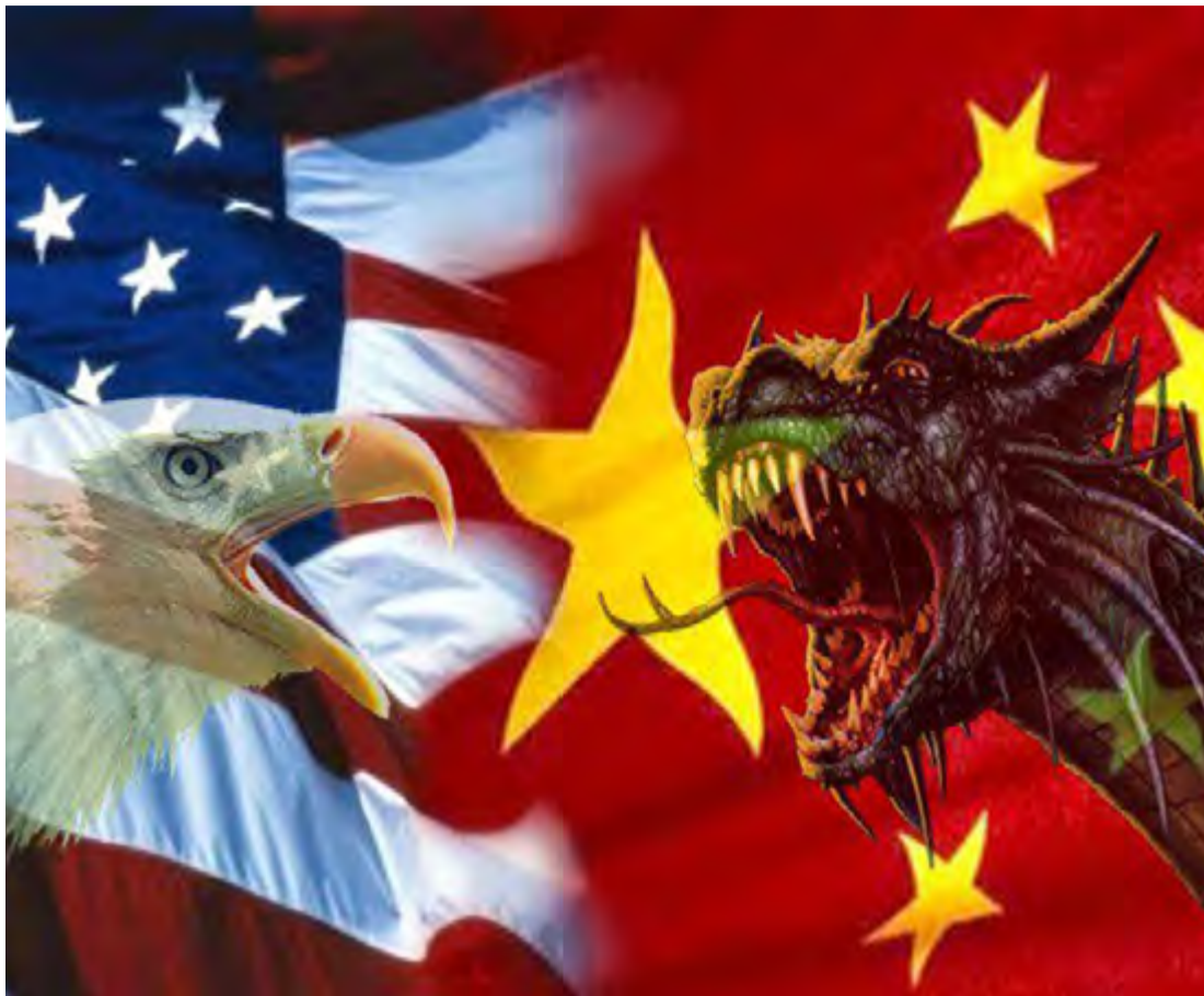
China continuará con la profundización de la reforma y apertura, la salvaguarda del multilateralismo y el libre comercio con Europa, Medio Oriente, Asia, América Latina y África, para contrarrestar los daños.