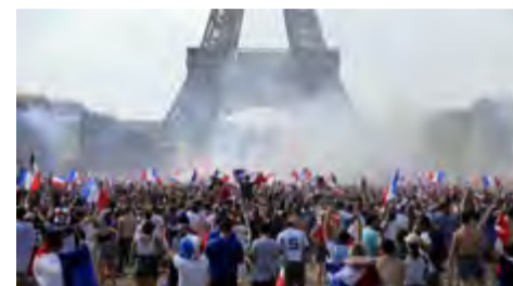
Los parisinos se reunieron junto a la torre-símbolo a celebrar el triunfo.

Aunque jugaron magníficamente bien durante la primera mitad del partido de