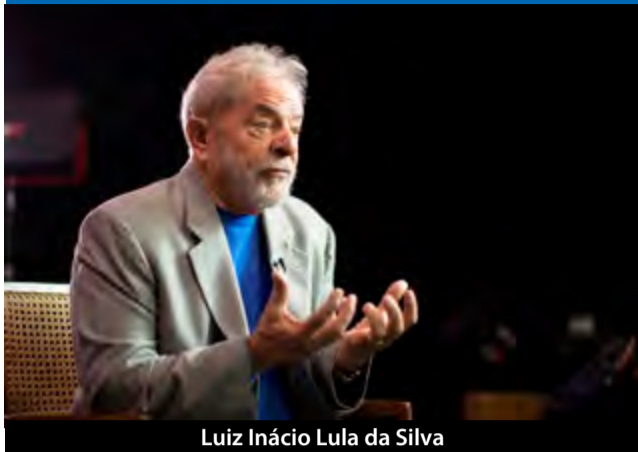
Luiz Inácio Lula da Silva