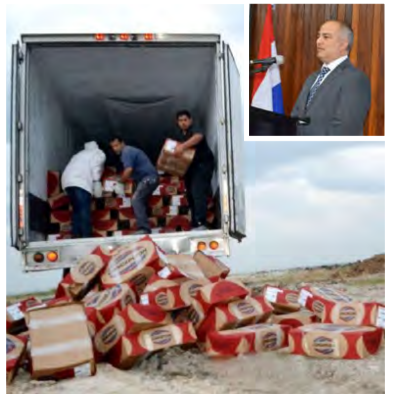
Parecía un sismo de gran intensidad, pero no pasó de "tormenta en un vaso de agua", según lo explicó Freddy Estigarribia, nuevo director de Senacsa.

Referente a los funcionarios de Senacsa involucrados en el tema, sostuvo que cuentan con sumarios administrativos y fueron separados de sus respectivos cargos. No se les separó de sus funciones y están a disposición de Recursos Humanos. Están trabajando, pero ya no son jefes y perciben sus salarios normalmente, dijo. Consultado sobre las "medidas" que se tomaron para evitar este tipo de problemas, destacó: "A las 48 horas de haber asumido el cargo, habilitamos la ventanilla única