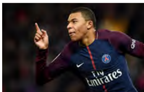
Mejor jugador joven: Kylian Mbappé, Francia.

(3-0) e Islandia (2-1), los croatas accedieron sin problemas a los octavos de final.