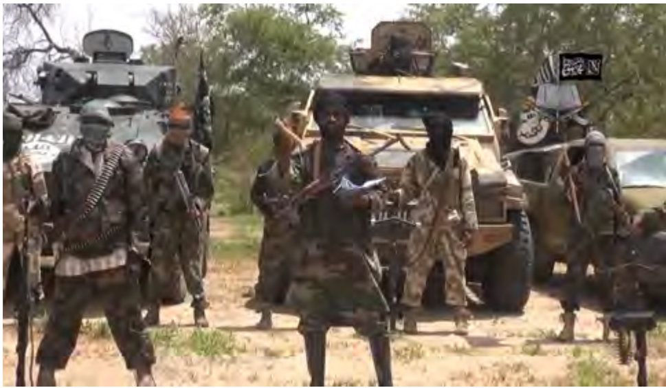
Boko Haram es uno de los grupos terroristas más activos en el África subsariana.