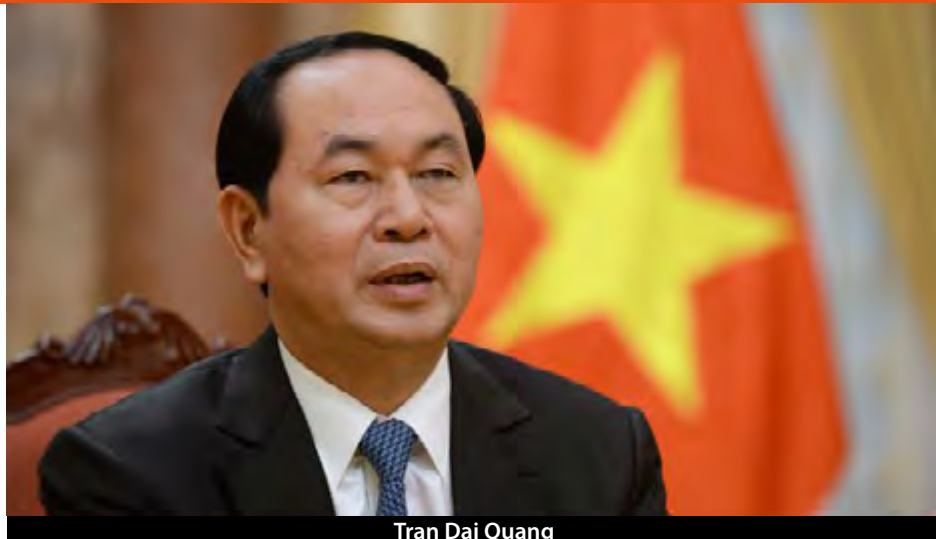
Tran Dai Quang