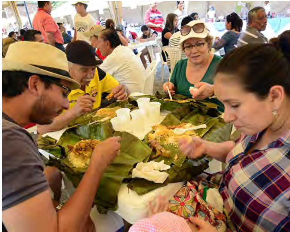
La tonga criolla se ha convertido en un reconocido plato familiar del fin de semana.

Además de mantener en buen estado el alimento, al terminar de comer, los envases podían ser tirados a la tierra, que no sufría ningún tipo de contaminación, pues simplemente se le estaba devolviendo un producto salido de sus entrañas. El