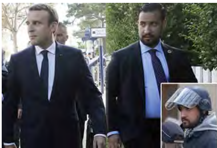
Benalla, cercano colaborador de Macron, vestido de policía fue a la marcha del 1 de mayo y agredió violentamente a algunos manifestantes.

En las votaciones, las dos mociones estuvieron lejos de alcan-