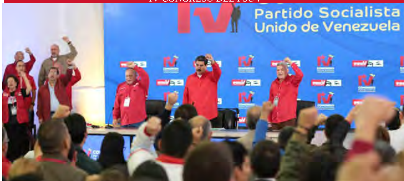
El magno evento partidista debatió propuestas dirigidas a avanzar en la estabilización económica, el crecimiento productivo y la prosperidad de Venezuela, ante un escenario de guerra no convencional.