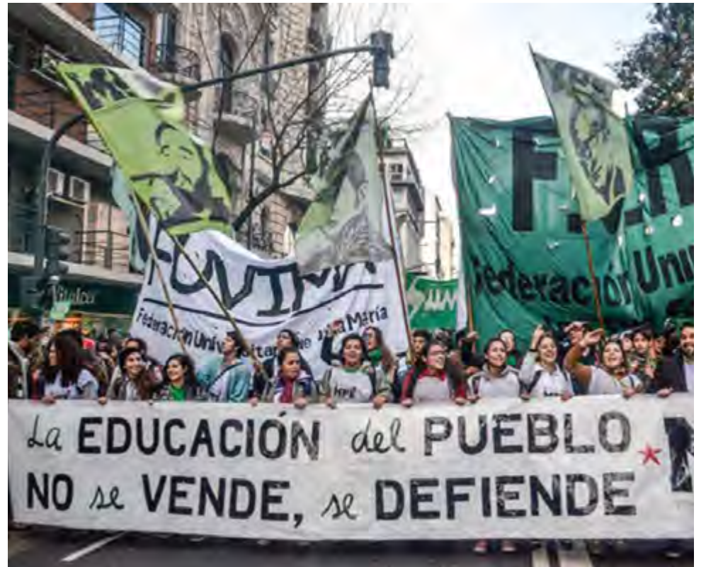
La demanda de las mayorías —educación, salud, seguridad social y derechos de los trabajadores— resultará imposible si no ocurre una radical transformación del Estado existente.

Una vez más, será necesario estar atento a las diferencias entre las sociedades que concurren al mismo proceso. Se trata de un universo de conflictos que va desde Brasil y