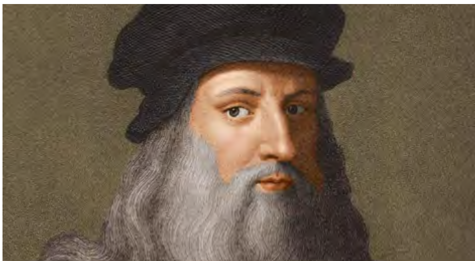
El ya reconocido como genial pintor, escultor e inventor se nos presenta ahora en una faceta musical.