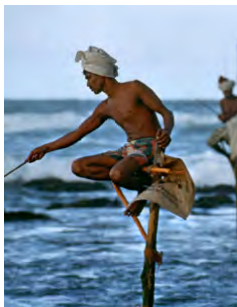
Actualmente es una tradición, a la vez que atractivo turístico único en el mundo.

Otros aseguran que data de cientos de años antes, cuando los pescadores inventaron algo para no tener que salir mar adentro porque, era una difícil tarea atravesar en sus pequeños barcos los arrecifes de coral, donde rompían grandes olas, o sufrir los monzones del suroeste. Lo cierto es que actualmente es una tradición y a la vez atractivo turístico considerado único en el mundo. La altura del palo o riti