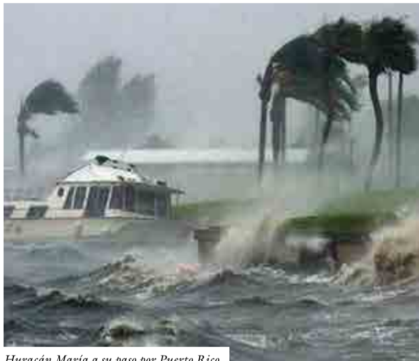
Huracán María a su paso por Puerto Rico.

Las actividades de la fecha este año se centraron en la importancia de empoderar a las mujeres y niñas con autismo y de involucrarlas, tanto a ellas como a sus organizaciones, en las políticas y en la toma de decisiones.