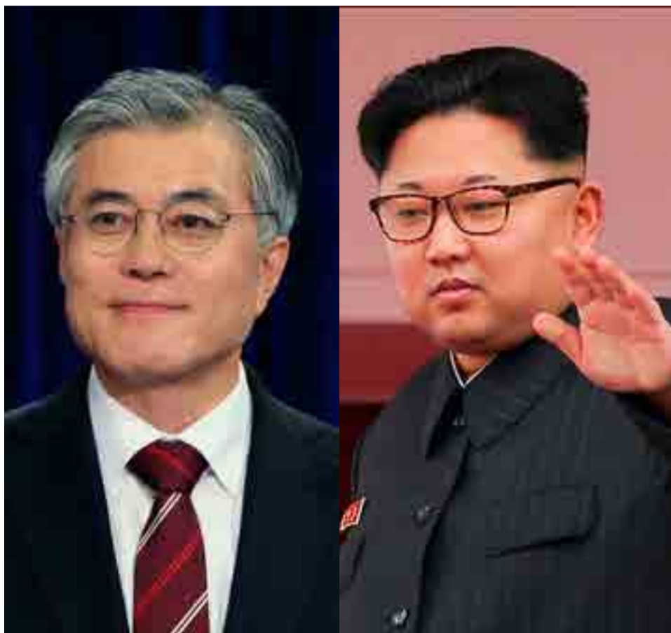
Moon Jae-in (izquierda) y Kim Jong-un sostendrán un encuentro el 27 de abril.

Por Odalys Troya Flores asia@prensa-latina.cu