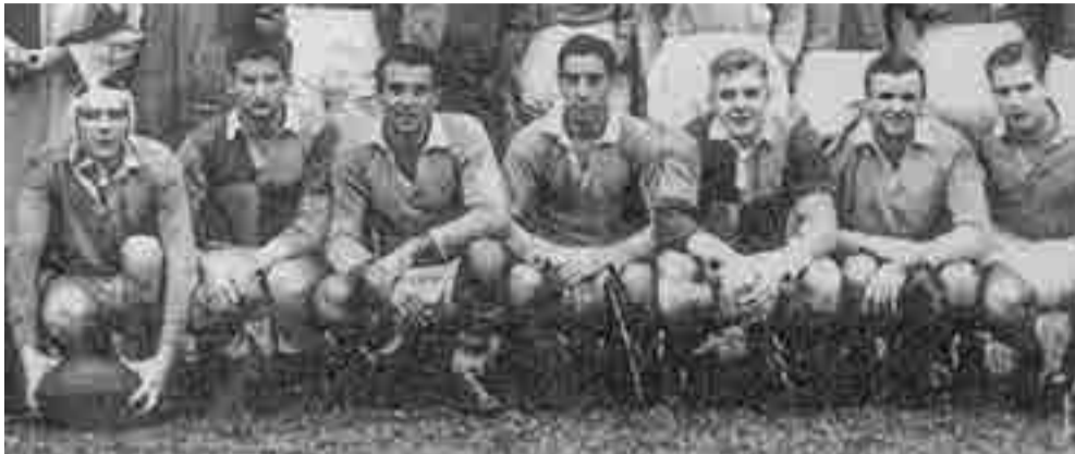
Ernesto Guevara (izquierda) cuando practicaba rugby en su juventud.

Por Rachel Pereda Puñales deportes@prensa-latina.cu