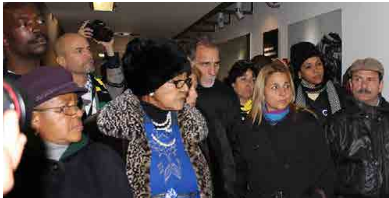
Winnie Mandela acompañó a los Cinco Héroes cubanos en su visita a Soweto, en Sudáfrica.

De ahí nunca se fue, y será así aunque el lunes 2 de abril se difundió la noticia de su muerte, a los 81 años, en el hospital Netcare Milpark de Johannesburgo, donde fue internada tras agravarse su estado de salud.