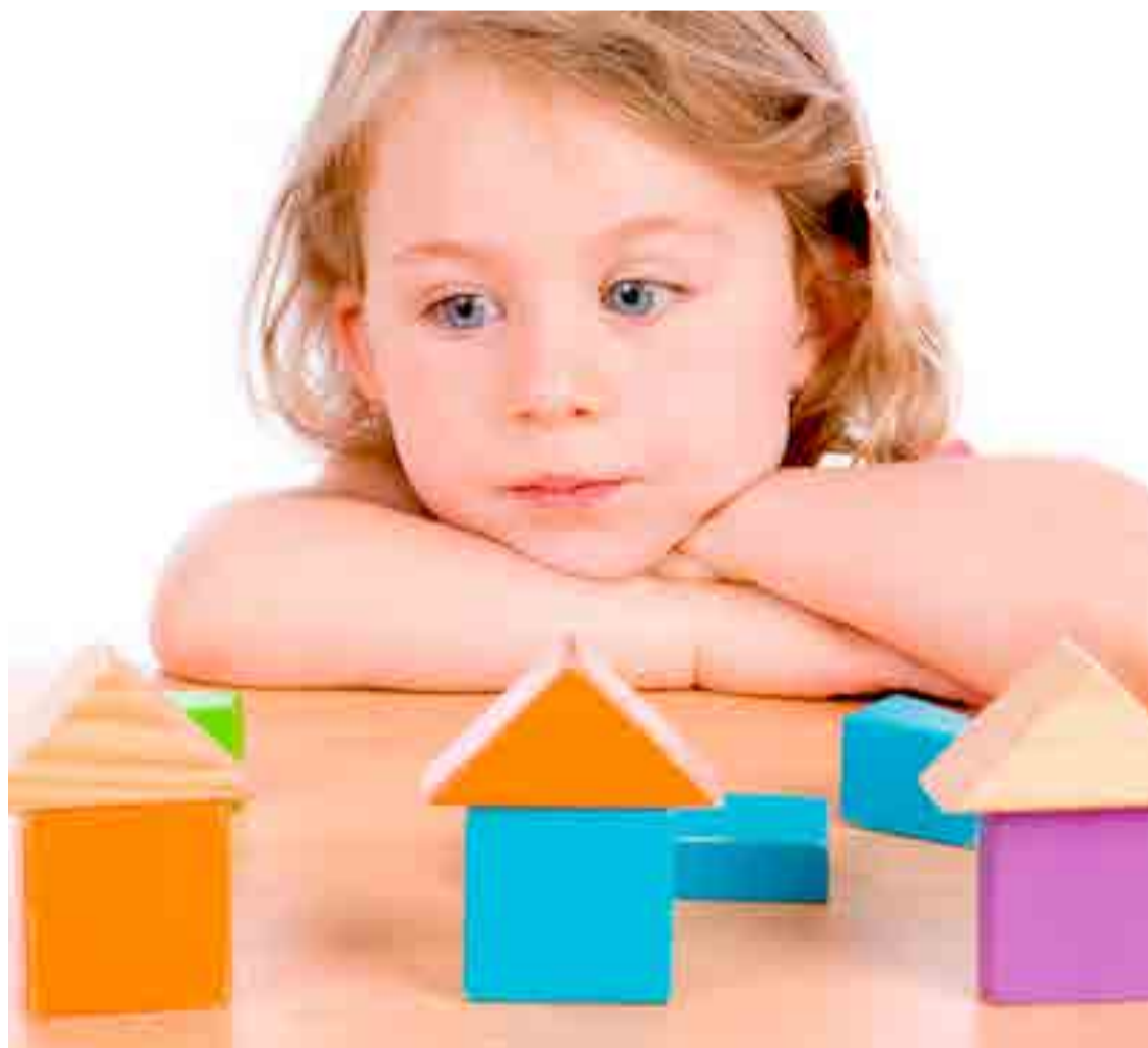
Las féminas con autismo son diagnosticadas con menor frecuencia que los hombres.

En el Atlántico la temporada de huracanes comienza el 1 de junio, mientras que en el Pacífico se inicia el 15 de mayo. Ambas culminan el 30 de noviembre.