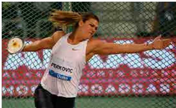
Solo la croata fuera de serie Sandra Perkovic impidió que las cubanas Yaimé Pérez y Denia Caballero reinaran en Doha.