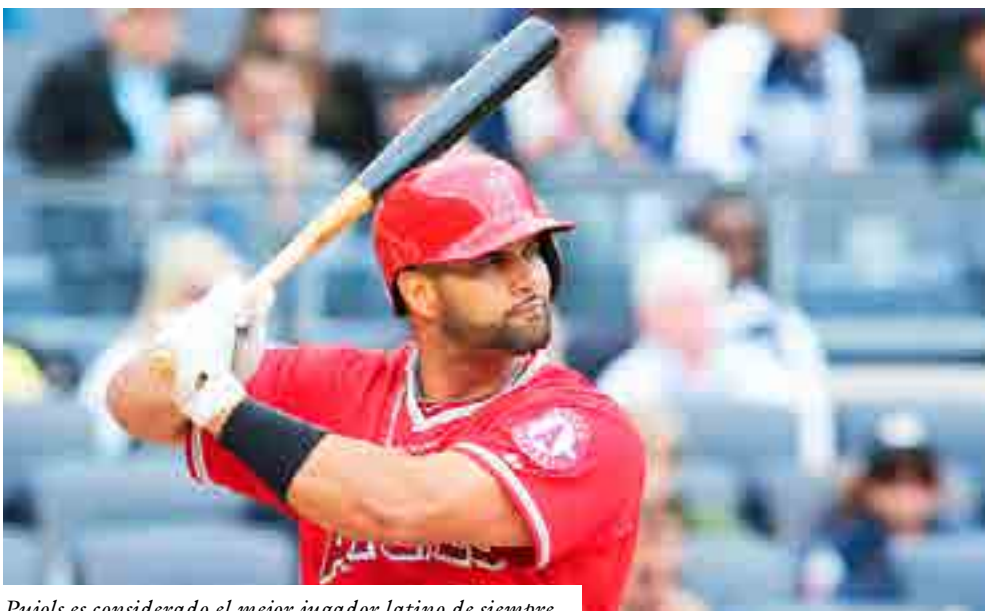
Pujols es considerado el mejor jugador latino de siempre.