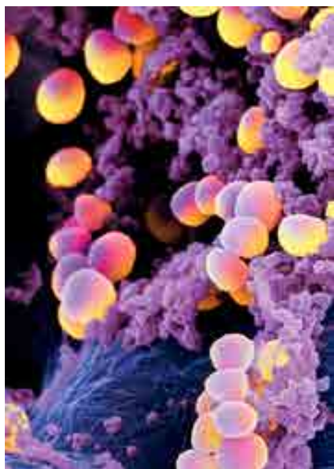
Bacteria Staphylococcus aureus.

Por Reina Magdariaga Larduet cyt@prensa-latina.cu