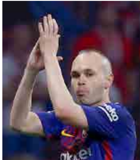
Iniesta marcó una época en el FC Barcelona.

En total, ganó nueve Ligas, cuatro Champions, seis Copas del Rey, siete Supercopas de España y tres de Europa, y tres Mundiales de Clubes, además de completar dos tripletes.