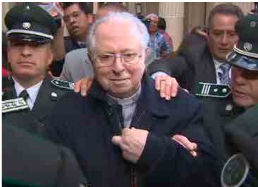
El escándalo del cura Fernando Karadima dio paso a la investigación de otros casos en el seno de la iglesia chilena.