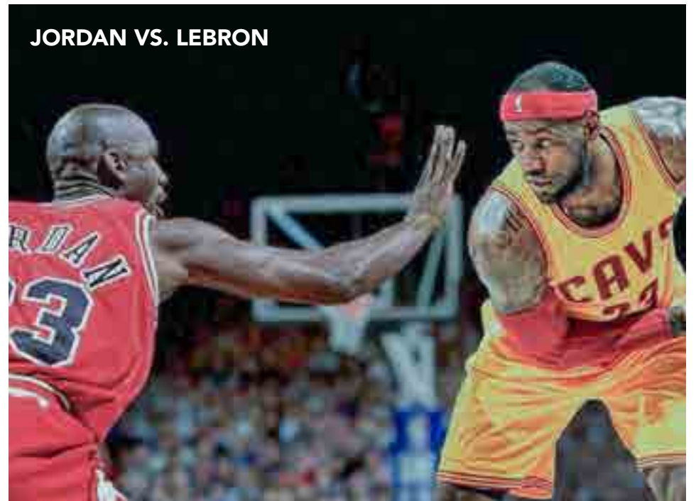
JORDAN VS. LEBRON

Cooperstown aguarda paciente por Pujols, para muchos expertos el mejor jugador de posición latino de todos los tiempos.