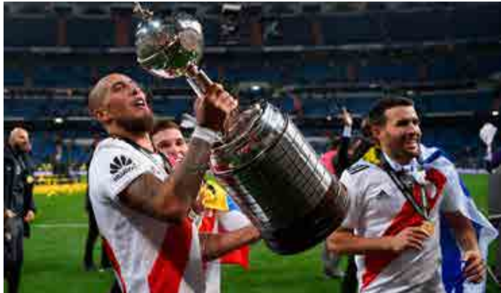
El equipo bonaerense intentará dar la sorpresa en el Mundial de Clubes tras coronarse en la Libertadores.

Por Raúl del Pino Salfrán deportes@prensa-latina.cu