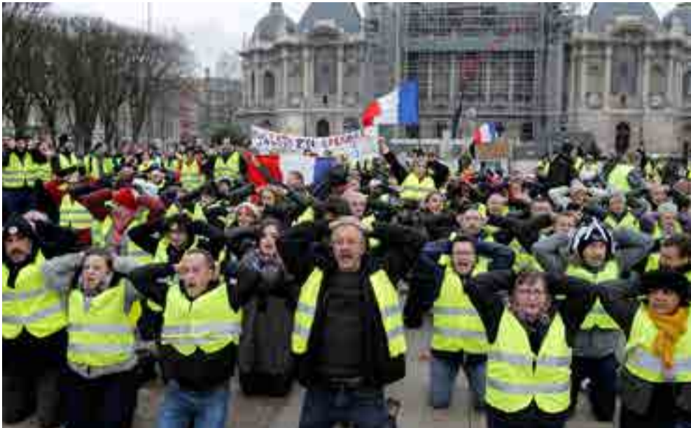
El presidente Emmanuel Macron decretó el estado de "emergencia económica y social" ante las protestas de los chalecos amarillos.