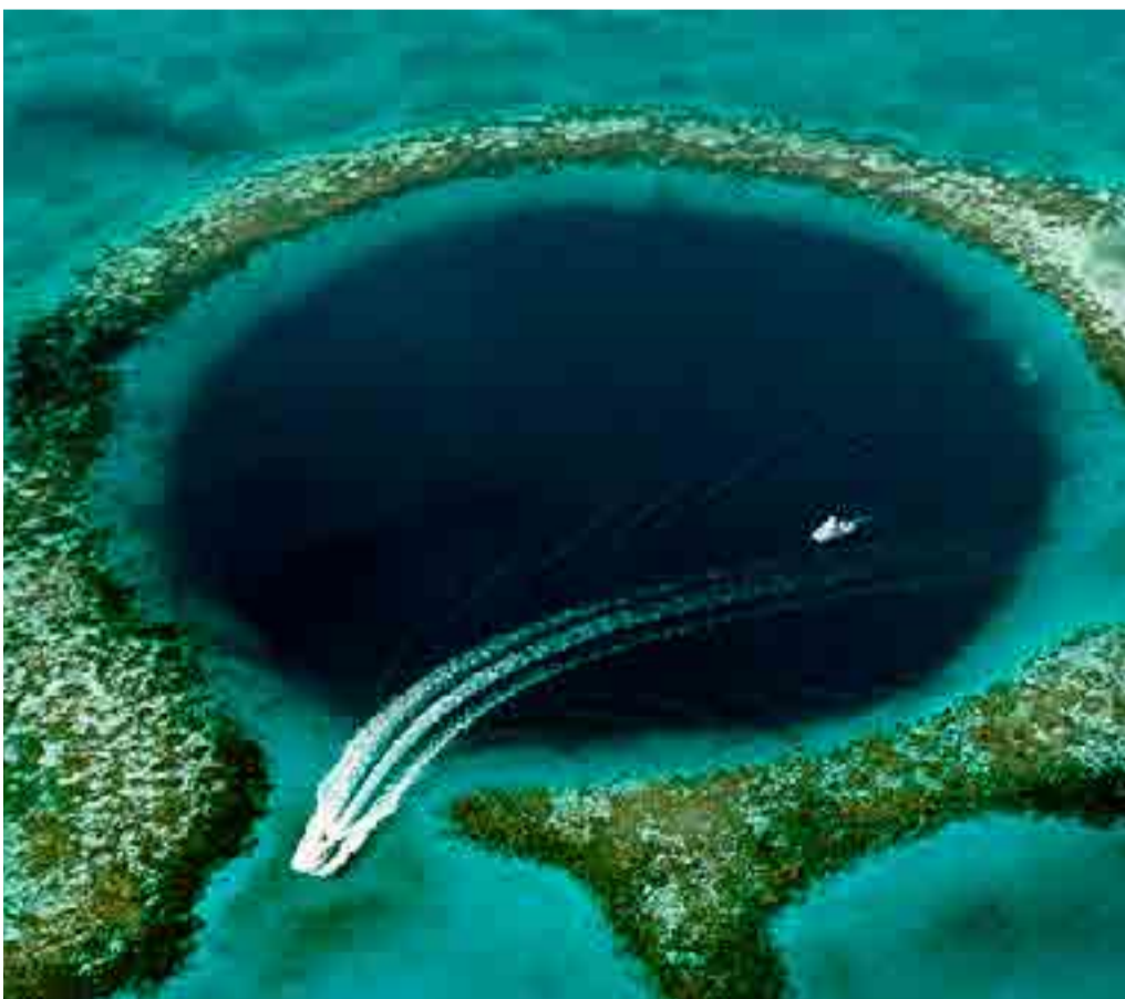
La maravilla marítima fue descubierta en 1960 por el investigador francés Jacques-Yves Cousteau.

La detección del cáncer en una fase avanzada y la falta de diagnóstico y tratamiento son problemas frecuentes, considera la agencia sanitaria de la ONU.