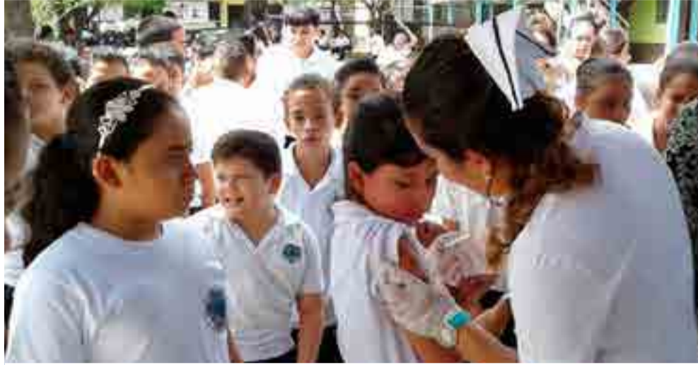
La salud es uno de los sectores priorizados en el proyecto de ley.

En el caso de la salud, las arcas del Estado nicaragüense dedicarán el financiamiento a la edificación de cuatro nuevos hospitales,