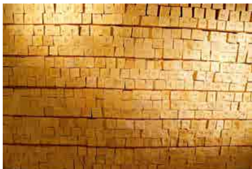
La instalación muestra el proceso artesanal con que se fabricaba ese producto.

Construido en el interior de una vieja casa de ladrillos del siglo XVII, refuerza el recuerdo de aquellos tiempos en los que la pintoresca costa del meridional centro urbano libanés veía partir buques repletos de pastillas de jabón traídos del interior del país o de Alepo, Siria, o fabricados en las factorías de la misma ciudad de Sidón, o incluso de Trípoli, en el norte del Líbano.