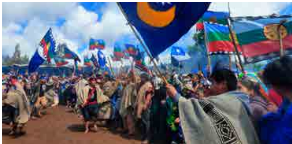
La comunidad mapuche exige el cese de la impunidad tras el asesinato de Camilo Catrillanca.

Luchar por cambiar esta realidad demanda una revolución cultural. Una tarea de profundo significado social y político. Es en