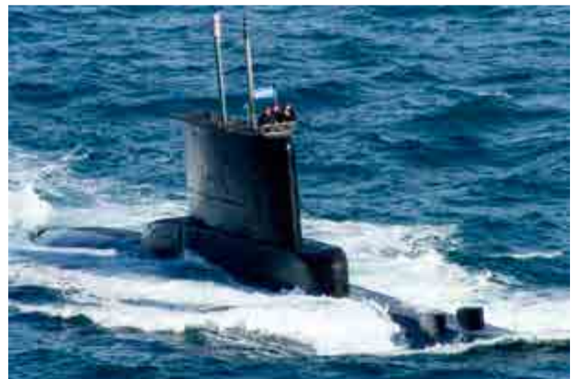
Los restos del submarino fueron encontrados tras un año de intensa búsqueda.