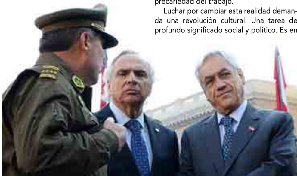
El ministro del Interior de Chile, Andrés Chadwick (en el centro), compareció ante la Cámara de Diputados para ser interpelado sobre la crisis que afronta el cuerpo de Carabineros.