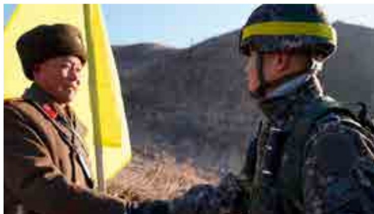
Los gobiernos de Pyongyang y Seúl abrieron varios espacios para la cooperación bilateral.

Con una membresía actual de 10 países —entre los que se encuentran Cuba, Venezuela, Bolivia, Nicaragua, San Vicente y las Granadinas— el ALBA enarbola la solidaridad, la complementariedad, la justicia y la cooperación como principios fundamentales de su eje de acción y de las relaciones entre los Estados miembros. (Con información de Prensa Latina)