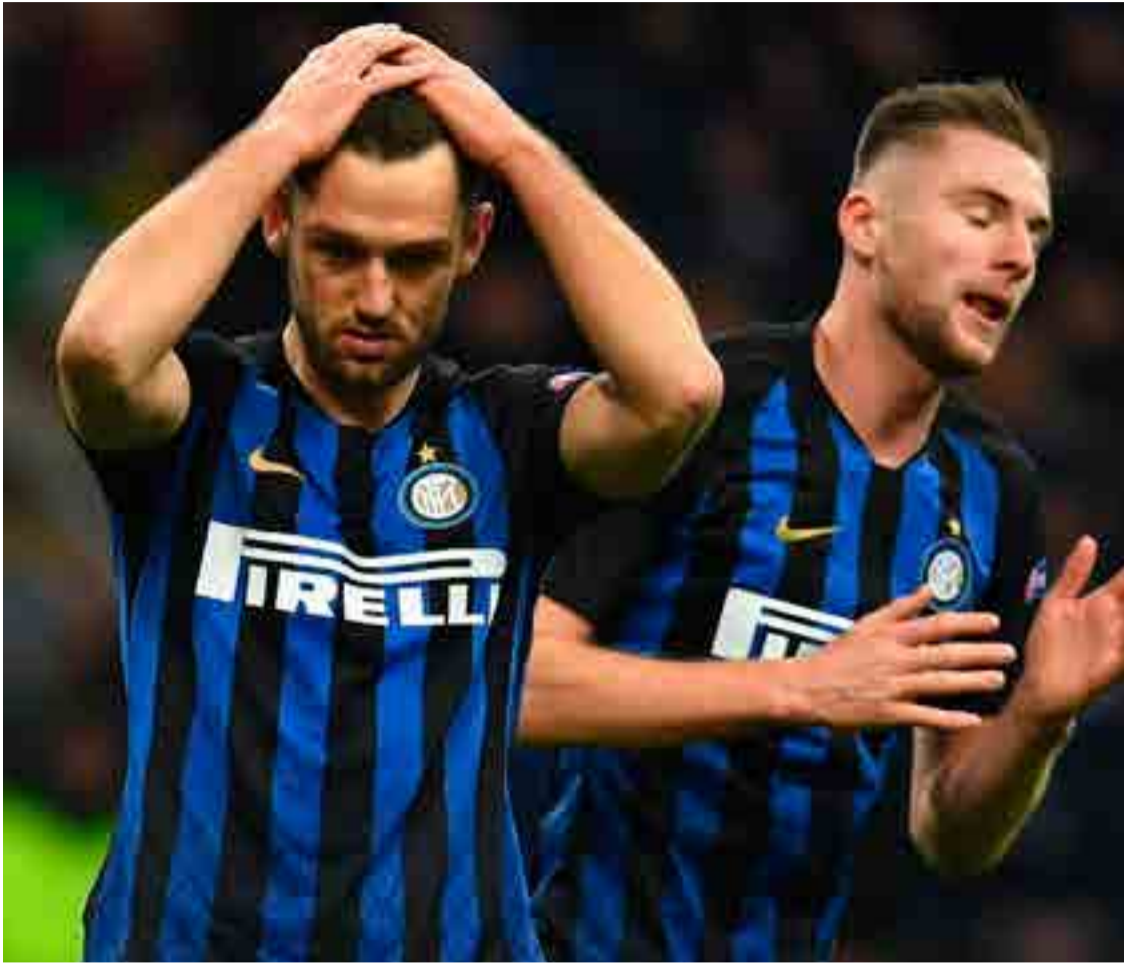
El Inter de Milán quedó eliminado en la fase de grupos, al no aprovechar el empate 1-1 del Tottenham y el Barcelona.