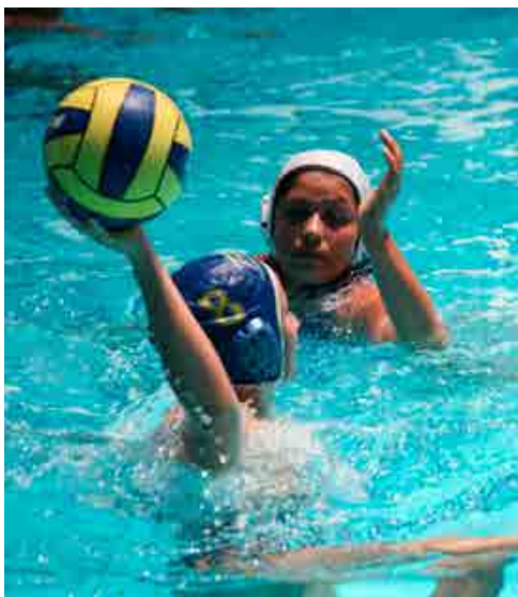
La FINA introdujo cambios para hacer el deporte más atractivo.

Se permitirá además anotar gol tras una falta de cobro directo siempre y cuando esté fuera de la línea de seis metros e incluso tras una jugada de córner sin la exigencia de pasar el balón.