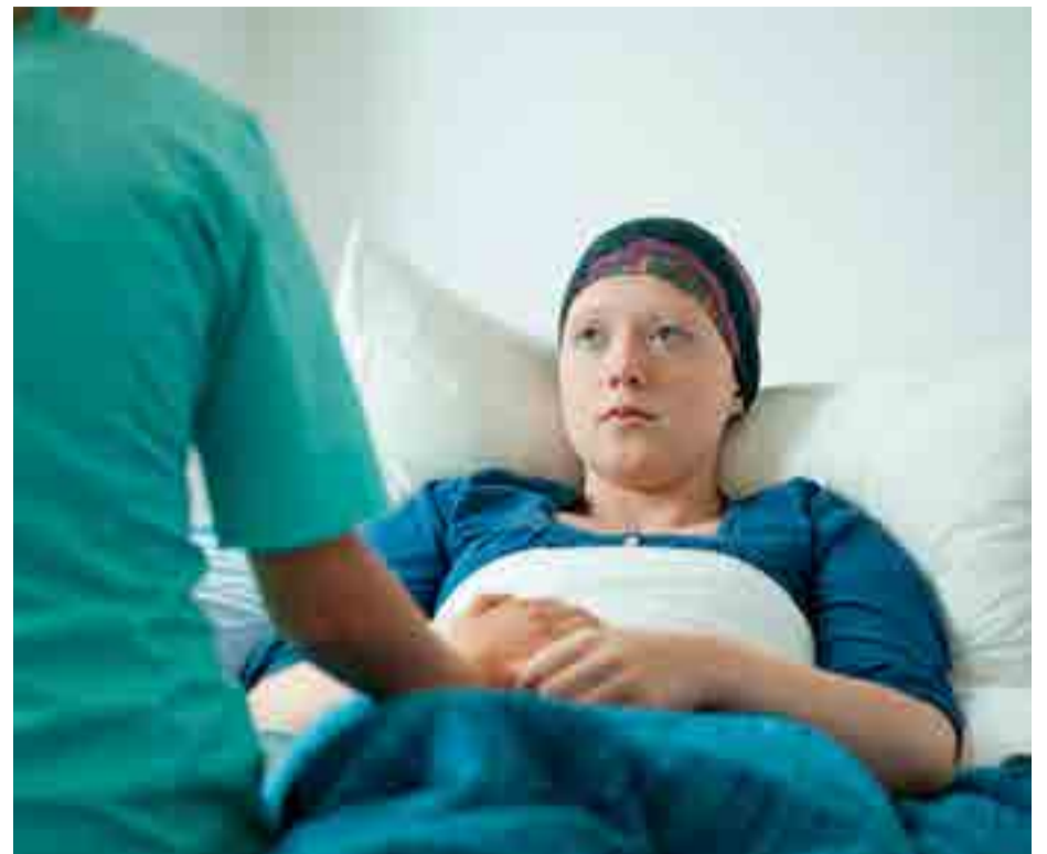
Científicos de la universidad australiana de Queensland desarrollaron una prueba capaz de descubrir cualquier tipo de célula cancerosa en el organismo.

Los cayos más destacados del arrecife coralino son El Arrecife (considerado el más grande del hemisferio occidental), Ambergris, Caulker, Glover's Reef, Tabaco y Lighthouse Reef.