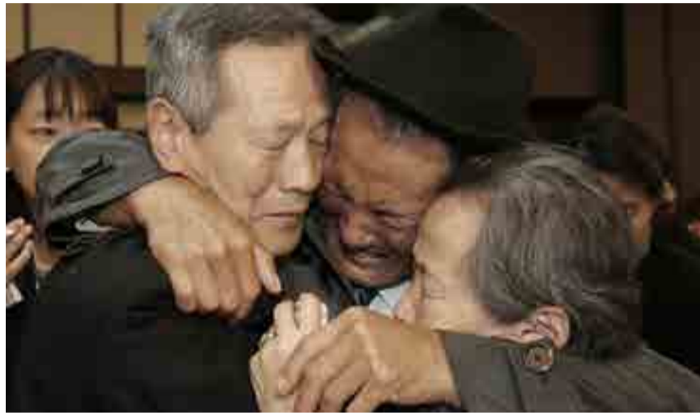
En años recientes Pyonyang y Seúl facilitaron el reencuentro de familiares.

proponen los políticos norteamericanos? Una rendición incondicional de Corea del Norte y su integración al Sur. Esto significaría una ocupación militar norteamericana del norte de Corea.