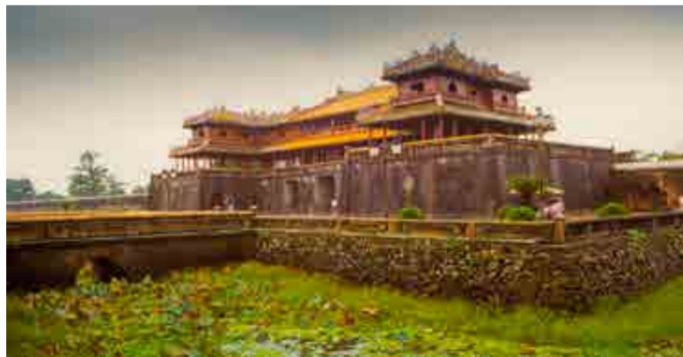
El conjunto patrimonial de Hue, en Vietnam, sufrió los bombardeos estadounidenses.

Así también ocurrió con otros significativos monumentos iraquíes como el Museo Nacional y la Biblioteca, saqueados por soldados estadounidenses, émulo de aquellos que incendiaron libros en la plaza de la Ópera de Berlín, en 1933.