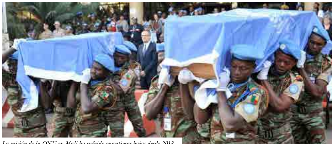
La misión de la ONU en Mali ha sufrido cuantiosas bajas desde 2013.

Según estadísticas de Naciones Unidas, de alrededor de 3 500 cascos azules muertos en el planeta desde 1948, 943 cayeron durante actos violentos, incluidos 195 desde 2013, fecha a partir de la cual es notable el aumento de los ataques contra ellos.