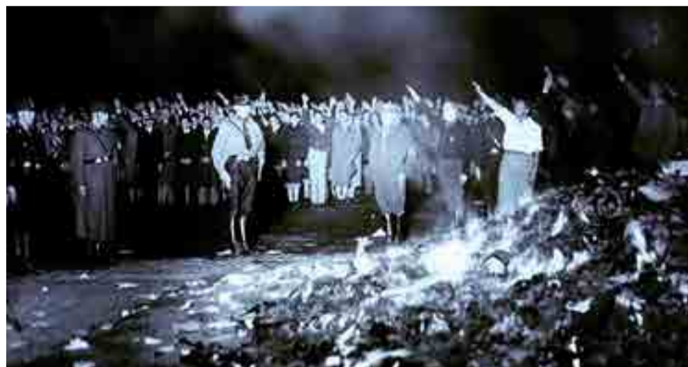
La Alemania nazi quemó miles de libros como parte de su campaña propagandística.