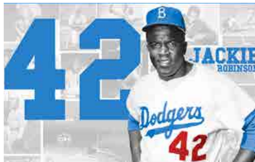
Robinson abrió el camino a los negros en Grandes Ligas.

Las campañas mediáticas sobre aguerridos y peligrosos fanáticos rusos, el robo en las calles o el maltrato de los espectadores suenan grotescas para quienes viven en el país anfitrión y se disipan nada más pisar la tierra de Pushkin, Mendeleev, Gagarin o Lenin. El mundo lo podrá comprobar pronto.