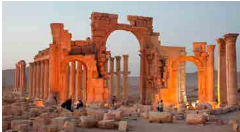
La ciudad de Palmira ha visto afectadas sus ruinas históricas por la guerra en Siria.

De esa forma, se identifica el caso de la localidad siria de Quneitra, en las Alturas