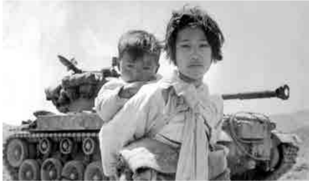
La intervención militar de Estados Unidos dejó profundas secuelas a la nación coreana.

EE.UU. nunca ha aceptado sentarse a negociar con Corea del Norte. En años recientes, Corea del Sur mostró interés en negociar con su contraparte del Norte pero ha sido desautorizado por Washington. ¿Qué