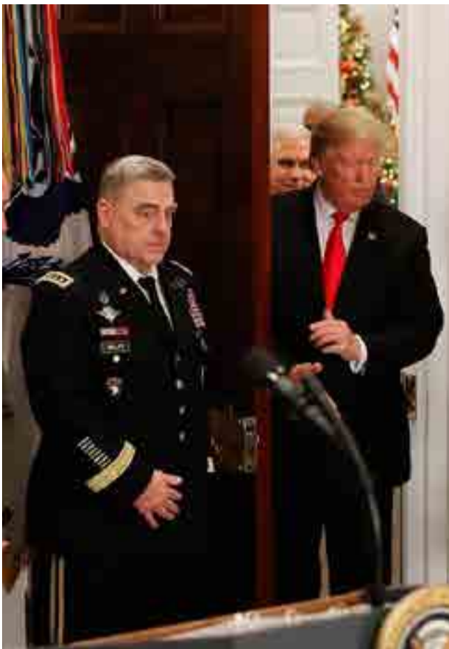
El Gobierno de Trump se debate entre su política de aislacionismo y la adhesión al complejo militar industrial.

Si vemos su reciente rendimiento económico, el gigante no está en expansión, no está en crecimiento sostenido como lo estuvo durante décadas desde mediados del siglo XIX. Terminada la Segunda Guerra Mundial, su producto interno bruto representaba el 52 por ciento de la producción