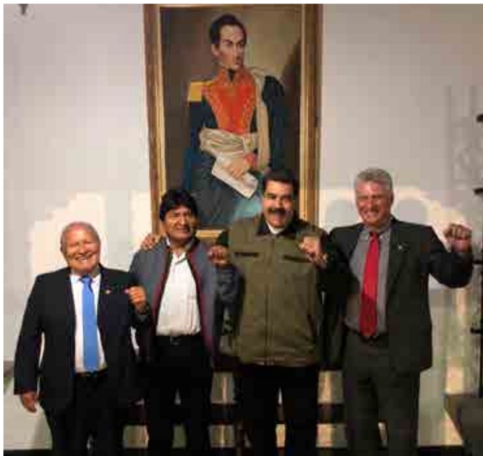
Los países del ALBA ratificaron su respaldo a la Revolución Bolivariana.

“Hermanos de lucha, hermanos de sueños. Unidos a favor de la integración latinoamericana y caribeña. Apoyando al presidente Maduro, a la unión cívico militar y al pueblo venezolano”, expresó Díaz-Canel a través de la red social Twitter.