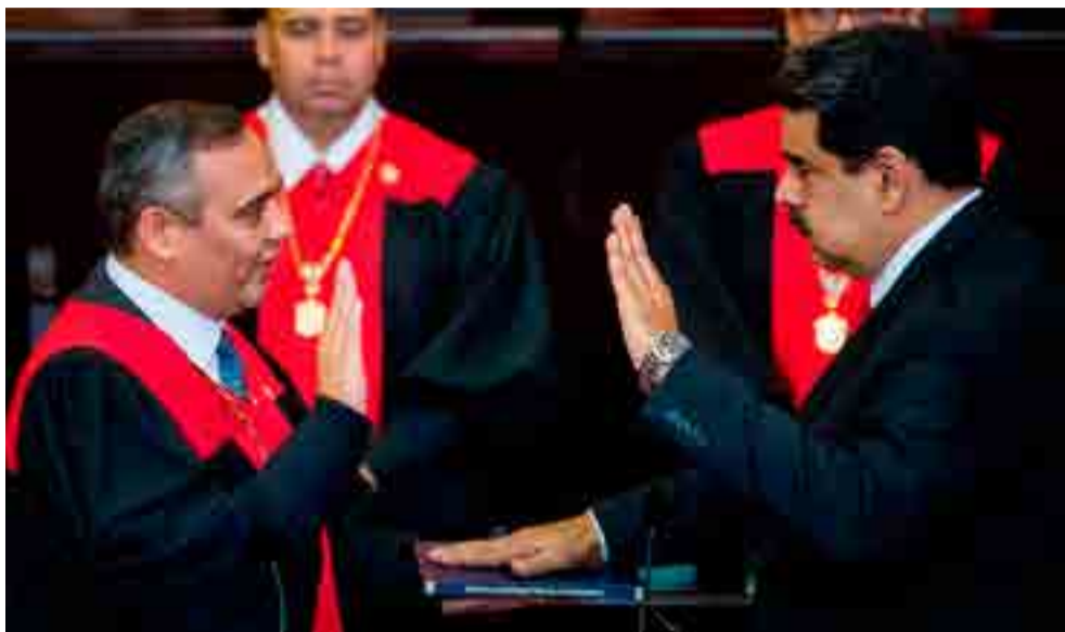
Nicolás Maduro fue juramentado este 10 de enero para asumir un nuevo mandato hasta 2025.

Respaldado el 20 de mayo de 2018 por el voto de más de seis millones 248 000 venezolanos —alrededor del 67 por ciento de los sufragios—, Nicolás Maduro llamó a vencer la corrupción a través de “una gran revolución moral y espiritual”, en un nuevo comienzo “que renueve la energía y esperanza de un pueblo noble, capaz de dar la