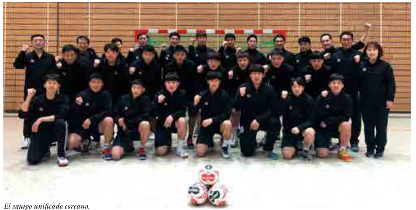
El equipo unificado coreano.

Esta sería la primera ocasión en que la cita de los cinco aros se organizaría por dos naciones, lo cual sería un acontecimiento mundial y un ejemplo para aquellos pueblos que aún no alcanzan la paz definitiva.