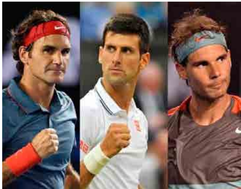
Federer, Djokovic y Nadal asoman como los favoritos.

La principal carta latinoamericana será la puertorriqueña Mónica Puig, monarca olímpica de Río de Janeiro y única tenista de la región ubicada entre las 100 primeras del listado mundial (peldaño 53).