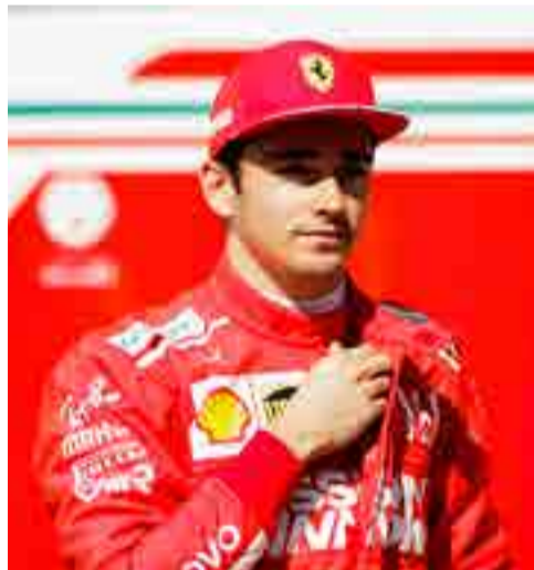
Charles Leclerc llega a Ferrari para ganar.

Pero Ferrari, que no conquista el título individual desde 2007, no solo se conforma con tener el mejor motor y la mejor aerodinámica, pues casi todos están parejos, sino también en tener la mejor eficiencia como equipo y, obviamente, con ganar.