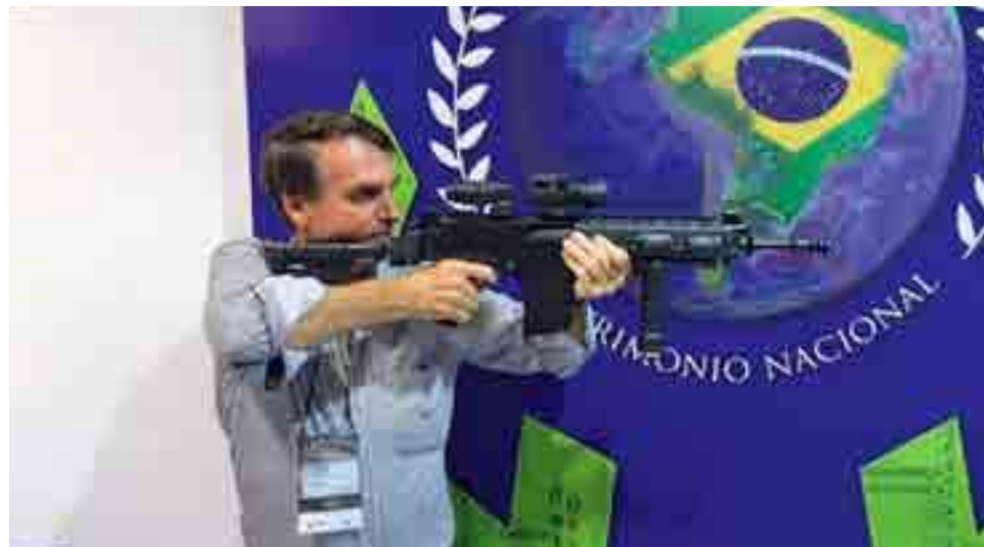
El presidente brasileño Jair Bolsonaro llegó a ofrecerle a Estados Unidos la posibilidad de instalar una base militar en el país suramericano.

El reportaje detalló que la propuesta de una base “tomó a los militares por sorpresa, aún más al venir de un egresado de las filas