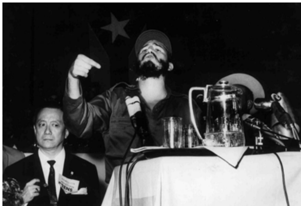
El encuentro recordará el aniversario 60 de la Operación Verdad convocada por el líder histórico de la Revolución cubana Fidel Castro.

Los participantes también tendrán ocasión de conocer de primera mano la realidad cubana, especialmente sobre su política internacional, económica, de comercio exterior, inversión extranjera y turismo.