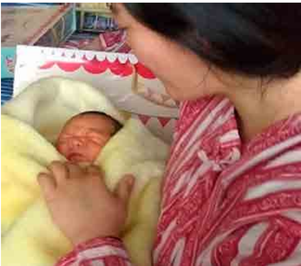
El cuidado de los bebés recién nacidos y las madres gestantes es parte de la estrategia de desarrollo económico del Estado de la RPDC.

Las instantáneas con alta resolución, tomadas por las sondas espaciales Voyager y Cassini, aportaron la existencia de 3 aros pálidos: E, F y G, que quedan fuera del A. Sin embargo, los principales, según los especialistas, son A, B y C, que miden unos 275 000 kilómetros de anchura anular.