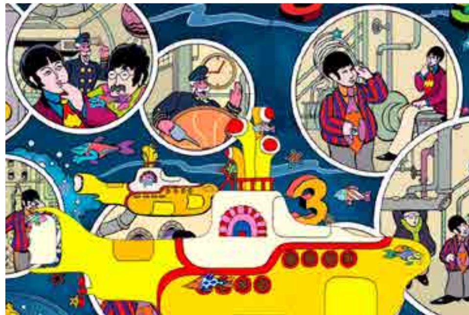
El álbum Submarino Amarillo , de The Beatles, fue lanzado el 13 de enero de 1969.

El viaje continúa. John Lennon (guitarra rítmica, vocalista), Paul McCartney (bajo, vocalista), George Harrison (guitarra solista, vocalista) y Ringo Starr (batería, vocalista) son historia. Siguen viajando por el mundo en su submarino amarillo.