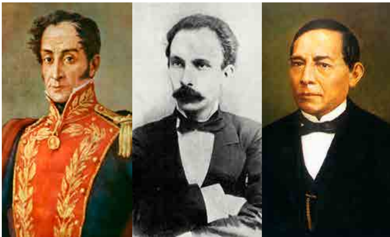
Simón Bolívar, José Martí y Benito Juárez siguen guiando con sus ejemplos la senda del latinoamericanismo.

En mensaje a la nación, AMLO también delineó los tres ejes de su futuro gobierno: el primero, la regeneración de la