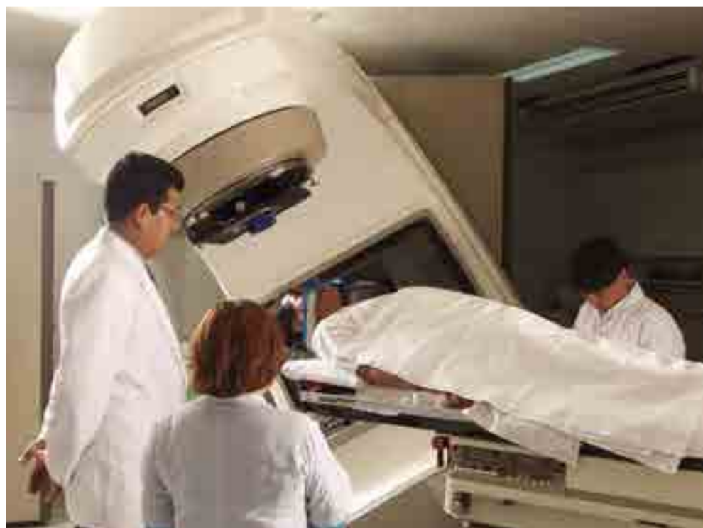
Esa tecnología constituye un importante factor de desarrollo en campos como el de la salud.

Según la ABEN, el centro tendrá un reactor experimental de agua ligera a presión con una potencia nominal de unos 200 kilovatios, una fuente de irradiación gamma e incorporará estrictas medidas de seguridad y protección radiológica.