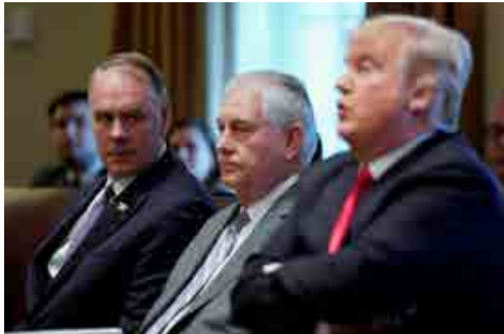
Ryan Zinke (derecha) sumó otra baja en la administración republicana.

John Kelly se irá hacia el final del año, manifestó el gobernante republicano el 8 de diciembre, cuando se refirió al jefe de gabinete como "un gran tipo" y dijo que apreciaba mucho su servicio.