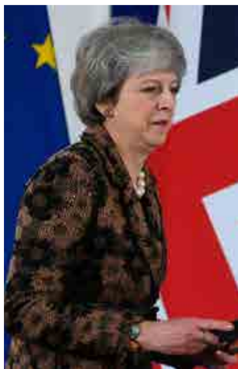
Theresa May anunció el aplazamiento hasta el año próximo de una votación en el Parlamento.

Por Glenda Arcia europa@prensa-latina.cu