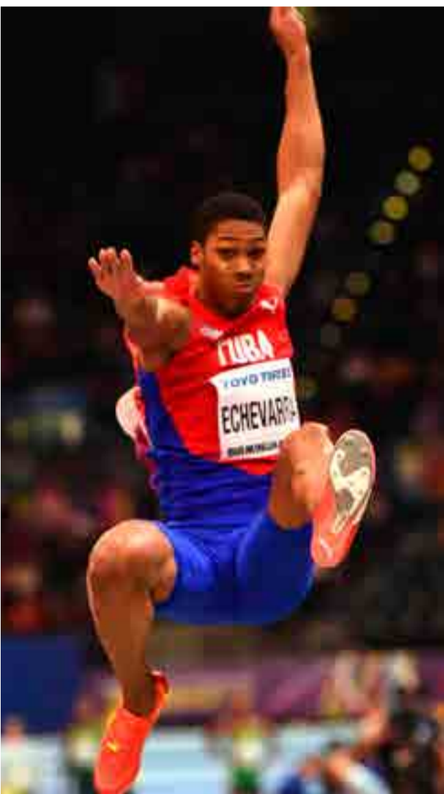
Echevarría sobresalió en la temporada con un impresionante salto de 8,83 metros.

Domadores de Cuba sucedió en el trono de la encuesta al equipo masculino de fútbol de Brasil, máximo ganador de la historia del sondeo, con nueve lauros.