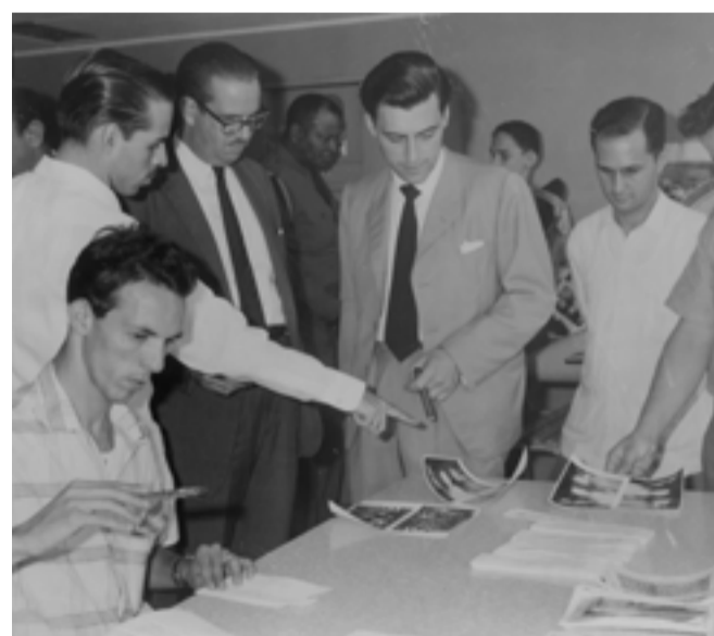
Una buena información es mejor con testimonio gráfico.