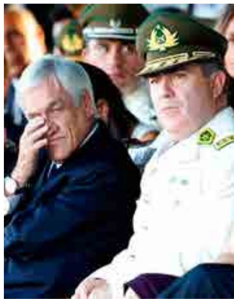
Al presidente Sebastián Piñera le exigen la destitución del general Hermes Soto (derecha).

Desde que se conoció de los falsos testimonios y violaciones cometidas por las fuerzas especiales de Carabineros alrededor del homicidio, políticos, personalidades, organizaciones y la familia de la víctima piden insistentemente la renuncia