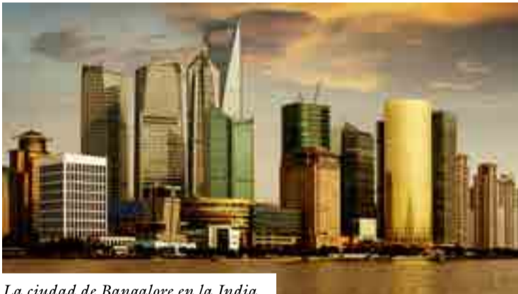
La ciudad de Bangalore en la India.

Ivette Fernández Sosa economia@prensa-latina.cu