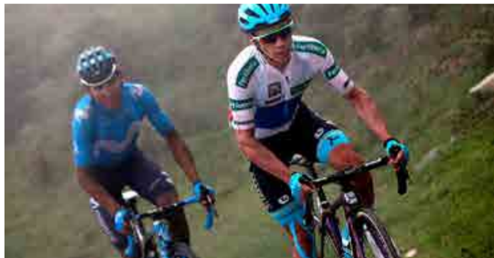
Los colombianos Miguel Ángel López (derecha) y Nairo Quintana, dos de los latinos más destacados.

Por Carlos Bandines Machín deportes@prensa-latina.cu