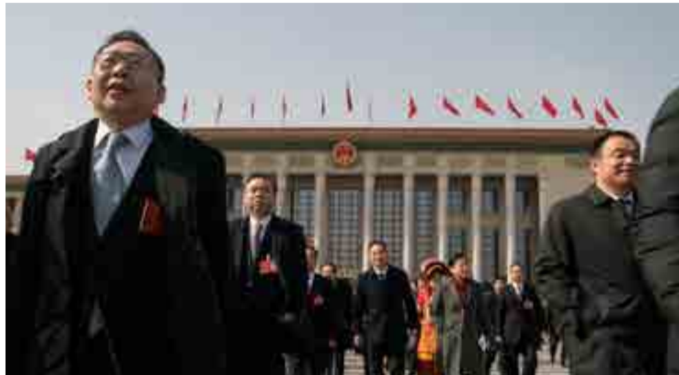
En 2018 la Asamblea Popular Nacional aprobó 21 modificaciones constitucionales, la mayoría enfocadas en el enfrentamiento a la corrupción.

Precisamente, la mayoría de las 21 modificaciones constitucionales guarda relación con la lucha anticorrupción, por lo que el máximo texto legal ahora reconoce como nuevo órgano estatal a la Comisión Nacional de Supervisión, adjunta al brazo disciplinario del PCCh.