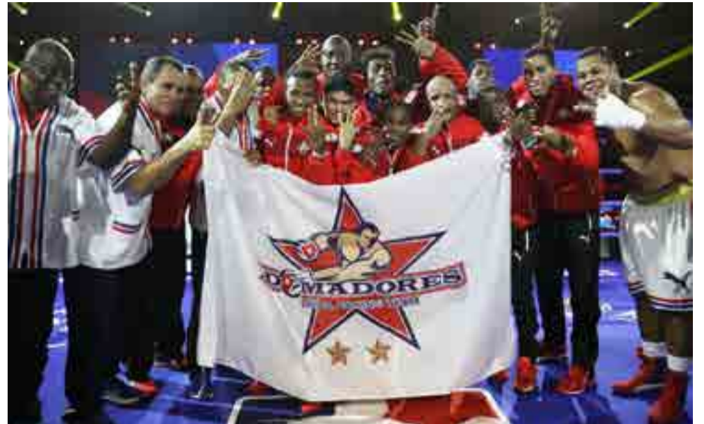
Los Domadores cubanos reinaron en la VIII Serie Mundial de Boxeo.