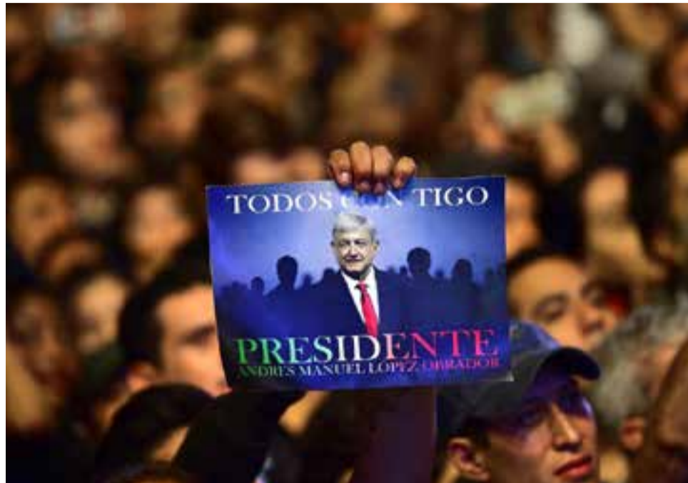
AMLO fue a las urnas por tercera ocasión y esta vez se impuso de manera arrolladora.

López Obrador llegará al gobierno con un amplio colchón de reconocimiento, refrendado también por el avance del Movimiento de Regeneración Nacional (Morena), del cual es líder y fundador.