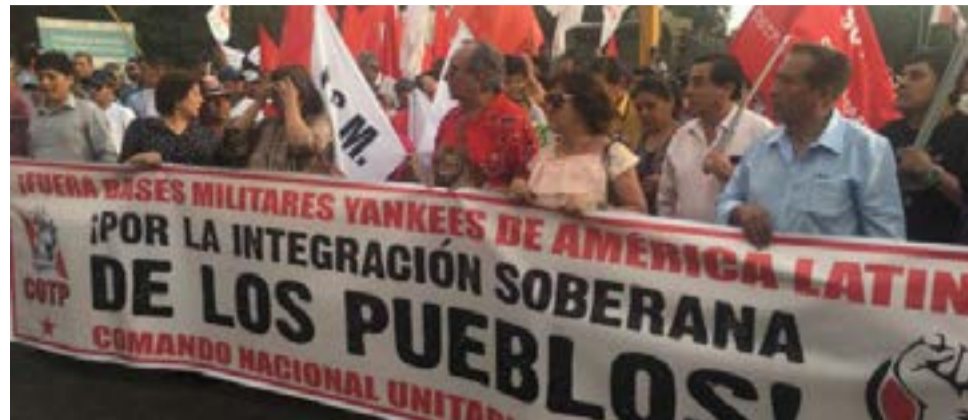
La Cumbre de los Pueblos devino en genuino diálogo entre latinoamericanos.

Sin embargo, la revolución iniciada por Hugo Chávez se hizo escuchar con contundencia en la cumbre de mandatarios por intermedio del presidente boliviano, Evo Morales; y del canciller