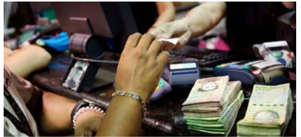
Los efectos de la guerra económica se sienten a diario en el bolsillo de la población.

Es evidente que esta matriz agresiva impulsada por la cotización ilegal del dólar forma