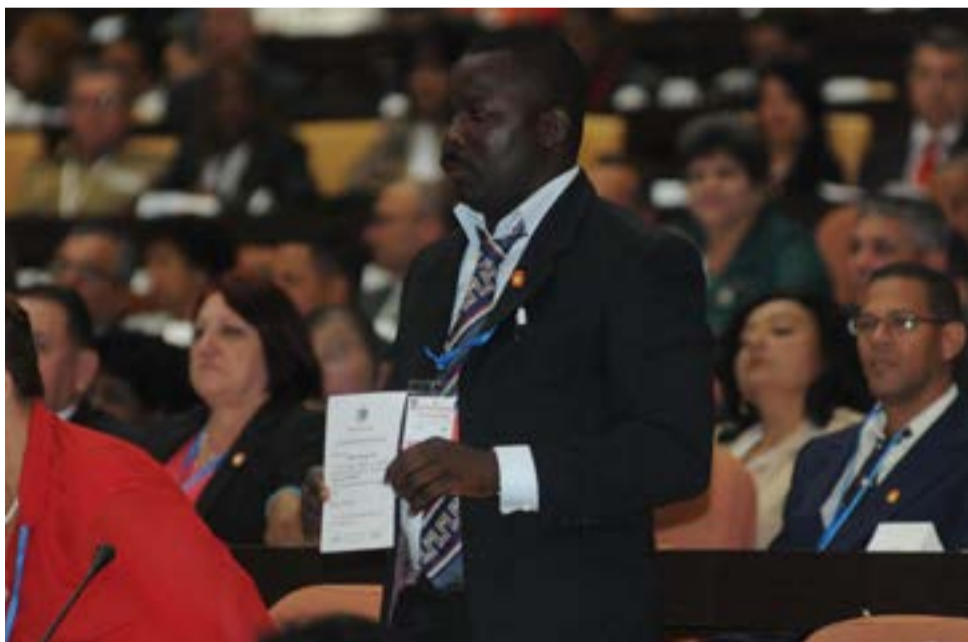
Los integrantes del nuevo parlamento constituyen una muestra representativa de la composición social y demográfica de la actual población cubana.

Todos los diputados fueron finalmente elegidos por la población con más de un 50 por ciento de votos a su favor, en unos comicios a los que concurrieron el 85,6 por ciento de los electores con derecho al voto. 🗳️