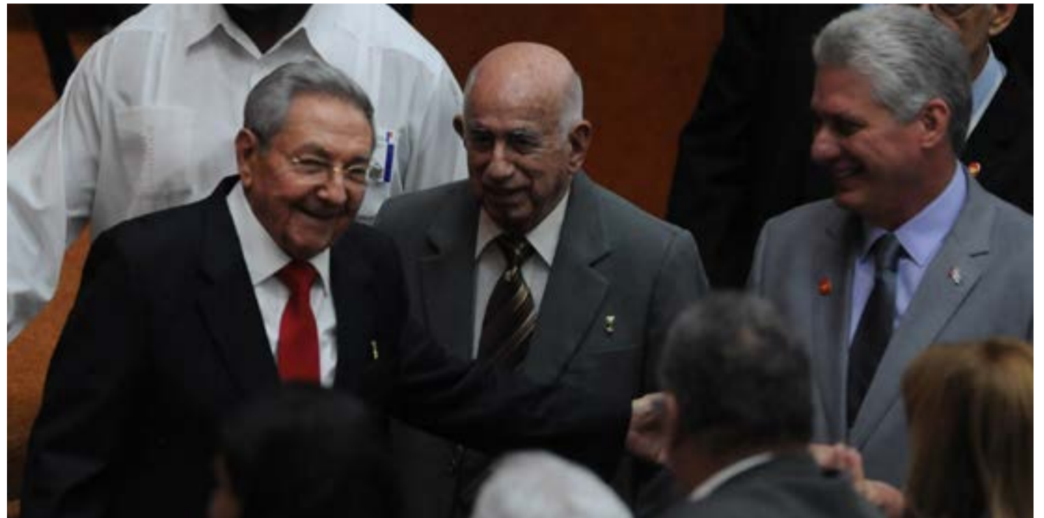
Los diputados Raúl Castro Ruz y José R. Machado Ventura, primer y segundo secretarios del Comité Central del Partido felicitaron al electo presidente de los Consejos de Estado y de Ministros, Miguel Díaz-Canel Bermúdez, junto a ellos en la foto.

“Ratificamos el respaldo a otros pueblos y gobiernos que enfrentan las presiones del imperialismo para revertir las reivindicaciones alcanzadas, como es el caso de Bolivia y Nicaragua”, agregó el líder revolucionario al pronunciar el discurso de clausura de la instalación de la IX Legislatura del Parlamento cubano.