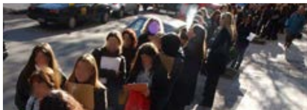
A nivel global la mujer siempre ha sido marginada en cuanto al acceso al trabajo.

Desde la perspectiva de género, también prevalecen notables diferencias en cuanto a la participación en el mercado laboral: en 2018 la tasa mundial de participación femenina es