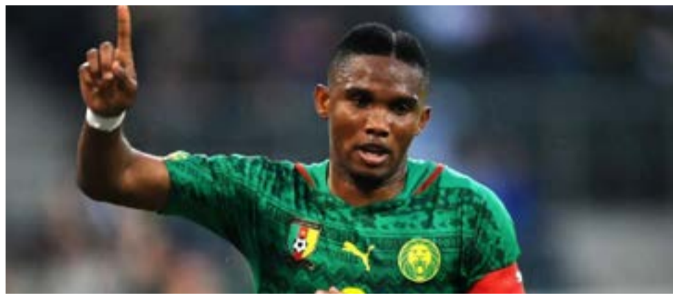
Eto'o juega actualmente en el Konyaspor de la Superliga de Turquía.

Otros lo habían intentado sin éxito, como el ajedrecista Garry Kasparov, quien optó por la presidencia de Rusia, pero la mayoría