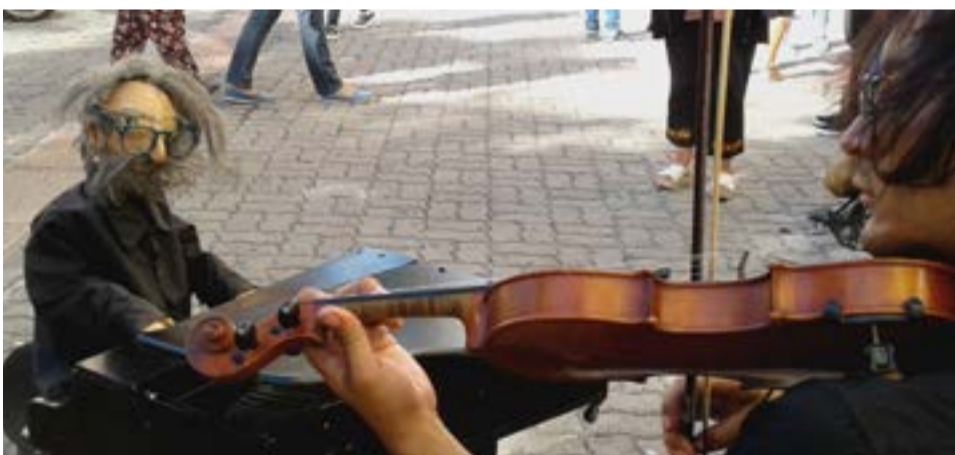
El dúo musical ha visitado varias ciudades de Sudamérica.

Al referirse a las personas que se agolpan alrededor de él y Sherlock, enfatizó que la interpretación de la marioneta tiene mucho realismo y hay "gente que se confunde y piensa que el muñeco es el que toca de verdad".