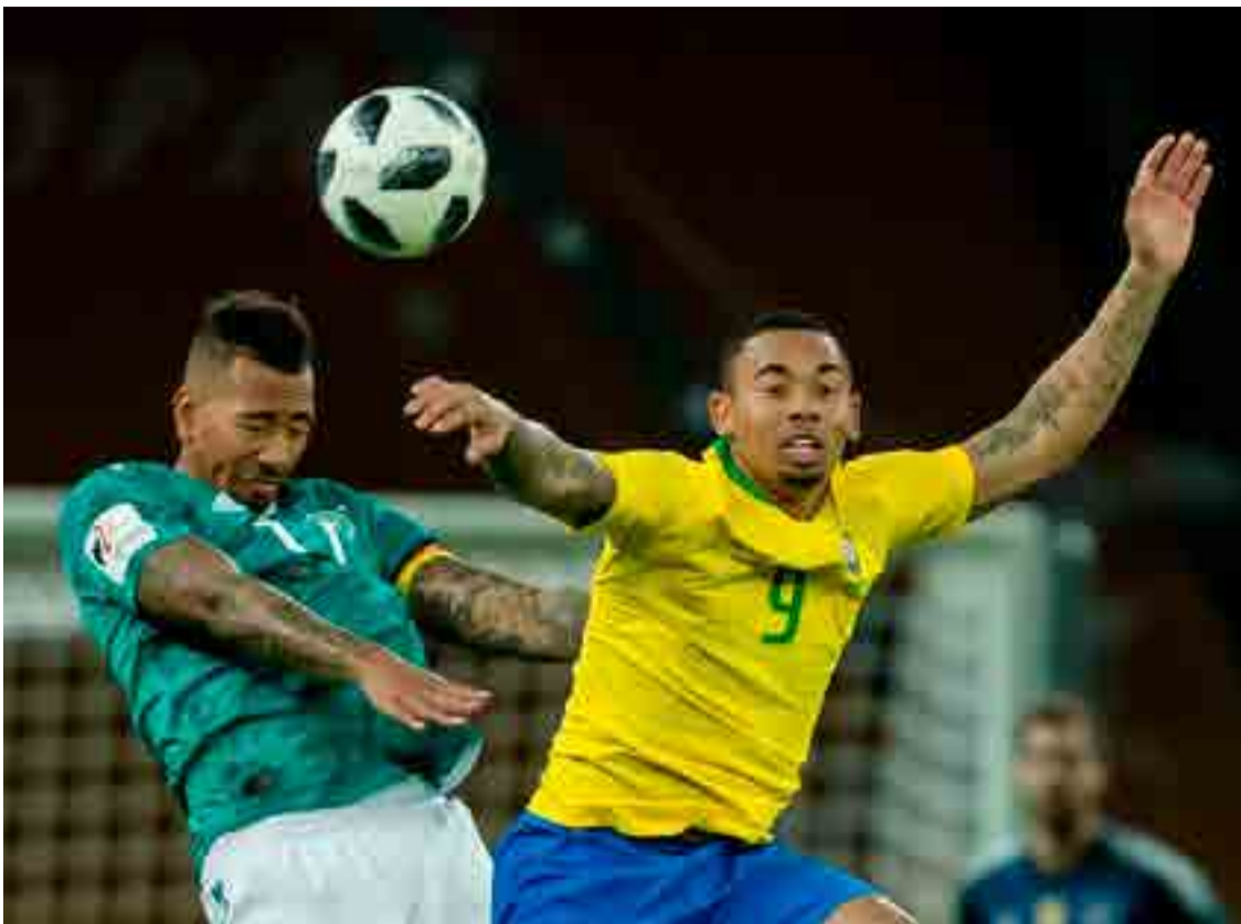
Gabriel Jesús (derecha) refrendó la revancha de Brasil con Alemania.