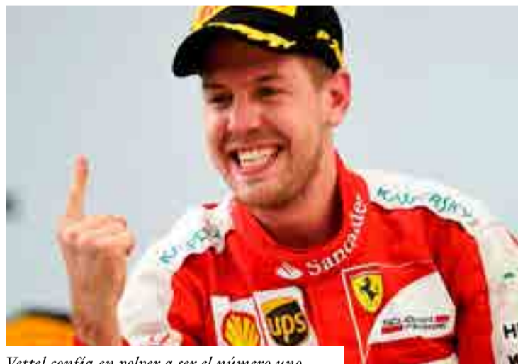
Vettel confía en volver a ser el número uno.

Pero lo más importante de esta primera victoria en 2018 va más allá. Mercedes sufrió un golpe psicológico y moral, y Ferrari mostró