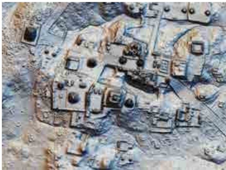
La tecnología Lidar brinda una imagen tridimensional de ruinas ocultas.

Otro asombro fue encontrar extensas defensas y fortificaciones que respaldan la teoría de que los mayas participaban en guerras a gran escala, un factor determinante hasta el punto de configurar el surgimiento y desarrollo de algunas de sus ciudades más grandiosas.