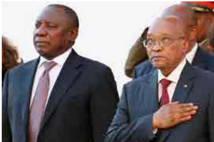
Cyril Ramaphosa (a la izquierda) y Jacob Zuma.

Zuma niega las acusaciones en su contra y subrayó que los dirigentes del movimiento fundado en 1912 nunca le explicaron el porqué de su democión, aunque las denuncias lo vinculan a la familia de empresarios Gupta, de origen indio, acusada de aprovechar su cercanía con el expresidente para obtener contratos millonarios con empresas estatales e influir incluso en el nombramiento de ministros.