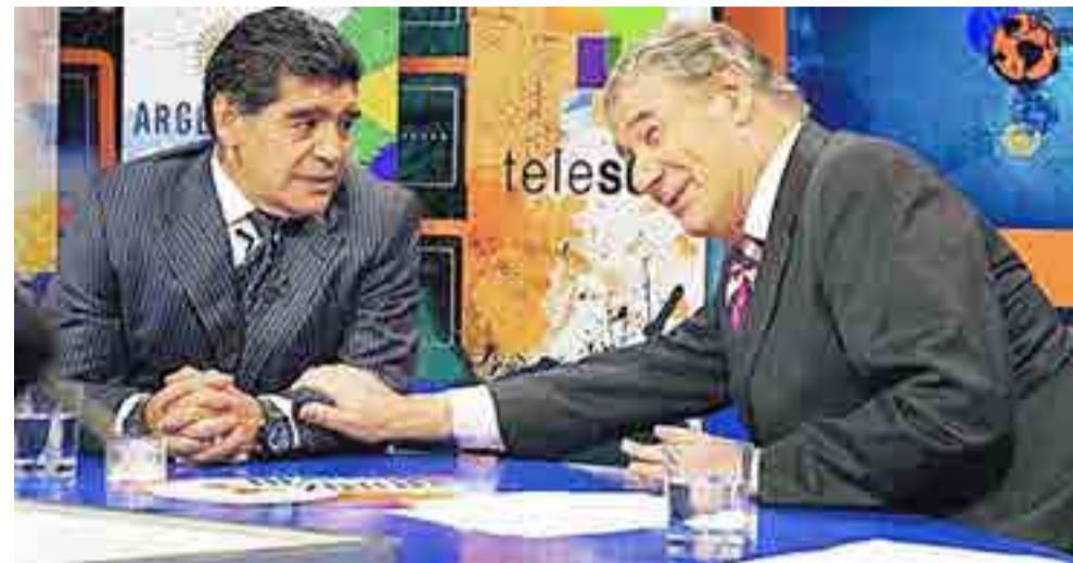
Al célebre relator uruguayo le gustaría realizar otro programa como el De Zurda en Telesur.

Y del lado europeo siempre Alemania y España, después hay que ver. Inglaterra siempre es una promesa. Francia yo lo veo con un campeonato débil pero tienen muy buenos jugadores. Bélgica es un equipo que siempre parece estar en grandes condiciones de pegar el gran salto y después no lo concreta. Y hay equipos a los que vemos muy poco, pero que siempre se pueden convertir en una sorpresa.