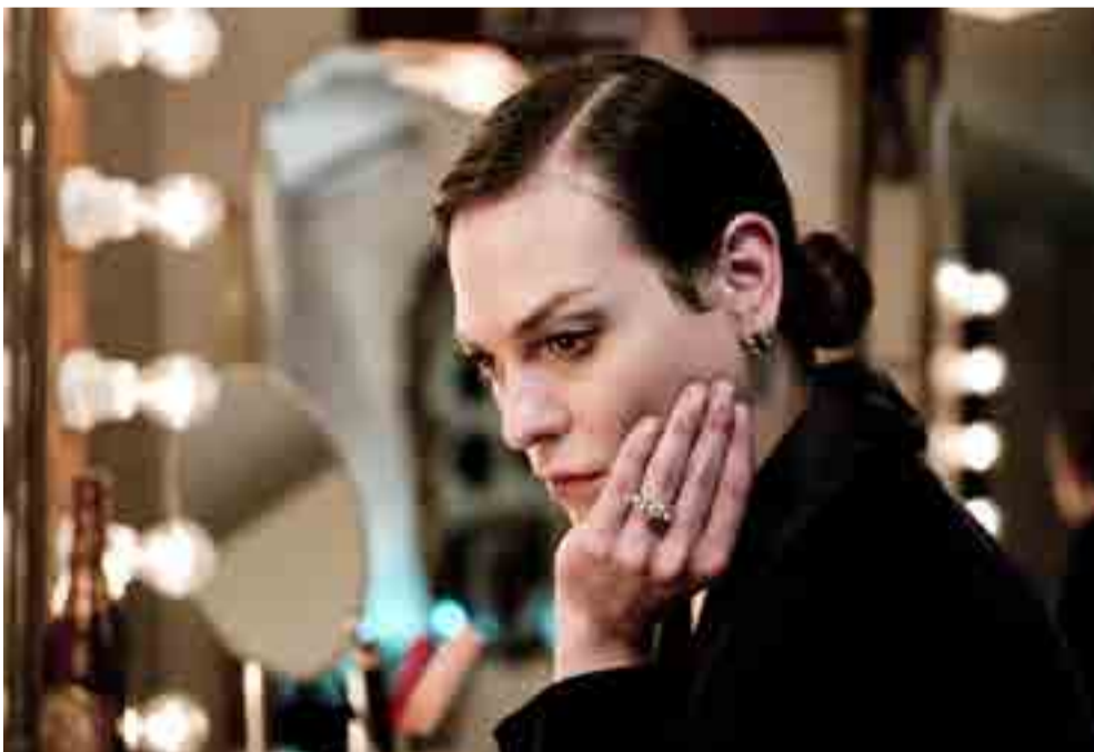
El largometraje de Sebastián Lelio confirma su exitoso recorrido internacional, camino a los Oscar.