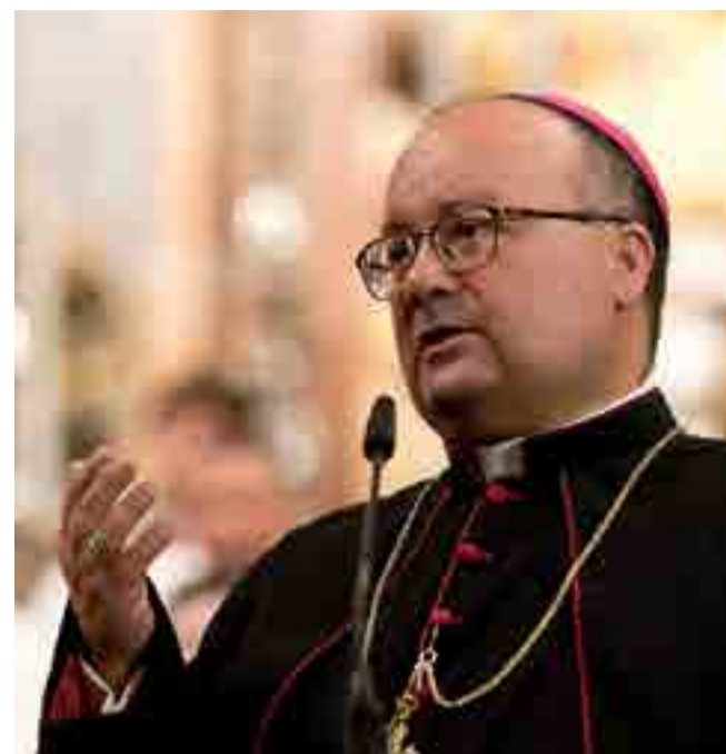
El enviado papal Charles Scicluna.

El asunto de la supuesta complicidad de Barros se convirtió en manzana de la discordia durante la visita del santo padre, quien terminó explícitamente dándole su apoyo y calificó las denuncias en su contra de "calumnias sin prueba alguna".