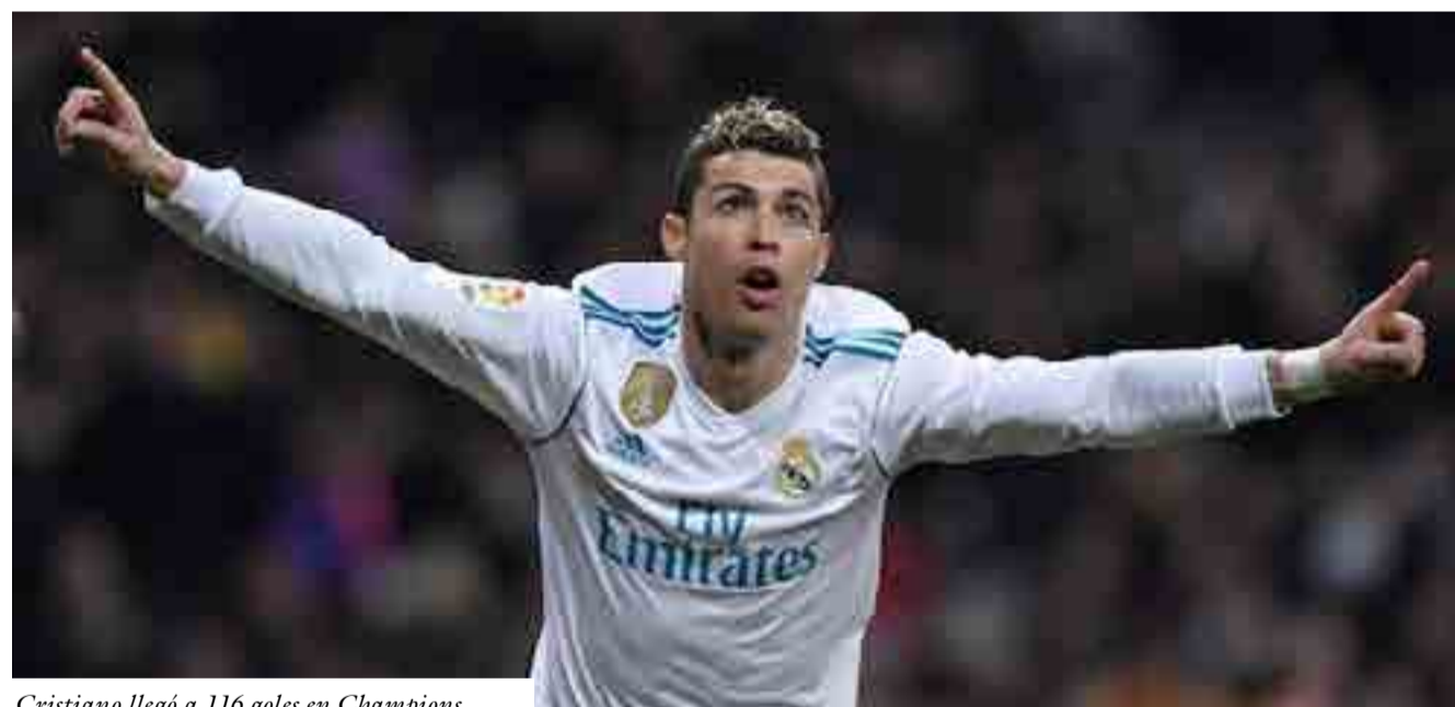
Cristiano llegó a 116 goles en Champions.

Con el triunfo 3-1, el Real Madrid puso pie y medio en los cuartos de final de la Champions y avivó sus aspiraciones de conquistar el título del torneo por tercera temporada consecutiva, algo insólito.