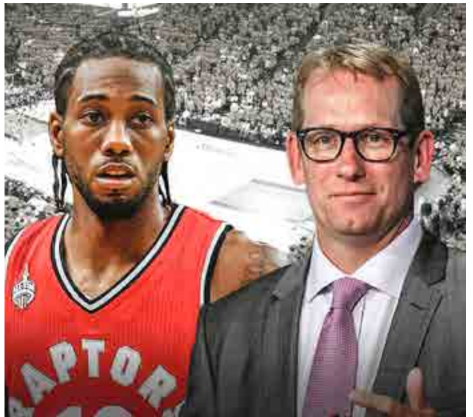
Kawhi Leonard y Nick Nurse, el tándem de Toronto en la NBA.

Modric podrá contarles a sus nietos que se llevó el Balón de Oro cuando Messi y CR7, los colosos de Rodas del siglo XXI, todavía jugaban al fútbol en plenitud de forma.