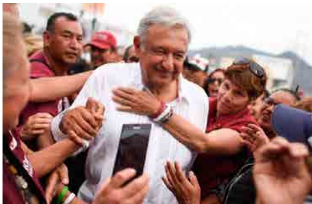
El gobierno de López Obrador tendrá entre sus desafíos resistir las políticas injerencistas de Washington.

*Docente e investigador del Instituto de Estudios Latinoamericanos de la Universidad Nacional de Costa Rica. Tomado del portal FIRMAS Selectas de Prensa Latina www.firmas.prensa-latina.cu . Usted puede encontrar en ese sitio más artículos de este y otros destacados intelectuales.