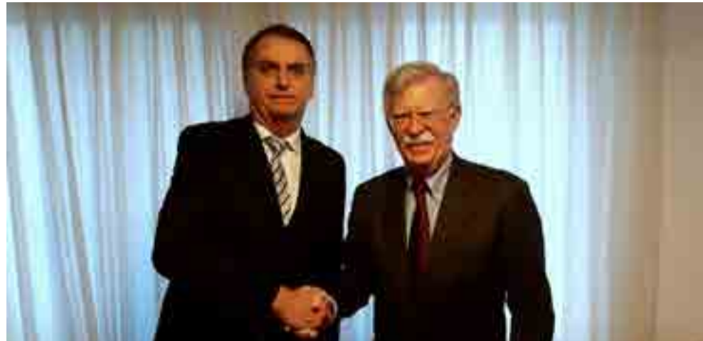
John Bolton (a la derecha) se reunió con Jair Bolsonaro y dijo que Estados Unidos espera una asociación "activa" con el Gobierno brasileño.

De ambos líderes asumió formalmente su nuevo cargo AMLO, quien rindió juramento como presidente el 1 de diciembre, en una