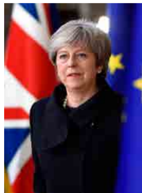
La primera ministra británica agota los últimos recursos para sellar el acuerdo del Brexit.

Si, contrario a los pronósticos, el documento de May es aceptado, se continuaría con el calendario establecido, que incluye