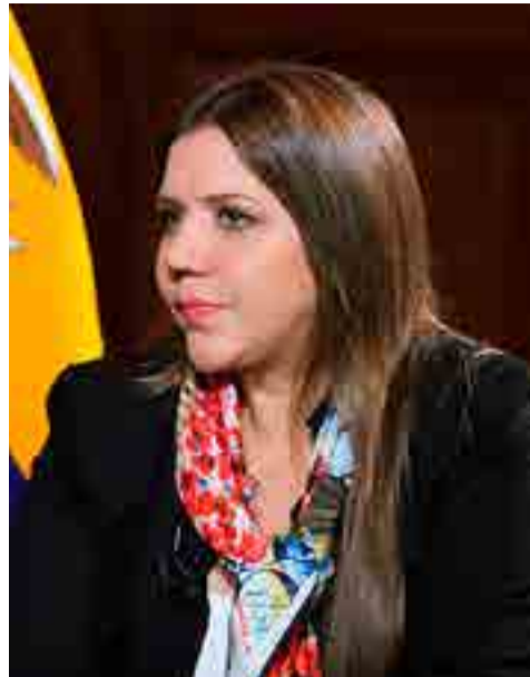
La vicepresidenta María Alejandra Vicuña enfrenta cargos de corrupción.

De ella ya se apartó el presidente Lenín Moreno, desde el momento en que decidió liberarla para que pueda "ejercer, sin interferencias de ningún tipo, su legítimo dere-