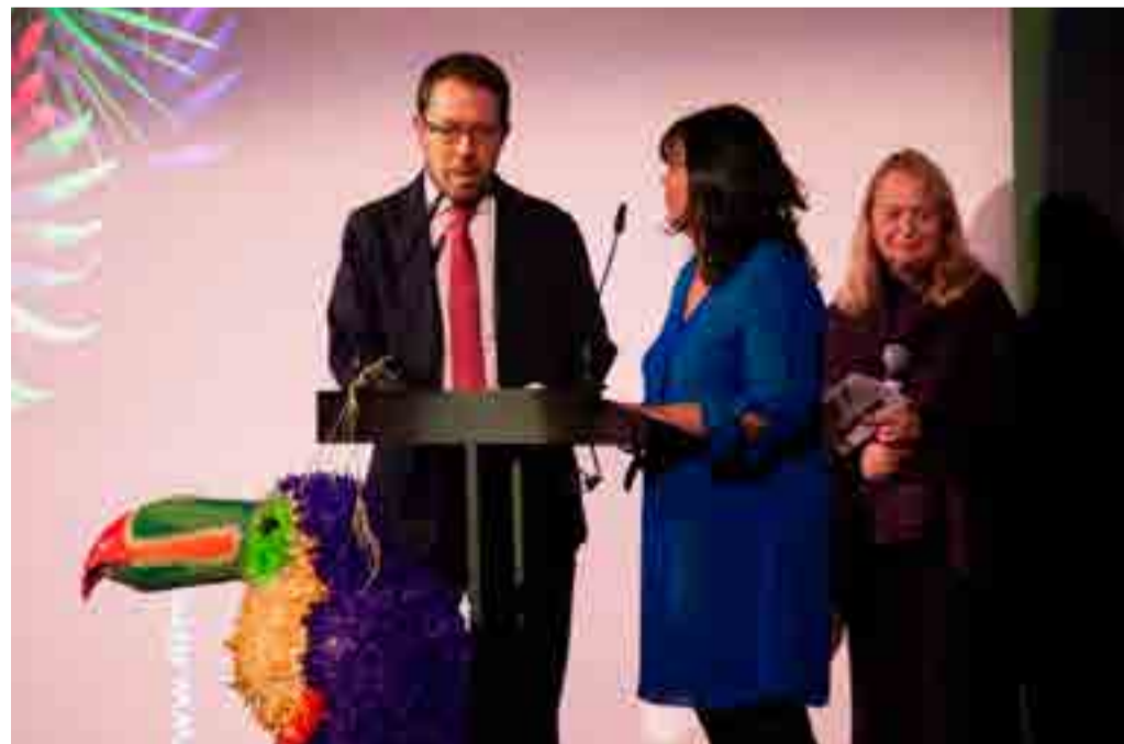
El realizador paraguayo Marcelo Martinessi, director del filme Las herederas , participó en el festival FILMAR 2018, de Suiza.

A pesar de ello, existe una generación ávida de contar historias y un país fascinado en mirarse a sí mismo, a través de su propio espejo, mostrado por una cámara. Y un Martinessi para quien su nación no solo es un escenario más, sino una necesidad esencial de su obra.