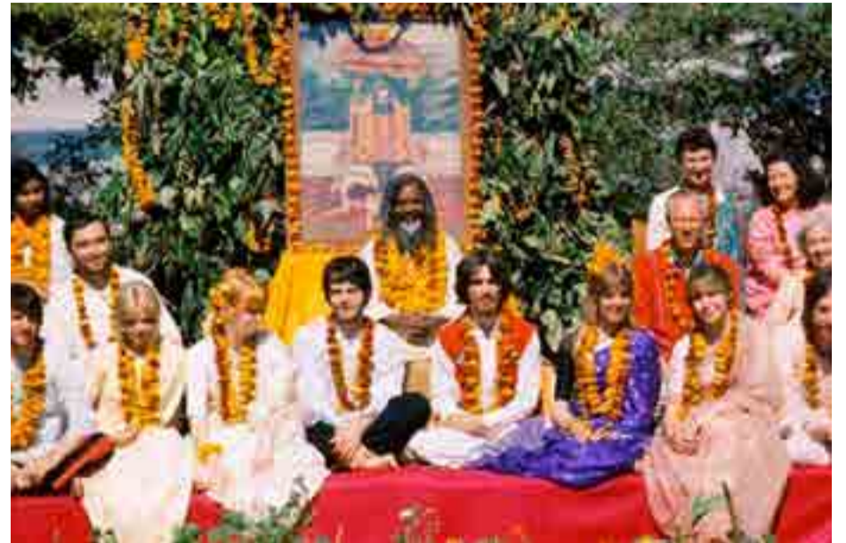
Los miembros de la banda británica estuvieron en el país asiático en 1968, acompañados del gurú Maharishi Mahesh Yogi.