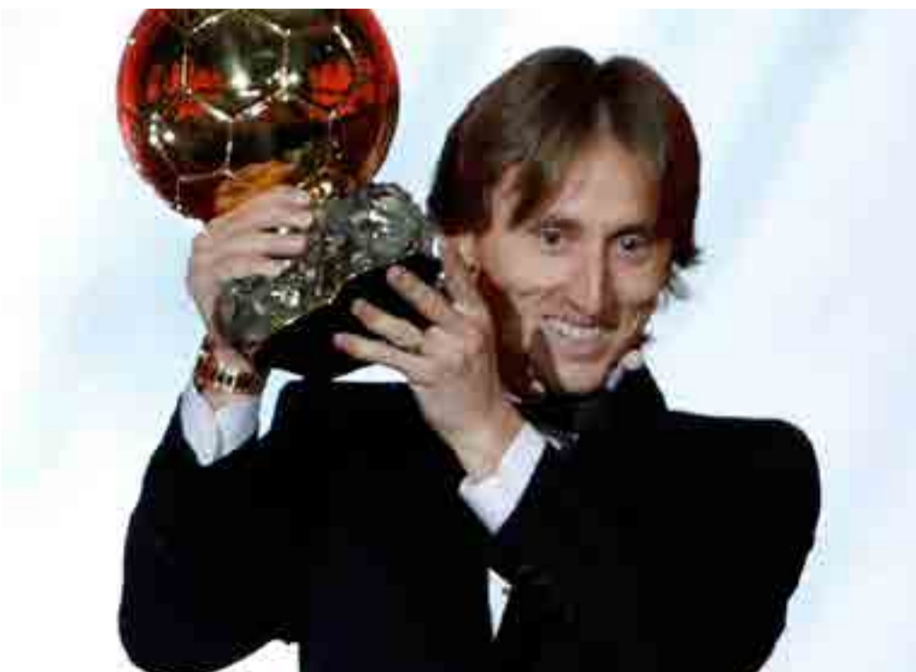
Modric realizó el papel de los centrocampistas en la creación de un fútbol vistoso.

En este mes de diciembre comenzarán las votaciones para el Fin de Semana de las Estrellas, que en febrero de 2019 tendrá por sede a Charlotte, hogar de los Hornets, franquicia cuyo dueño responde al nombre Michael Jordan. De aquí a ese momento, el camino a la postemporada se encontrará más despejado, con algunos equipos fuera ya de la carrera.