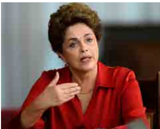
La expresidenta brasileña resaltó la participación cubana en la implementación del programa Más Médicos.

Cuando en Haití hubo problemas por un terremoto y renació el cólera y se registró la epidemia de ébola en otras naciones, nos percatamos que quienes podían tratar de forma sistemática y masiva eran los médicos y médicas cubanos, comentó la exmandataria.