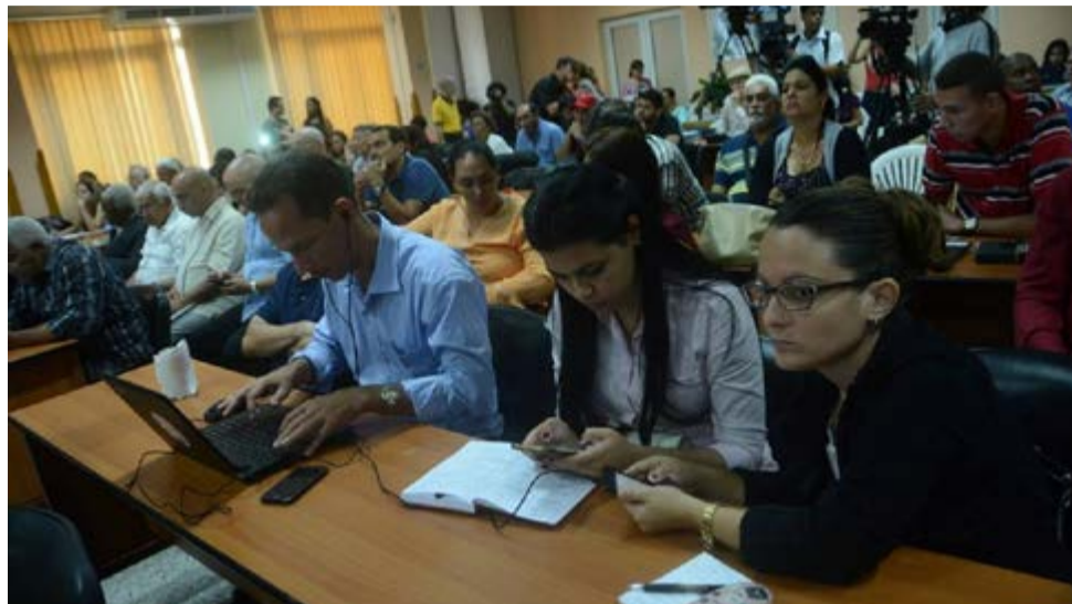
Los participantes en el II Foro repudiaron la pretensión del imperio y sus acólitos de imponer la Doctrina Monroe.