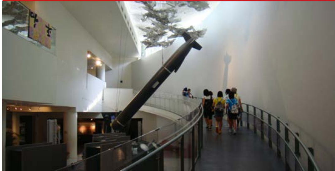
El Museo de la Bomba Atómica, Premio Nobel de la Paz en 2017, despierta un nudo en la garganta.