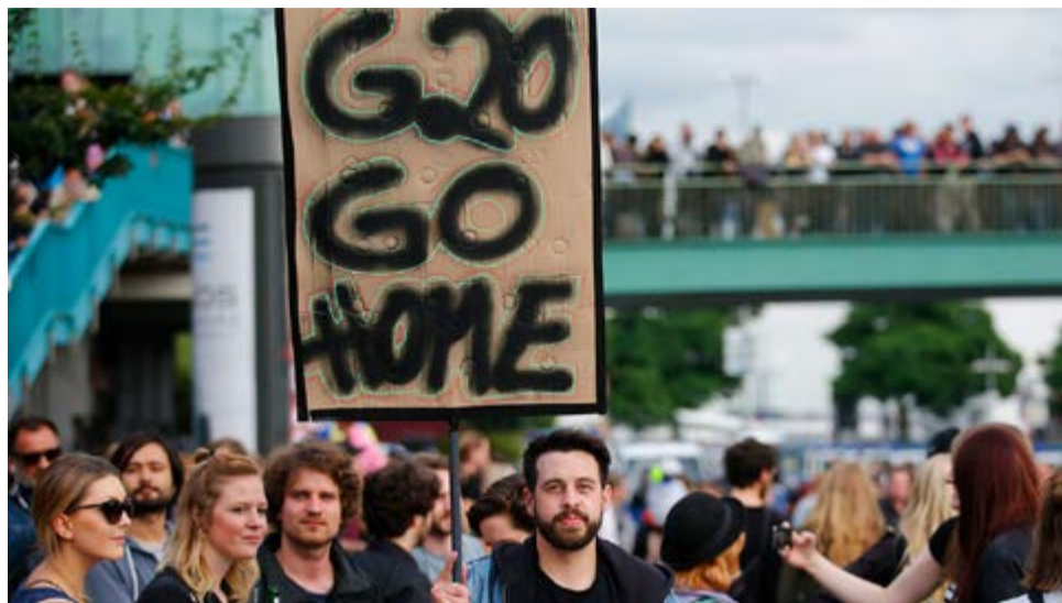
El comunicado invitó a los pueblos del mundo a sumarse a la lucha contra la cumbre en Argentina.

Dicen querer combatir el cambio climático, mientras son los responsables del 82 por ciento de todas las emisiones de CO2 a nivel mundial; que están preocupados por