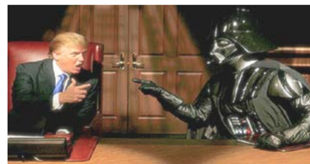
Para garantizar que Estados Unidos "continúe liderando el camino hacia las estrellas", consideró Trump.