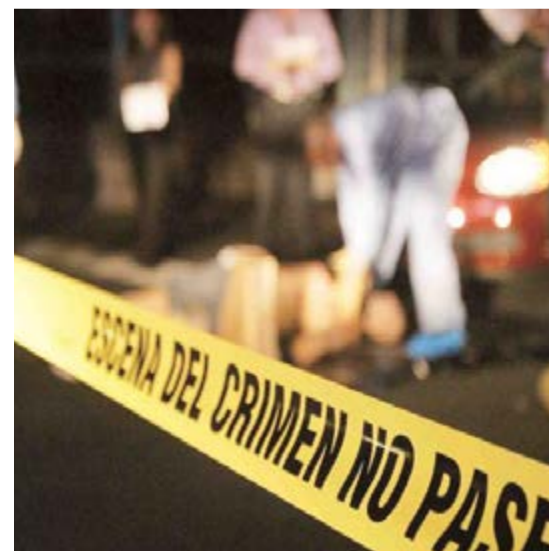
Respecto al primer bimestre de 2017, el promedio de asesinatos creció 17,7 puntos porcentuales.

Además, en enero y febrero las autoridades registraron 125 feminicidios (dos por día), 1 940 víctimas de violación y otras 2 583 que reportaron abuso y acoso sexual. Así lo indican datos actualizados del Secretariado Ejecutivo del Sistema Nacional de Seguridad Pública, dependiente de la Secretaría de Gobernación. (PL)