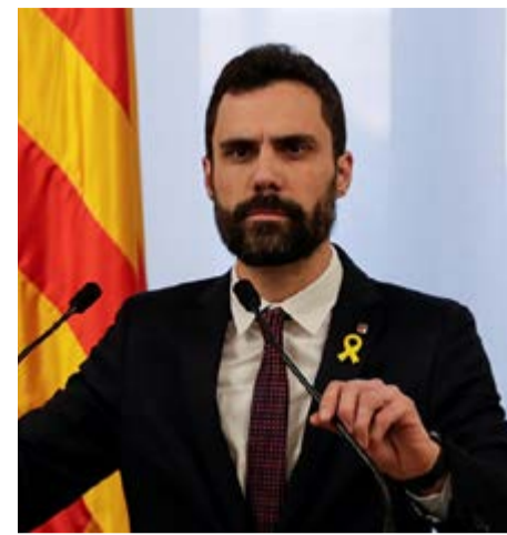
Torrent instó a la conformación de un frente común, ante la represión del Estado español.

En recientes declaraciones el líder del Parlamento de Cataluña, Roger Torrent, instó a la conformación de un frente común para salvar la democracia, ante lo que calificó de represión del Estado español contra los derechos y libertades ciudadanas. Torrent anunció que trabajará de inmediato con partidos, sindicatos y organizaciones relevantes de la sociedad civil para articular una respuesta conjunta y unitaria a la grave situación en la comunidad autónoma. "La hora es grave, la excepcionalidad es evidente", advirtió el dirigente en un mensaje retransmitido por la televisión pública de esa autonomía, el mismo día en que el expresidente