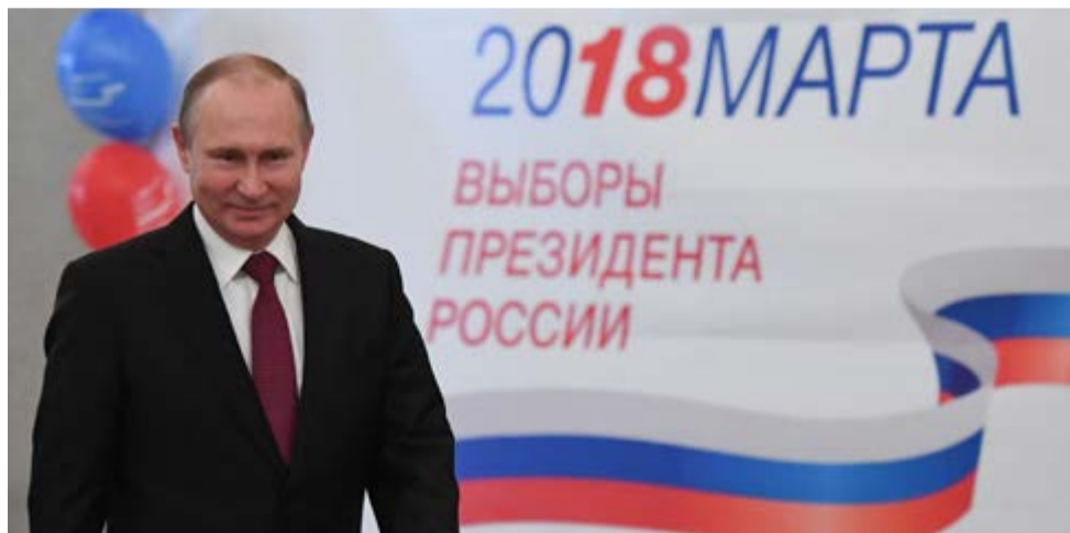
Tras su triunfo Putin exhortó a trabajar juntos por la prosperidad del país, lo que concretó al reunirse con los demás candidatos.