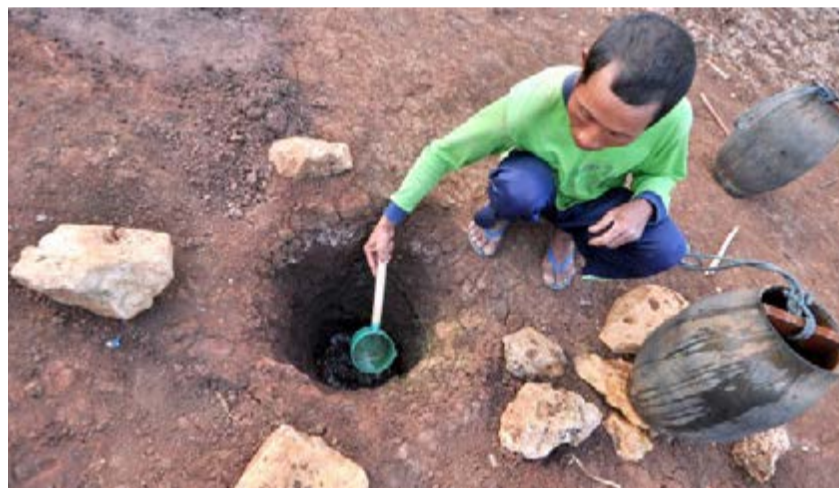
Un 40 por ciento de la población mundial se ve afectada por la escasez de agua.

El 80 por ciento de las aguas residuales se vierten sin tratamiento al medio ambiente y los desastres relacionados representan el 90 por ciento de los eventos naturales más devastadores desde 1990, destaca el panel. También proponen un nuevo enfoque para catalizar el cambio y