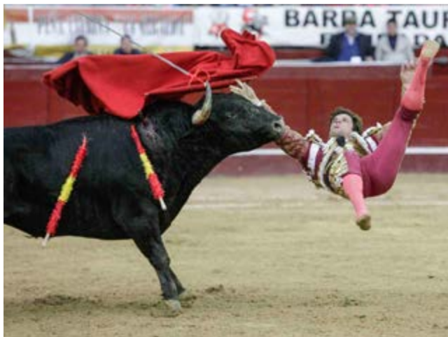
Los toros dividen a los colombianos en arte y tradición cultural para unos, violencia y crueldad para otros.

La lidia de toros nació en España en el siglo XII y se practica también en Portugal, Francia, México, Colombia, Perú, Venezuela, Ecuador y Costa Rica, y es igualmente un espectáculo de exhibición en China, Filipinas y Estados Unidos.