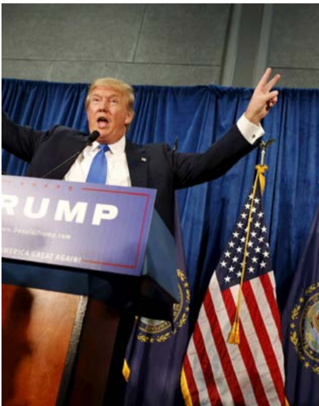
Trump, que posa como un experimentado administrador de la iniciativa privada, se presenta como salvador de la patria.

La despolitización de la política es una artimaña para impedirle a la población tener conciencia de clase y asumir su protagonismo histórico. Gracias a los sofisticados recursos del marketing, ya no se discuten programas de gobierno, sino la imagen mesiánica de un avatar que,