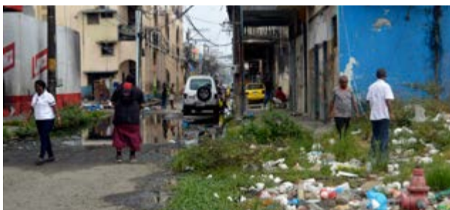
Entre aguas albañales, calles rotas y edificaciones carcomidas, transcurre la vida en la antaño “Tacita de Oro del Caribe”.

En un reciente artículo, el académico aseveró que en la zona de tránsito (hoy el eje Panamá-Colón, antes Panamá-Portobelo) se concentra la mayor parte de la riqueza, dejando casi en el olvido al resto del estado nacional, pues el 80 por ciento del Producto Interno Bruto proviene del comercio, servicios financieros y transporte, “cuyo resultado social es una de las peores polarizaciones de la riqueza”. Beluche recordó que el “transitismo” no proviene ni está dirigido a la población local, que por su baja