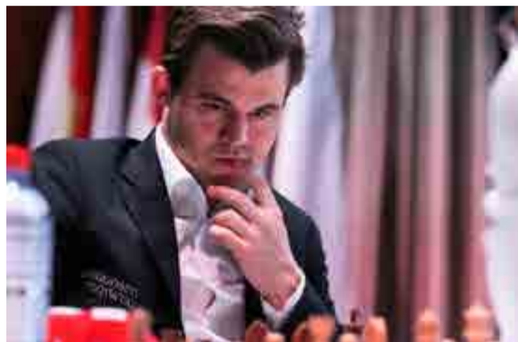
El Gran Maestro noruego es conocido como el Mozart del ajedrez.

En la partida más esperada del certamen, donde se decidía el ganador, pactó tablas en unos rápidos 20 movimientos con el chino Ding Liren (5,5), quien dejó a todos con las ganas de una batalla más reñida, y a la postre quedó en la segunda plaza.