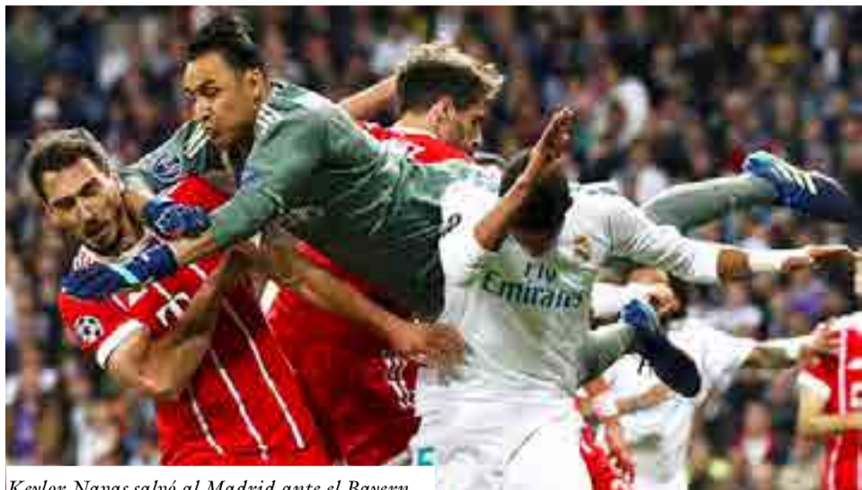
Keylor Navas salvó al Madrid ante el Bayern.