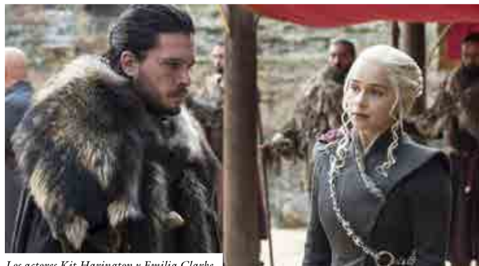
Los actores Kit Harington y Emilia Clarke

Hace unas semanas, la noticia corrió como pólvora en las redes sociales: luego de 55 noches consecutivas, 11 semanas y tres locaciones, el equipo de realización