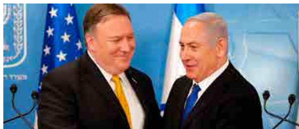
El secretario norteamericano de Estado, Mike Pompeo y el primer ministro israelí, Benjamin Netanyahu renovaron la retórica hostil hacia la nación persa.

No obstante, teniendo en cuenta cómo en tiempos recientes Washington y Tel Aviv han actuado impunemente contra el derecho internacional, tergiversando o ignorando los hechos con el apoyo de los grandes medios de comunicación, es de temer que las maniobras israelíes contra Irán abran las puertas a un conflicto regional de alcance imprevisible.