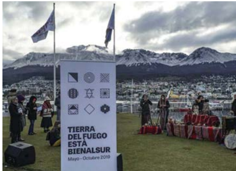
La cita de las artes escogió al punto más austral de la geografía argentina para desplegar su magia.