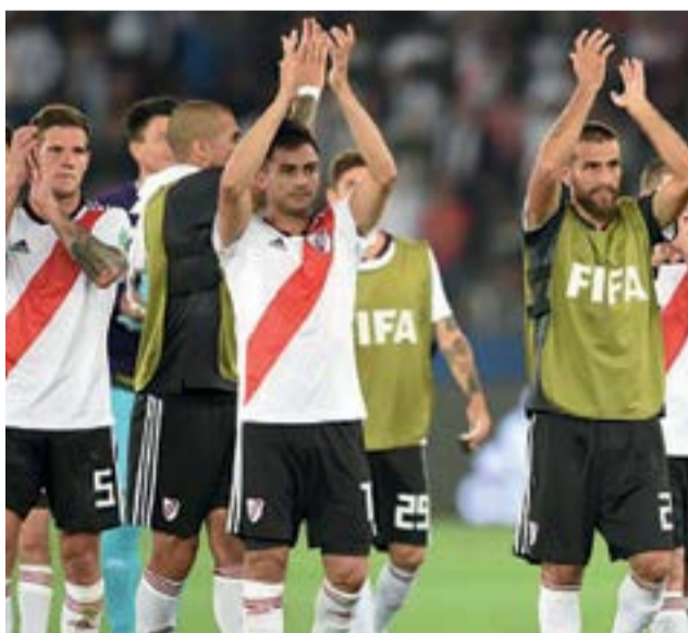
El argentino River Plate busca llevarse a casa su quinta corona.

El 11 del barrio Núñez, de Buenos Aires, conoce muy bien la talla de fútbol que calza su adversario. Un viejo rival con el que archiva nueve derrotas y solo cuatro victorias y con el que perdió la final de la Libertadores de 1976 y la Supercopa de 1991, entre otros cruces. Sin embargo, seguidores