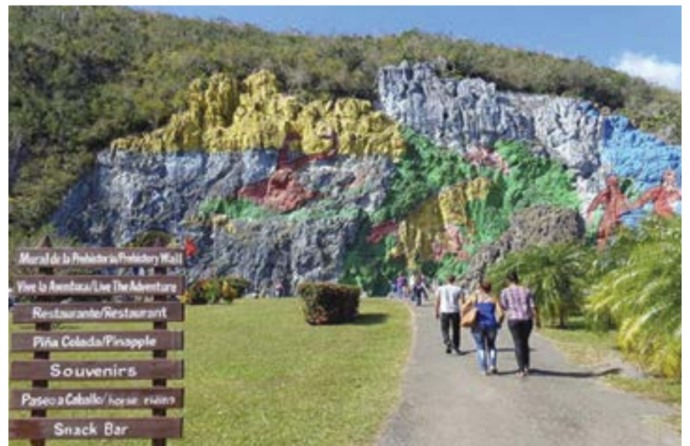
Los encantos del Mural de la Prehistoria, en la más occidental provincia cubana.