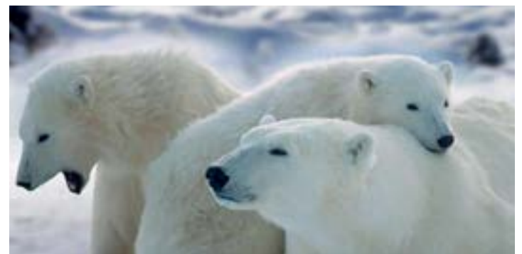
Más de 500 000 especies terrestres disponen hoy de un hábitat insuficiente para su supervivencia a largo plazo.

Los especialistas señalan que este es el documento más exhaustivo sobre el tema realizado hasta ahora, resultado de tres años de trabajo de 145 expertos provenientes de 50 países.