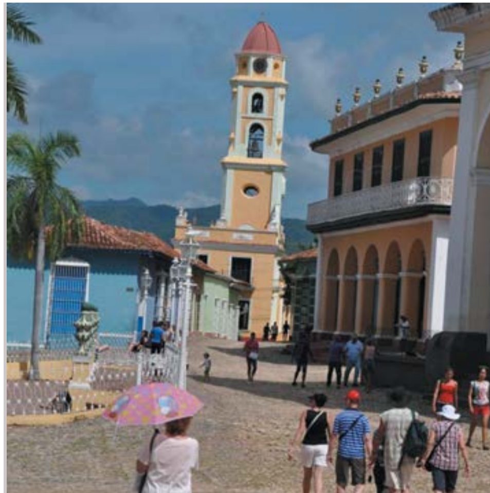
Las ciudades coloniales cubanas también son de la preferencia de los visitantes extranjeros.

También como significativo ocurrió un taller para los representantes de las 19 cadenas hoteleras extranjeras que operan en Cuba, y