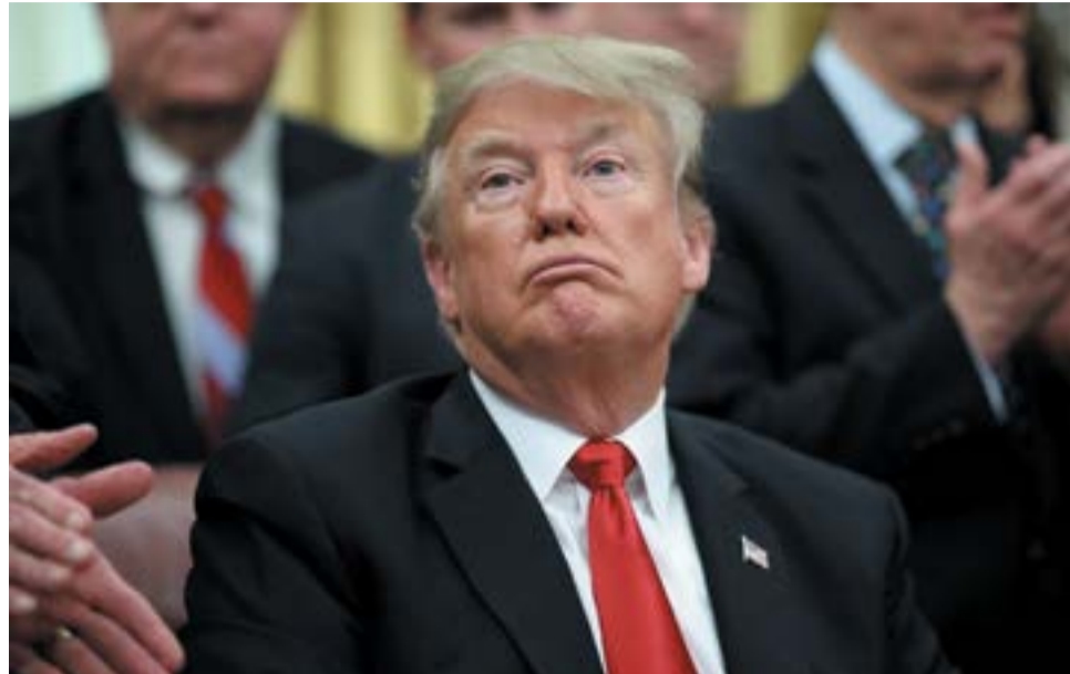
El gobierno de Trump ha desprestigiado la política exterior norteamericana como ningún otro gobierno anterior.

Luego, en 2018, llevó el conflicto entre Corea del Norte y Corea del Sur al borde casi de una conflagración nuclear. Ese mismo año declaró la guerra comercial a China al imponer,