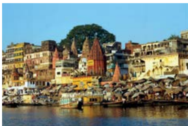
India, como el resto de países en desarrollo, abogan por un comercio que rebase el proteccionismo preferente de las países más fuertes hacia sus empresas exportadoras.

Ministros y altos funcionarios de Egipto, Barbados, República Centroafricana, Nigeria, Jamaica, Arabia Saudita, Malasia, Bangladesh, China, Benin, Chad, India, Indonesia, Malawi, Sudáfrica, Uganda y Omán se proponen explorar maneras de trabajar en conjunto en aras de fortalecer el sistema multilateral