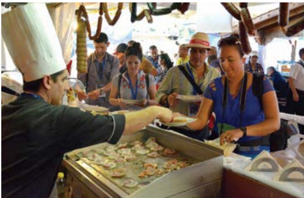
La culinaria criolla no escapa a los atractivos de los visitantes.

Existe un fuerte proceso de inversión con la meta de este año 13 nuevos hoteles solo en La Habana, ciudad que acogió en 2 018 a dos millones 850 000 extranjeros, y tiene en la actualidad 12 458 habitaciones, cuyo 51 por ciento se corresponde con establecimientos de cuatro y cinco estrellas.