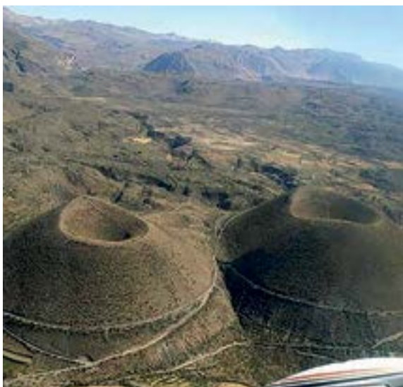
El de Perú, ubicado en los Andes meridionales, es el tercero del continente incluido en la lista de la Unesco.

El número de sitios en la Red Mundial de Geoparques, que se eleva a 147 en 41 países, se engrosa este año con la incorporación de Kütralkura, en Chile, que en el idioma de los mapuches significa Piedra de Fuego.