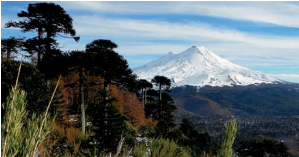
El Geoparque Kütralkura, en Chile, está situado a unos 700 kilómetros al sur de Santiago y se extiende por el este hasta la frontera con Argentina.