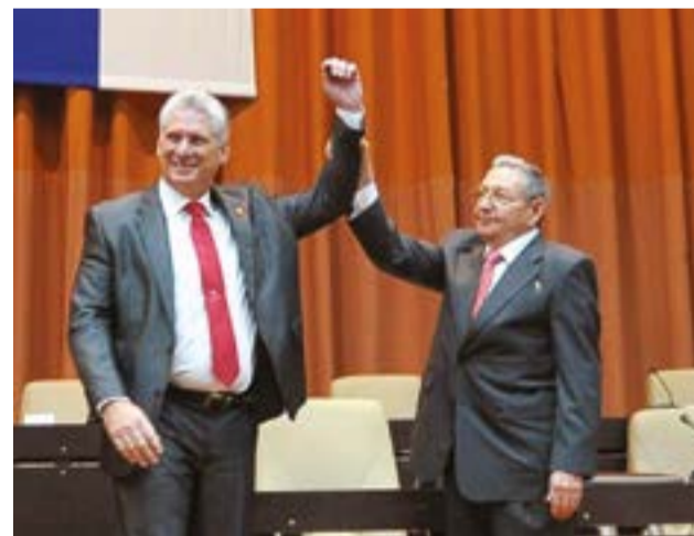
Las nuevas generaciones, encabezadas por Miguel Díaz Canel, llevan con orgullo el batón de los que durante 60 décadas crearon y defendieron la nueva Cuba.

“En esa escuela nos inspiramos hoy para promover el análisis integral y crítico de lo que anda mal o no anda, para quebrar el bloqueo interno y para pedirles a todos una actitud proactiva, inteligente, comprometida y colectiva...”