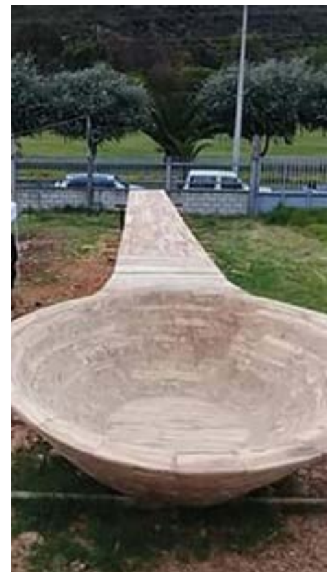
Para su confección se necesitaron 150 tablones de 30 árboles de sauce.

Ecuador también inscribió en el libro de los Guinness otro récord, al confeccionar el arreglo floral más grande del mundo en julio del 2018, hecho con 546 364 rosas, en el cantón Pedro Moncayo, con la forma de una de las pirámides del complejo arqueológico de Cochasquí, en la provincia de Pichincha. (S.C.)