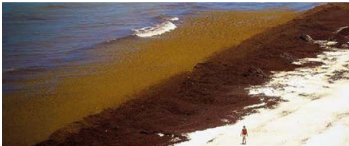
El sargazo es un género de macroalgas planctónicas que se está acumulando desmesuradamente debido a los efectos del cambio climático sobre el ecosistema y las corrientes en el Océano Atlántico.