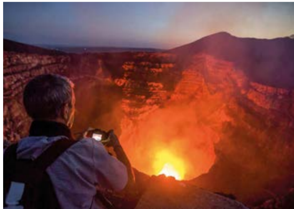
El volcán Masaya es un regalo visual que los turistas no quieren dejar de llevarse en el recuerdo cuando visitan Nicaragua.

Una escalera en forma de Z y 200 gradas serpentea sobre la piel mestiza del pequeño