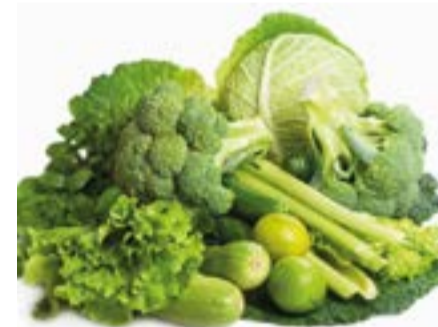
Las verduras son excelentes aliados de la salud y muy especiales al paladar.

Según los expertos, para obtener los efectos protectores que brinda al organismo humano los vegetales de hoja verde, como la espinaca y la rúcula —ricos en nitratos— no son necesarias grandes cantidades, unos 200 gramos diarios pueden ayudar a mantener una buena salud.