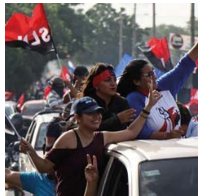
La reedición del Repliegue a Masaya desbordó el entusiasmo popular con la Revolución Sandinista

Y en medio de ese panorama de recuperación tras la dentellada golpista, una oposición sin otro programa que cruzarse al pecho la banda presidencial, muestra sin tapujos sus divisiones internas de cara a unas elecciones generales, que el Gobierno siempre dejó claro serán, tal como lo estipula el mandato constitucional, en noviembre de 2021. 🇳🇮