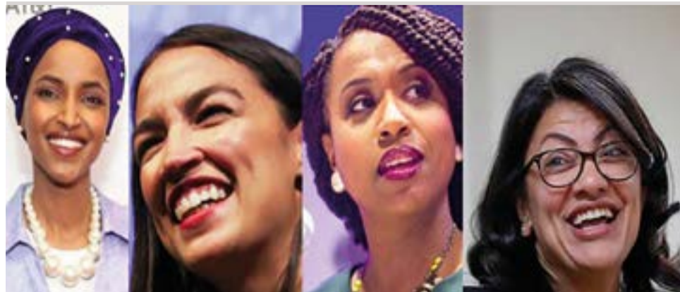
Trump volvió a poner de manifiesto su más profundo lado racista contra las legisladoras (de izquierda a derecha) Ilhan Omar, Alexandria Ocasio-Cortez, Ayanna Pressley y Rashida Tlaib.

Si los demócratas quieren unirse en torno al lenguaje grosero y el odio racista que se desprenden de la boca y las acciones de estas congresistas impopulares y no repre-