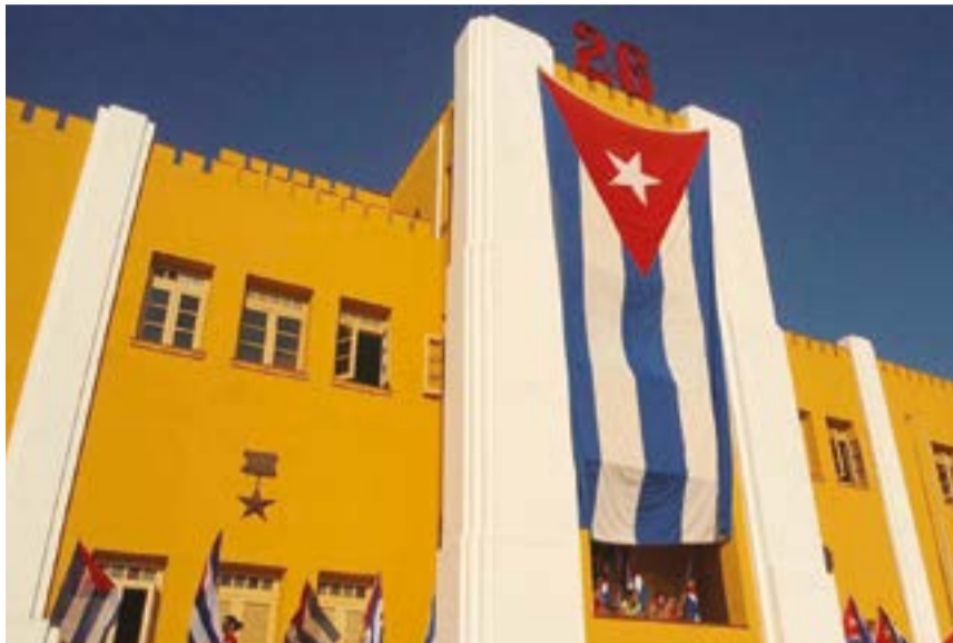
Fachada principal del cuartel Moncada, convertido en ciudad escolar desde 1959

La gran mayoría de los que lograron evadir la cárcel, muchos de ellos gracias a la solidaridad del pueblo de Santiago de Cuba, y otros a los que la tiranía no pudo probarles su participación en los hechos del 26 de julio, posteriormente se incorporaron a las filas de los luchadores clandestinos, dentro de la isla y en el exilio, cumpliendo misiones en apoyo a la Revolución.