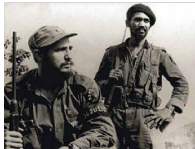
Fidel Castro y Juan Almeida, sobrevivientes de la heroica acción, en los días de la guerra revolucionaria.

“De la generación histórica, de Fidel y de Raúl aprendimos a desechar el lamento inútil y a concentrarnos en buscar salidas, a convertir los desafíos en oportunidades y los reveses en victoria.