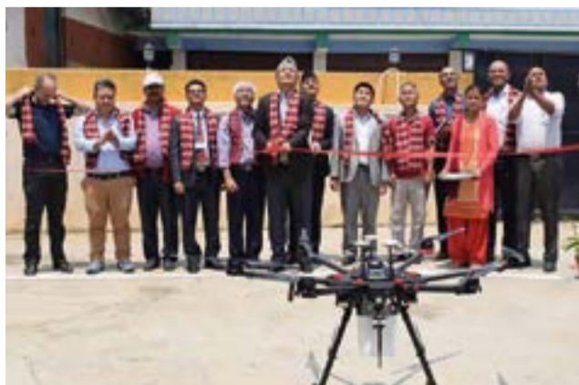
Los novedosos aparatos ayudarán a controlar la enfermedad.