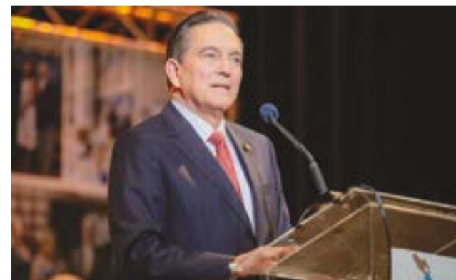
El presidente Laurentino Cortizo anunció que en julio propondrá una serie de reformas al parlamento

Las proyecciones de esta administración se basan en los "pilares": buen gobierno, estado de derecho, ley y orden, economía competitiva que genere empleo, combate a la pobreza y la desigualdad; mientras la educación emerge como su "estrella".