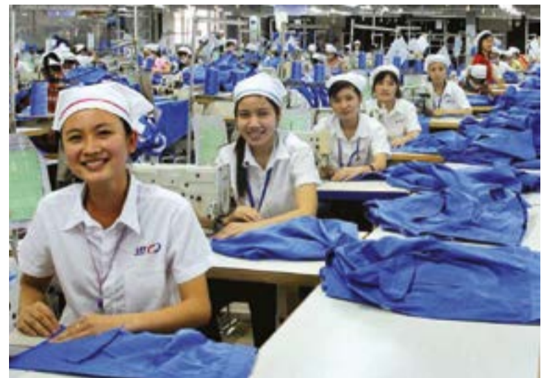
La nación asiática cerró los primeros seis meses de 2019 con menos desempleo, mayores salarios y mejor estructura ocupacional.

La casi plena garantía de empleo, el creciente nivel de los salarios y la