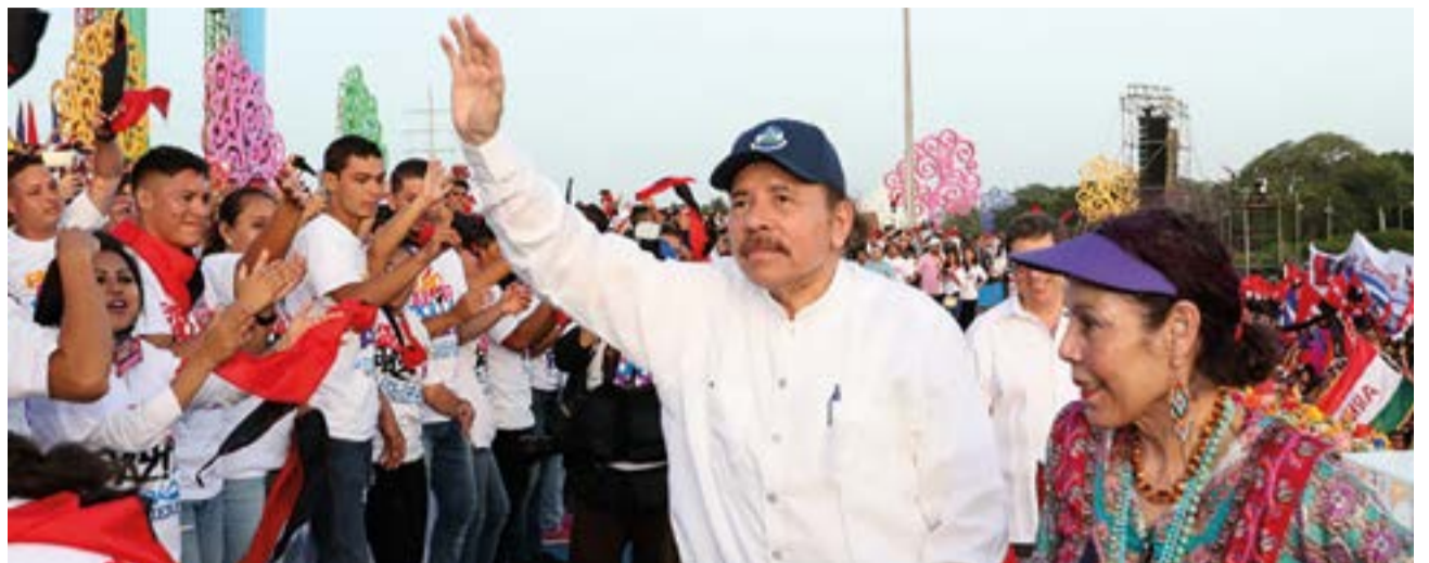
El presidente Daniel Ortega junto a la vicepresidenta Rosario Murillo aclamado por su pueblo