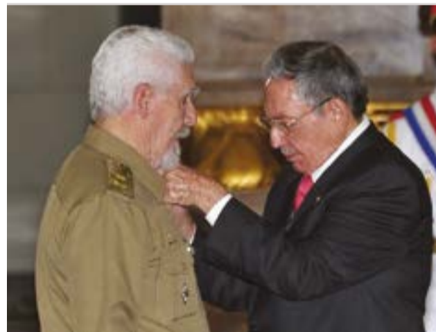
Raúl Castro condecora a Ramiro Valdés, Héroe de la República, ambos participantes de la epopeya del Moncada y de la expedición del Granma.