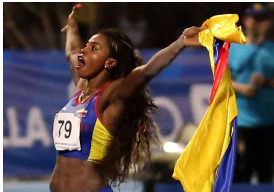
La colombiana es la mujer con más galardones en los sondeos de Prensa Latina.

Entre los logros de la temporada sobresale el impresionante registro de 8.83 metros que, pese a haber sido con viento a favor (+2.1 —es legal hasta +2.0—), mostró al mundo las posibilidades reales de romper el récord mundial de la especialidad de 8.95, en poder del estadounidense Mike Powell