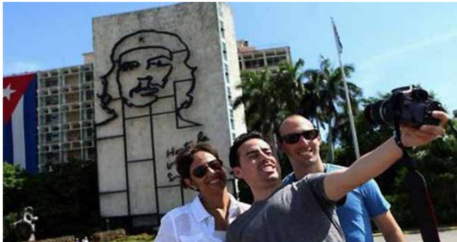
El turismo registró un nuevo récord de visitantes internacionales durante la temporada alta de 2018.

Considerado entre los sectores más dinámicos, el turismo registró un nuevo récord de