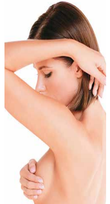
El cáncer es la principal causa de muerte en todo el mundo.

Todavía no sabemos si esta va a ser la panacea para todos los