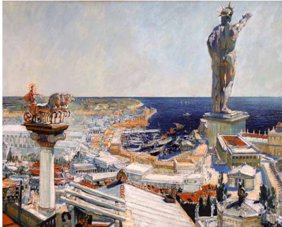
El Coloso de Rodas es una de las siete maravillas del mundo antiguo.

Se trata de una pequeña versión de un suceso histórico en el que, a partir de una situación de guerra, convergieron ingenio, sagacidad e inteligencia de individuos como Cares de Lindos, quien con su Coloso rindió tributo en el siglo III a.n.e. tanto a la belleza como a la fuerza