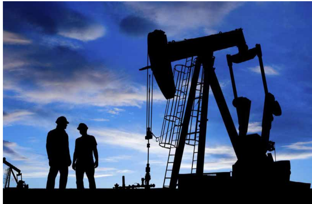
Con este plan el presidente considera que se puede superar la producción de 2,6 millones de barriles de petróleo diarios antes de 2024 cuando concluye su mandato.

Por el momento las licitaciones de los bloques en el Golfo están paralizadas, pues están siendo revisadas por las cuestionables experiencias de los últimos años cuando la intervención de las transnacionales ha ido en aumento y, contraproducentemente,