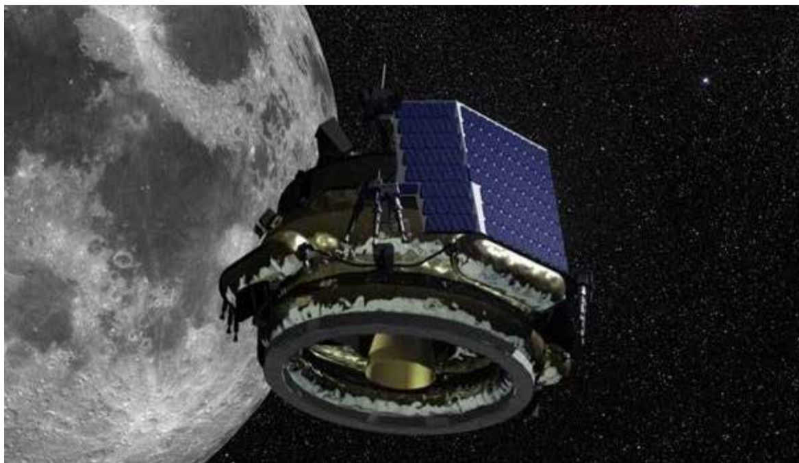
El lander de seis ruedas realizará análisis químicos in situ y los datos serán transmitidos a la Tierra.