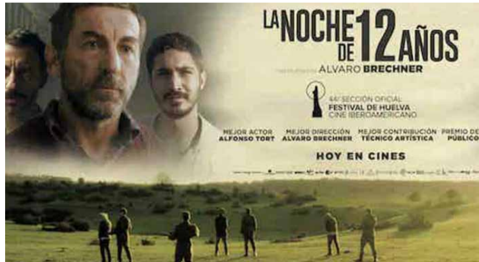
El filme está basado en hechos acaecidos en la Uruguay de la década del 70, sometida a una brutal dictadura.

Bajo la premisa de «como no pudimos matarles, vamos a volverles locos», los cabecillas del régimen los mantuvieron en confinamiento solitario durante más de una