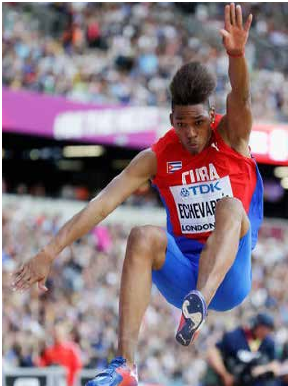
El saltador cubano superó en la encuesta al astro argentino, Lionel Messi.