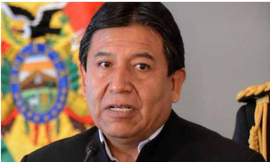
El Secretario General del Alba-Tcp asegura que los seres humanos son integracionistas y quieren hermandad, buscan la paz y la armonía.

«Existen movimientos que buscan recuperar, defender nuestra soberanía, nuestras riquezas naturales para el beneficio de nuestros pueblos, no para las fuerzas extraterritoriales, y con ese objetivo construyen espacios de integración».