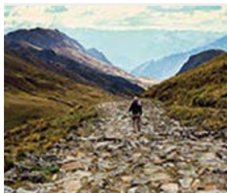
El Qhapaq Ñan es patrimonio cultural de los seis países de la Comunidad Andina.

El Principal Camino Andino o Qhapaq Ñan fue iniciado por el imperio de los incas,