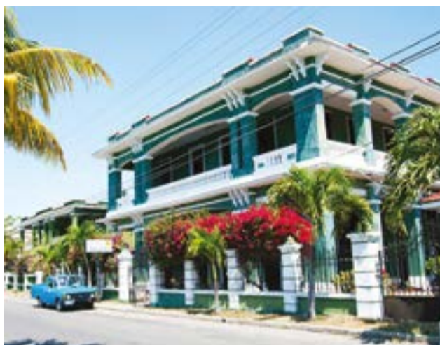
En Cienfuegos, provincia sureña de la isla, prosperan negocios particulares que están siendo afectados por las medidas contra Cuba implantadas por la actual administración estadounidense.

porque el dueño soy yo, y mi familia", dijo recientemente a la prensa.