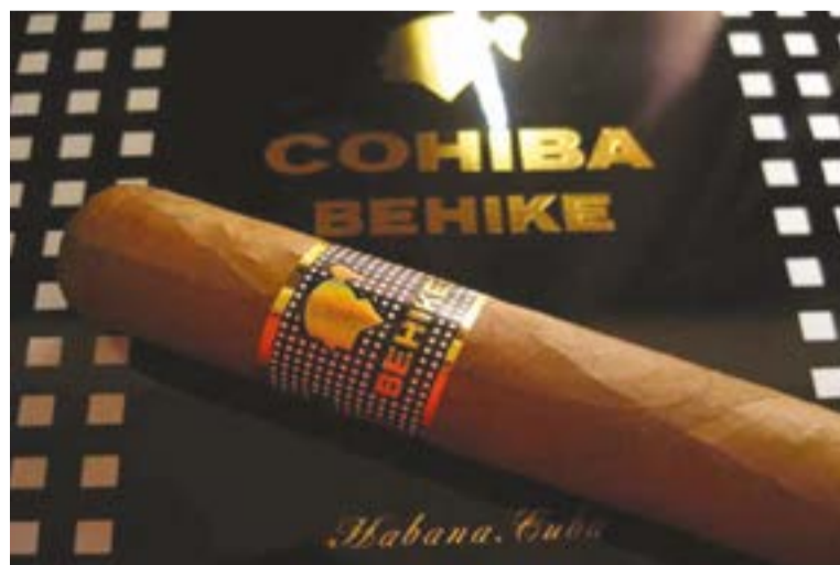
El tabaco cubano goza de un importante prestigio internacional

Los ingresos dejados de recibir por exportación de bienes y servicios en el 2018 superaron 140 millones de dólares, aseguraron sus directivos. 🇺🇸