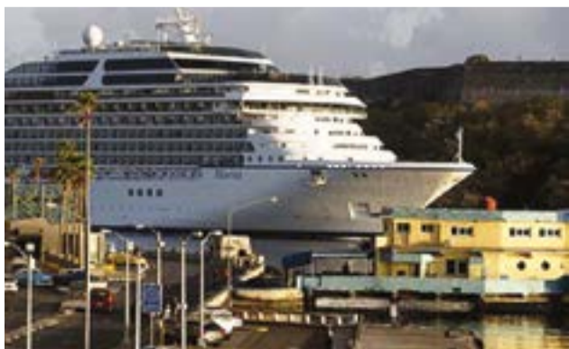
La prohibición de Trump para entradas de cruceros propiedad u operados por ciudadanos estadounidenses infligió un duro golpe a la llegada de visitantes por esa vía.

Desde allí se lanzan voces de condena, según publicó el diario cubano Trabajadores , que recuerda que esa rada fue fundada en 1494 por Cristóbal Colón y bautizada como Puerto de Rey.