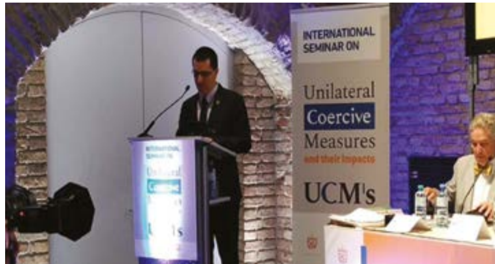
El canciller Jorge Arreaza denunció las represalias económicas contra Venezuela, provenientes del gobierno de Trump.