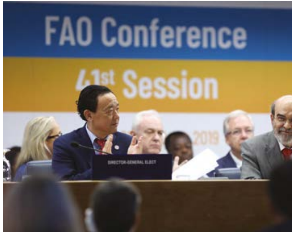
En la presidencia, el nuevo director general de la FAO Qu Dongyu, junto al saliente, Graziano da Silva.

La máxima instancia de la Organización de las Naciones Unidas para la Alimentación y la Agricultura, que logró en esta oportunidad la mayor participación de su historia, más de 1 300 delegados de 196 países, de muchas maneras insistió en el rol de la alimentación y la agricultura para lograr un futuro sostenible.