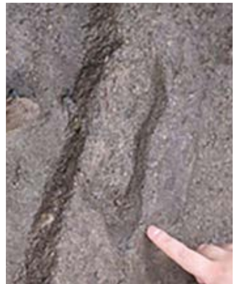
El nuevo descubrimiento correspondería a un ser humano de menor tamaño que podría haber vivido en torno al año 14 000 antes de nuestra era.

Los expertos anunciaron que más adelante medirán la huella y desarrollarán otros estudios para realizar una nueva publicación científica sobre el tema.