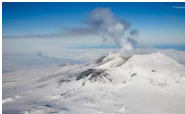
El Monte Erbus es el volcán activo más austral del mundo. 🌱

Sin embargo, hay ciertas muestras que no han sido identificadas, lo que supondría la revelación de nuevas especies de seres vivos.