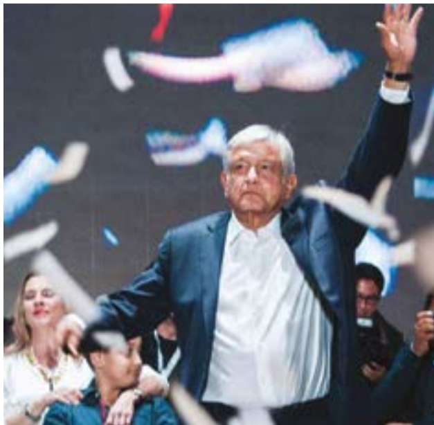
El 1 de julio de 2018 la historia de México cambió con el triunfo electoral de AMLO.

AMLO comenzó su lucha desbrozando el camino, limpiando las malezas con un machete afilado. Empezó por donde nadie se había atrevido hasta ahora hacerlo: la corrupción dentro de