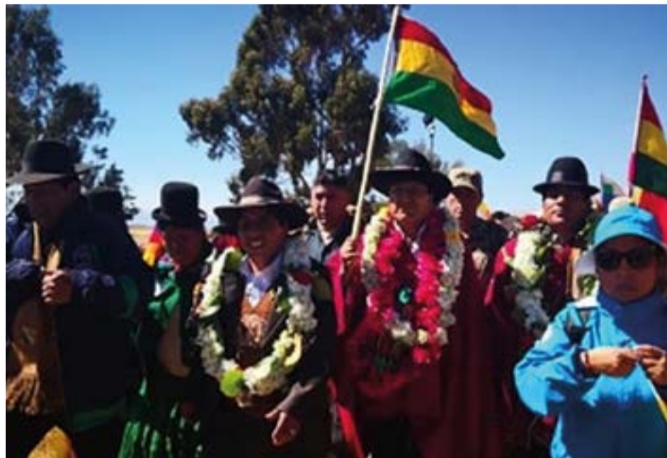
El presidente Evo Morales protagonizó la Primera Caminata Internacional del Qhapaq Ñan.

La caminata, con el presidente Evo Morales en la vanguardia del grupo guía, se constituyó en una suerte de rito de iniciación, a unas horas de que los pueblos de este espléndido país recibieran en la madrugada del 21 de junio el inicio del solsticio de