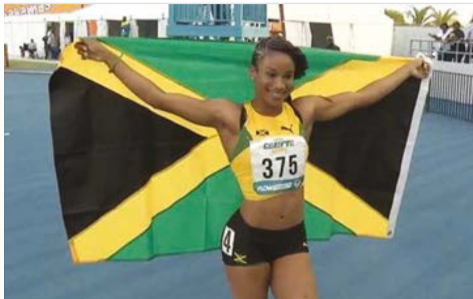
Briana Nichole Williams tiene un palmarés magnífico que le augura un futuro prometedor.

Por si fuera poco, en ese mismo año se convirtió en la chica más joven en ganar los 100 y los 200 metros en el Campeonato Mundial Sub-20 de la IAAF en Tampere, Finlandia, por lo que fue nominada para los