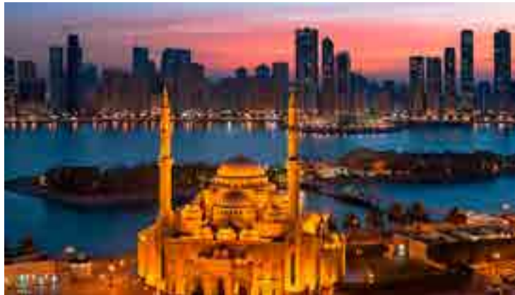
El emirato de Sharjah destaca por sus numerosos museos.

Únicamente le superan en tamaño Abu Dhabi y Dubai, pero Sharjah tiene como valor añadido que es el único con costas en el