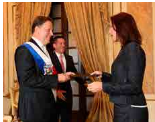
El presidente Juan Carlos Varela recibió a la embajadora designada por un gobierno inexistente.

Este juego dual de la administración pone en entredicho al istmo ante observadores locales e internacionales, que en privado bromean sobre la existencia de dos embajadores del mismo país, al tiempo que confirman así la debilidad de una política exterior subordinada a los vaivenes de una potencia.