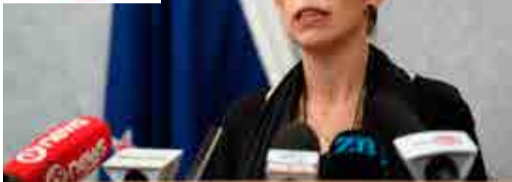
La primera ministra Jacinda Ardern impulsó una legislación sobre el control de armas en el país austral.

Washington salieron a las calles a criticar a los legisladores republicanos por no apoyar una medida contra el fin de la violencia armada previamente aprobada en la Cámara Baja.