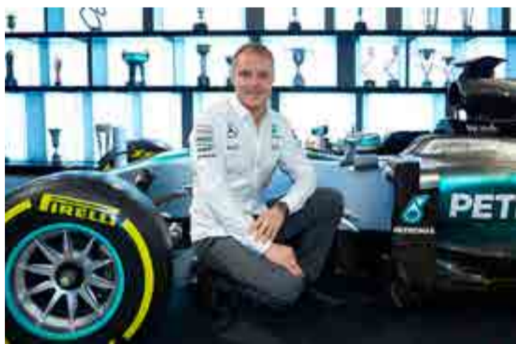
Bottas ganó el primer Gran Premio del año.

Si se cumple el vaticinio, Suzuki será el primer japonés con una placa en el neoyorkino templo de los inmortales, otro hito para quien fue además pieza clave en la selección que se coronó monarca en las dos primeras ediciones del Clásico Mundial de Béisbol en 2006 y 2009.