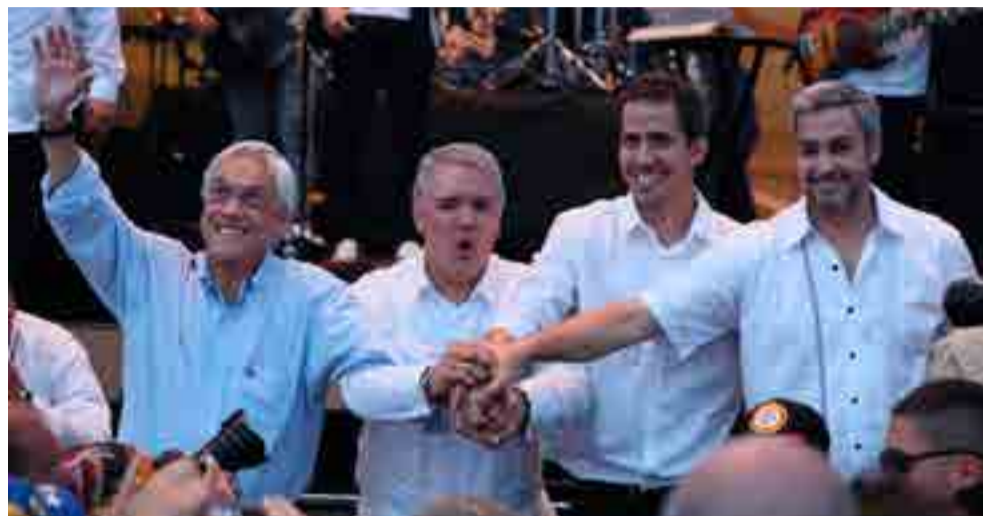
Los Gobiernos de derecha se reunieron en Santiago de Chile para asestarle un golpe definitivo a la Unasur.

Por otra parte, si definitivamente se materializa la idea, Prosur nacerá coja, pues a la segregación de Venezuela, se suma la ausencia de Uruguay, Bolivia, Guyana y Surinam, cuyos Gobiernos mantienen serias reservas sobre la utilidad y los objetivos del concepto incubado en Bogotá y Santiago.