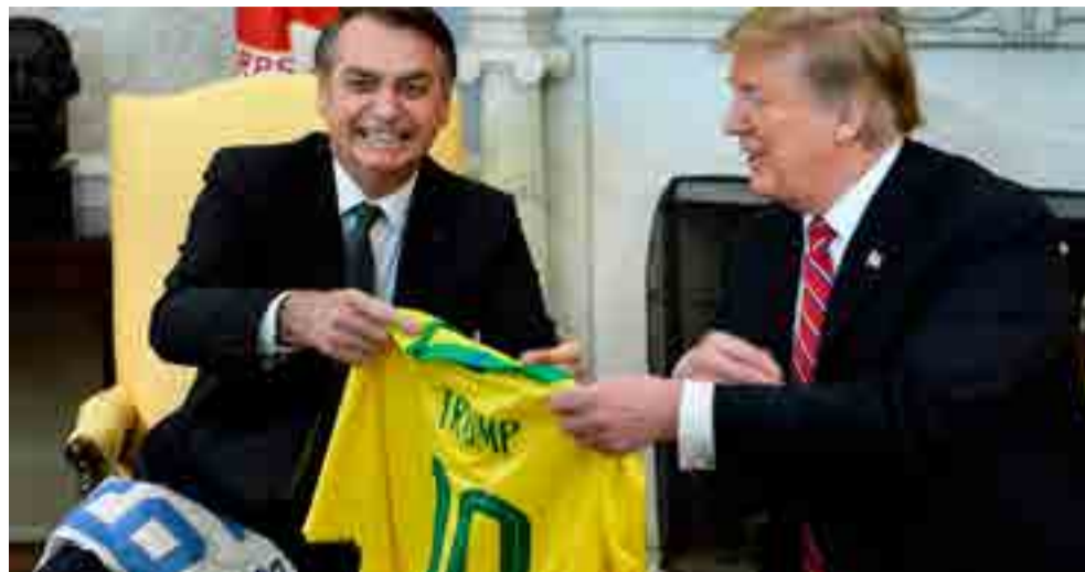
Bolsonaro hizo gala de su entreguismo al entrevistarse con su idolatrado homólogo estadounidense.

Comentaristas alertan que Trump le puso después la guinda a la torta cuando en una