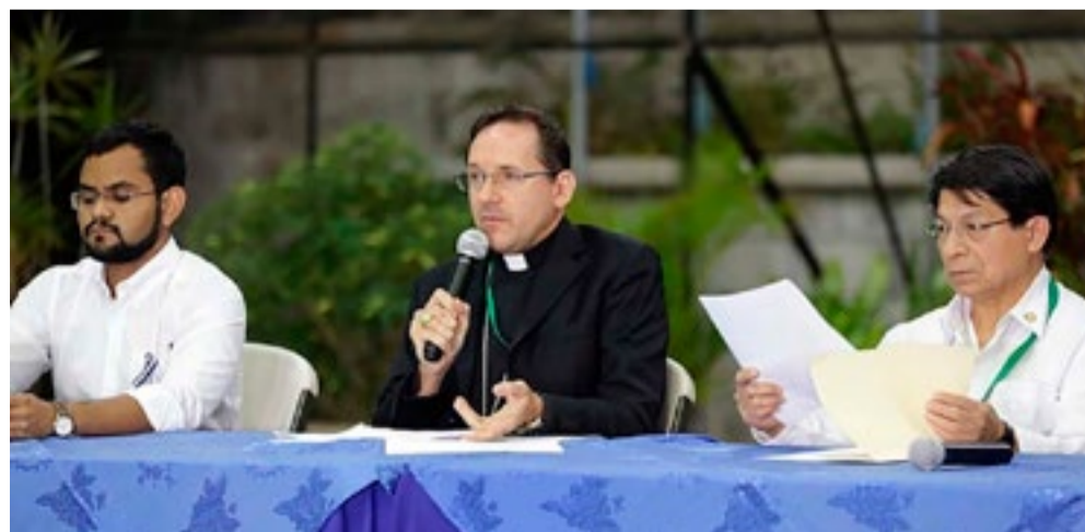
El Gobierno sandinista ratificó su voluntad de cumplir los acuerdos alcanzados hasta ahora.

También recuerdan que, a través de la historia, cada momento en que los antagonistas se sientan a conversar lo más lógico es que además sea el tiempo de la tregua necesaria.