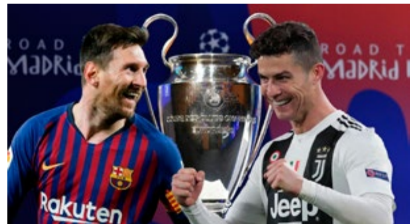
Una década después, Messi y Cristiano podrían reeditar su “cara a cara” en la final de la Champions.

Después de la ida de los cuartos de final, Messi y Cristiano Ronaldo están más cerca de la final. Es cierto. Pero los otros pesos pesados harán hasta lo imposible por destrozarse hasta lo imposible por destruir los sueños de la mayoría, por sepultar la gran final soñada.