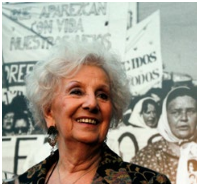
La presidenta de las Abuelas de Plaza de Mayo, Estela de Carlotto, dio a conocer el hallazgo de la nieta 129.