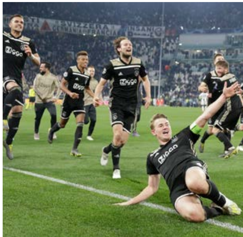
El Ajax eliminó a Juventus y Real Madrid.