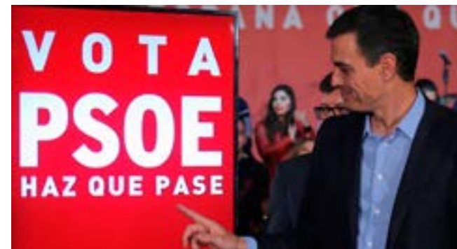
El partido del actual gobernante español parte como favorito.

Nadie duda en esta nación europea acerca de la importancia de reconstruir Notre Dame, que más que una catedral, es una parte indispensable del patrimonio histórico, cultural e identitario de Francia. Sin embargo, tal como señalan medios de comunicación, personalidades y ciudadanos, los donativos inmediatos evidencian que sí hay dinero para actuar ante otras tantas tragedias como la pobreza o la pésima situación de los migrantes, aunque estas sean menos mediáticas.