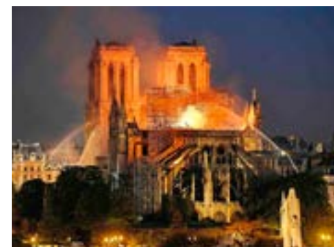
Arde Notre Dame