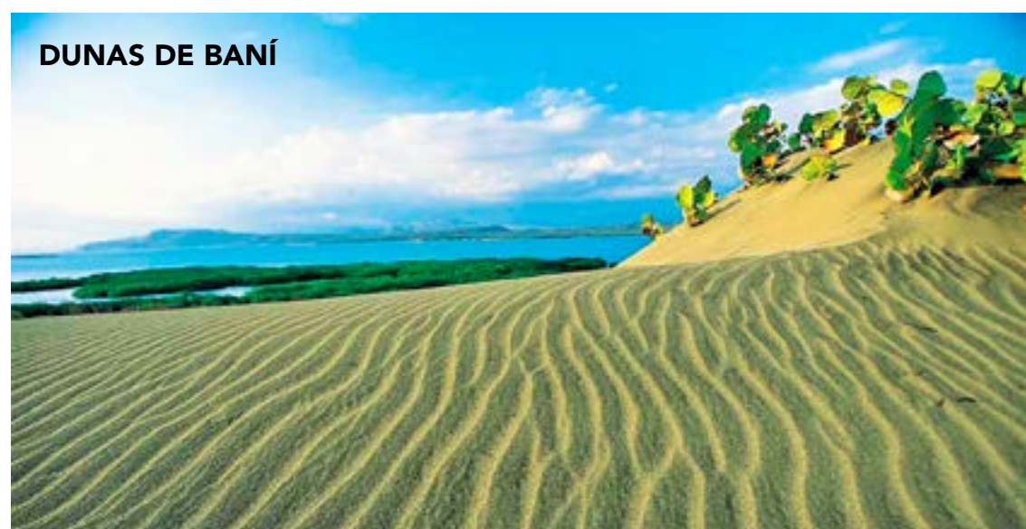
DUNAS DE BANÍ

Con una importante función social, La Carolina persiste y vence los rigores del tiempo, para recordarnos que desarrollo urbanístico y entorno natural, pueden y deben convivir en armonía.