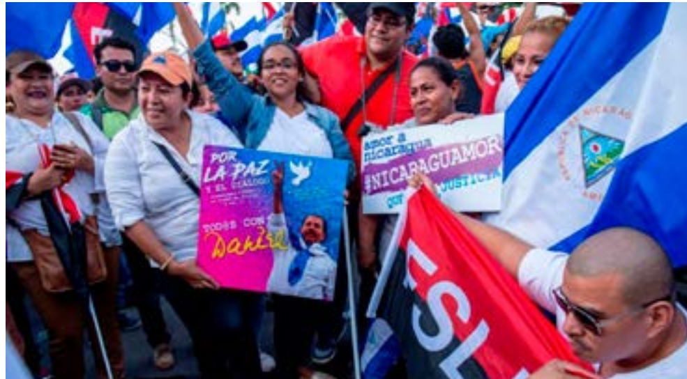
Un año después, la nación centroamericana busca recuperar la normalidad que le arrebató la intentona golpista.

El saldo de aquellas jornadas de tranques y violencia extrema aún lacera a las familias nicaragüenses y al país en general, que desde entonces trata de retomar el rumbo de progreso sostenido, que transitó durante más de una década.