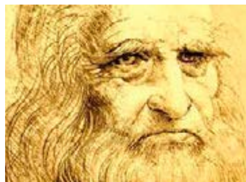
500 años de un genio