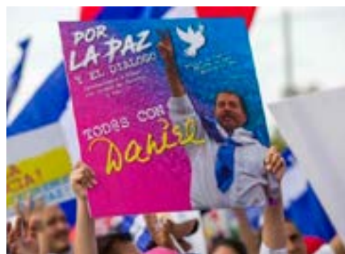
Tras la tormenta

Mientras, fuera de las fronteras estadounidenses, la jefa de la diplomacia de la UE, Federica Mogherini; la comisaria de Comercio, Cecilia Malmstrom; y la canciller canadiense, Chrystia Freeland, criticaron la negativa de la Casa Blanca a suspender el Título III y amenazaron con acudir a la Organización Mundial del Comercio, dada la aplicación extraterritorial de medidas unilaterales sobre Cuba que violan el derecho internacional.