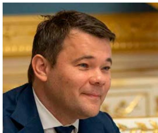
Bogdan obagó por negociaciones de paz con Rusia.

Si queremos la paz, debemos conversar, declaró Bogdan al canal 1+1. Sin embargo, Moscú