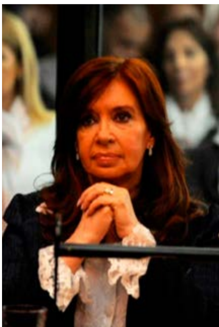
Para Cristina Fernández el proceso judicial en su contra es una cortina de humo.

Tranquila, con la frente en alto y una escarapela blanca y celeste en el saco azul oscuro que vestía, se le vio llegar a los Tribunales. Minutos antes, las televisoras la habían seguido desde la salida de su casa, donde una ola de admirado-