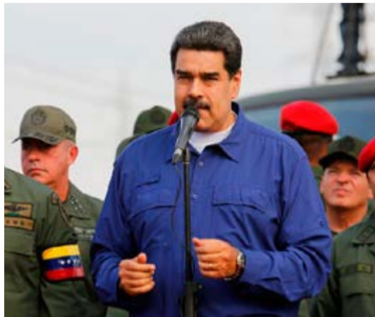
El presidente Nicolás Maduro ratificó disposición al diálogo con la oposición.

"Vamos a elecciones de la AN para ver quién tiene los votos. Asumimos el reto, vamos para buscar una solución pacífica, democrática y electoral", sentenció el presidente venezolano en un acto con sus seguidores en Caracas a un año de su reelección en la máxima magistratura de la nación.