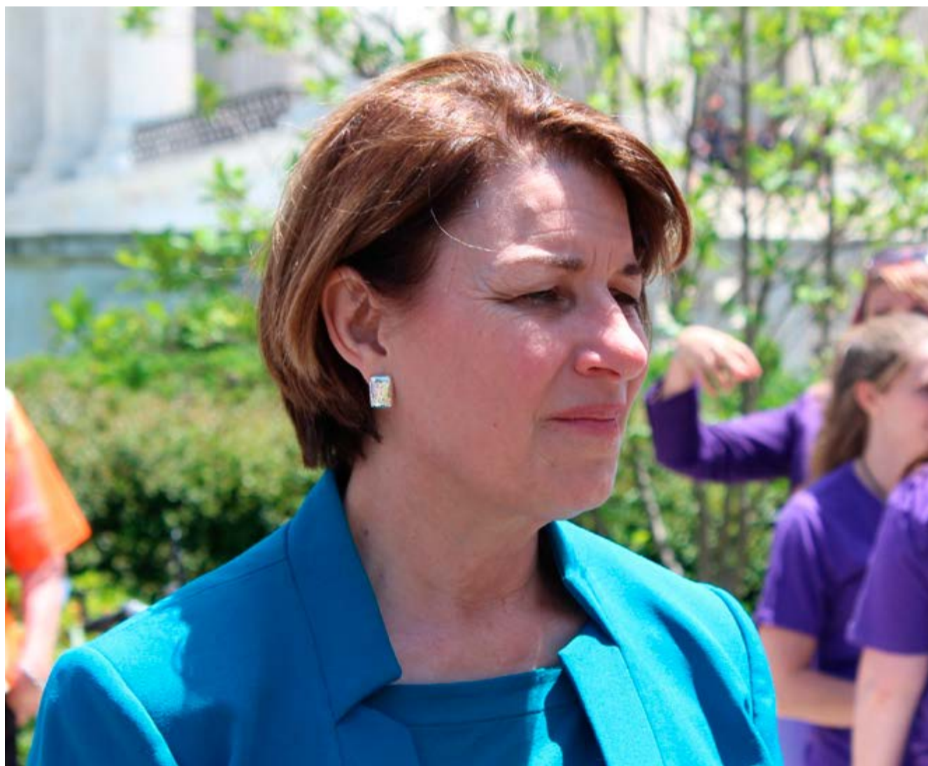
Klobuchar expresó su desacuerdo con las medidas adoptadas por Trump contra Cuba.