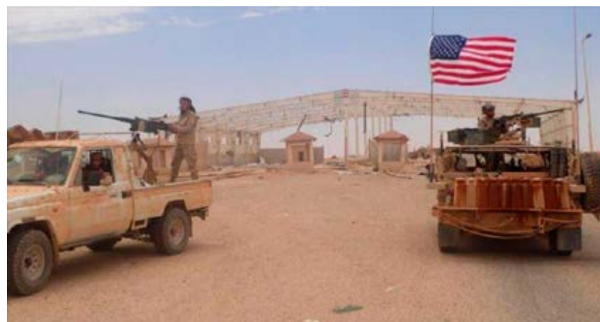
Estados Unidos mantiene bases militares ilegales en las provincias norteñas de Aleppo, Hasaka y Deir Ezzor.

Por otro lado, los remanentes del Daesh en áreas fronterizas con Iraq, presuntamente "liquidados" por la coalición encabezada por los estadounidenses, continúa acciones esporádicas contra las Fuerzas Armadas sirias en el vasto desierto en el este de la provincia de Homs y que comprende, entre otras, a las estratégicas ciudades de Raqqa y Palmira.