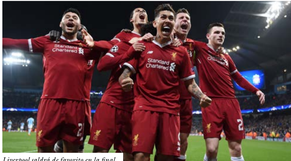
Liverpool saldrá de favorito en la final.

Demonios aparte, la historia señala al Liverpool como favorito al título. En 170 duelos bilaterales, el club de la ciudad de los Beatles archiva 79 éxitos, por 48 del Tottenham, además de 43 empates.