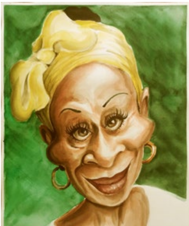
Omara Portuondo será uno de los rostros animados.

Artistas reconocidos como embajadores culturales por dicha entidad o considerados con la distinción Estrella del Siglo serán los protagonistas de la producción titulada Tito Reacciona .