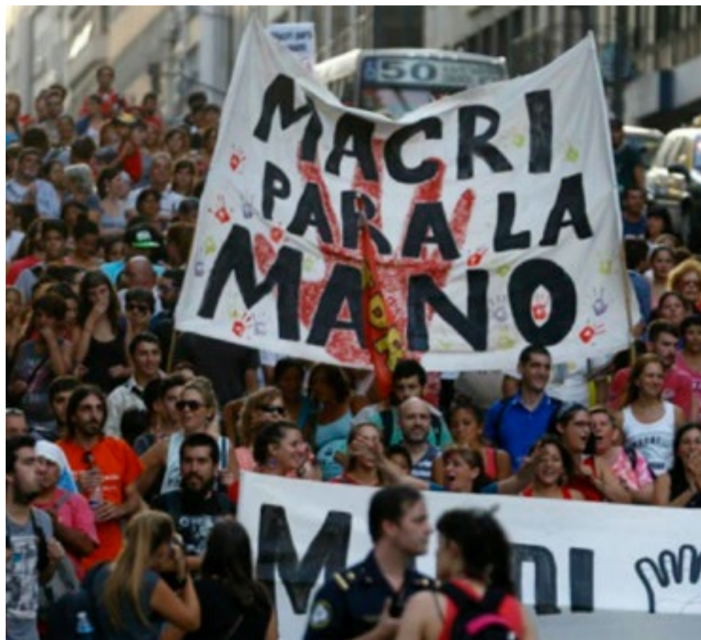
La protesta convocada por la CGT se multiplicó en diversas ciudades frente a las políticas del Gobierno de Mauricio Macri.

Con esto "le decimos a las autoridades que tomen acciones inmediatas para lograr frenar esta caída y decadencia social, política y económica que tenemos en nuestro país", sostuvo.