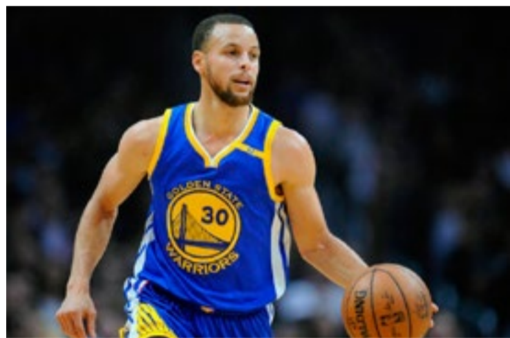
Curry busca su primer premio MVP en Finales de NBA, ante los Raptors.

Precisamente, las anteriores cuatro presentaciones de la franquicia de Oakland en la discusión del título fueron todas ante los por aquel entonces Cavs del Rey LeBron, quien después de perder en tres de esas ocasiones decidió marcharse a la soleada California para probar otra suerte (una peor, de hecho).