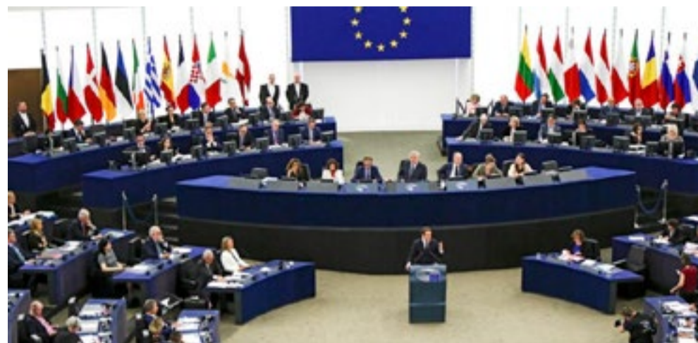
El Parlamento Europeo quedó más fragmentado tras los comicios de mayo.