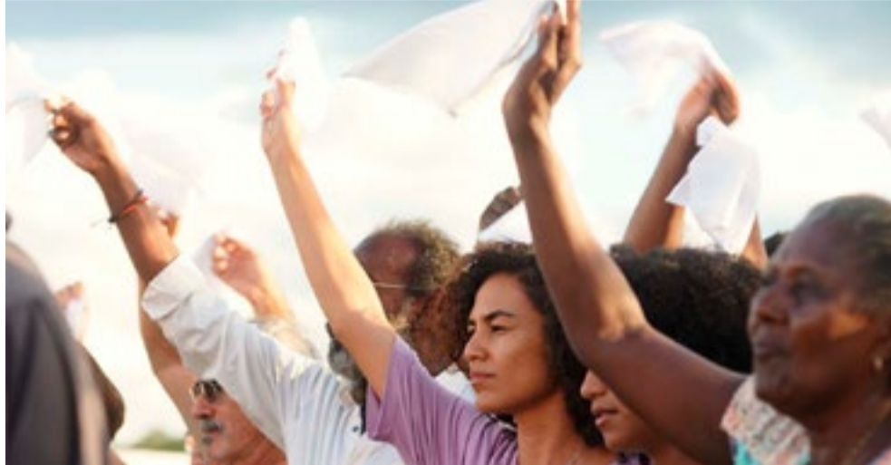
El filme brasileño Bacurau estuvo entre los más aclamados en el festival de cine francés.

Brasil también brilló en la sección "Un certain regard", la segunda en importancia en el festival, en el que la película La vida invisible de Eurídice Gusmao , de Karim Aounou, alcanzó el máximo lauro.