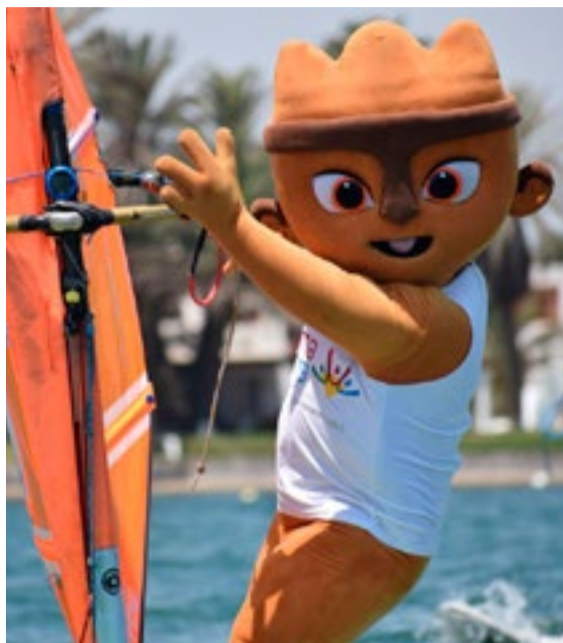
Milco amenizará las competencias durante la cita peruana.

Acto seguido, estarán los Parapanamericanos, que reunirán a 1 890 participantes en los 17 deportes (18 disciplinas), del 23 de agosto al 1 de septiembre.