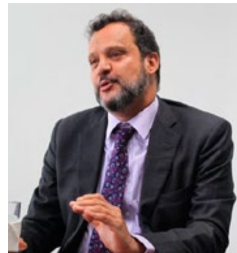
El director ejecutivo de la OIA habló con Orbe sobre los desafíos de la industria azucarera.