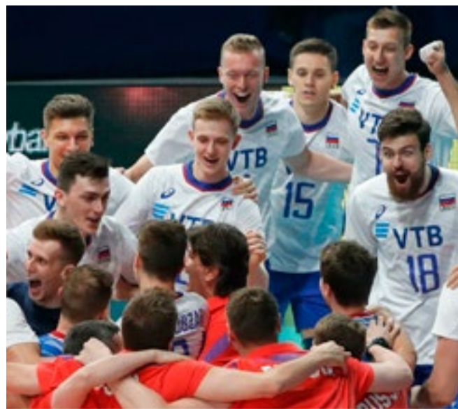
El país europeo mantiene la hegemonía en el voli masculino.

Jhonah Díaz González deportes@prensa-latina.cu