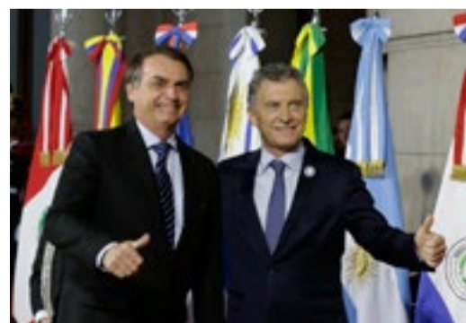
Jair Bolsonaro y Mauricio Macri intentan sembrar el neoliberalismo en el bloque regional.

Si algo dejó claro la reunión de Santa Fe es que el Mercosur peligra en las manos de un Bolsonaro "que no quiere una Patria Grande en Suramérica".