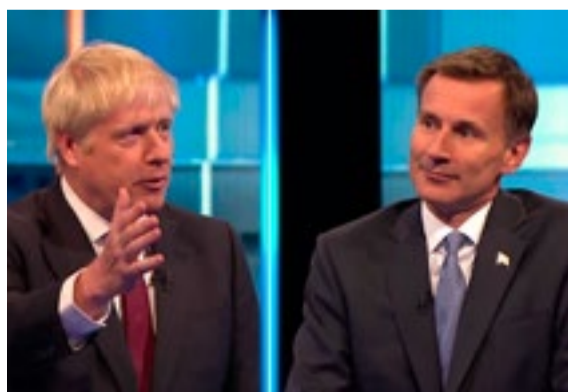
Boris Johnson y Jeremy Hunt apuntan al cargo de primer ministro en el Reino Unido.

En medio de la crisis política que divide al país también se alzan las voces de la oposición, que claman por adelantar las elecciones generales, una opción que tampoco debe descartarse, sobre todo si el nuevo primer ministro no logra superar el voto de confianza en el Parlamento, donde la mayoría se opone a una salida sin acuerdo.