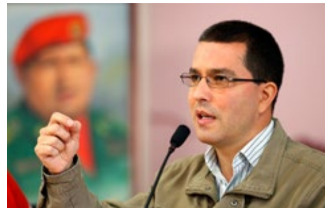
El canciller venezolano, Jorge Arreaza, denunció las maniobras contra las conversaciones impulsadas por el Gobierno.

A su vez, el ministro de Comunicación e Información, Jorge Rodríguez, exigió respeto por la soberanía de Venezuela