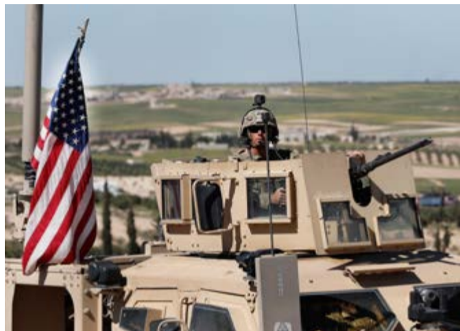
Tropas estadounidenses siguen campeando en Siria.

Por Pedro García Hernández Corresponsal jefe/Damasco