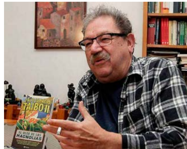
Paco Ignacio Taibo II resaltó la impronta del poeta cubano Fernández Retamar durante la Feria del Libro de La Paz.

Recordó una de las figuras más relevantes en la XXIV FIL de La Paz, que produjo dos antologías de Retamar en México, y él fue el artífice de que su libro sobre el Che se publicara en Cuba, y que gracias a él se presentó en Casa de las Américas con un gran debate.