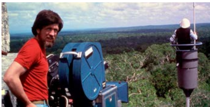
La selva del Petén sirvió de escenario a la Guerra de las Galaxias.

No podía faltar en el listado el lago de Atitlán, considerado uno de los más bellos del mundo con los tres volcanes que lo