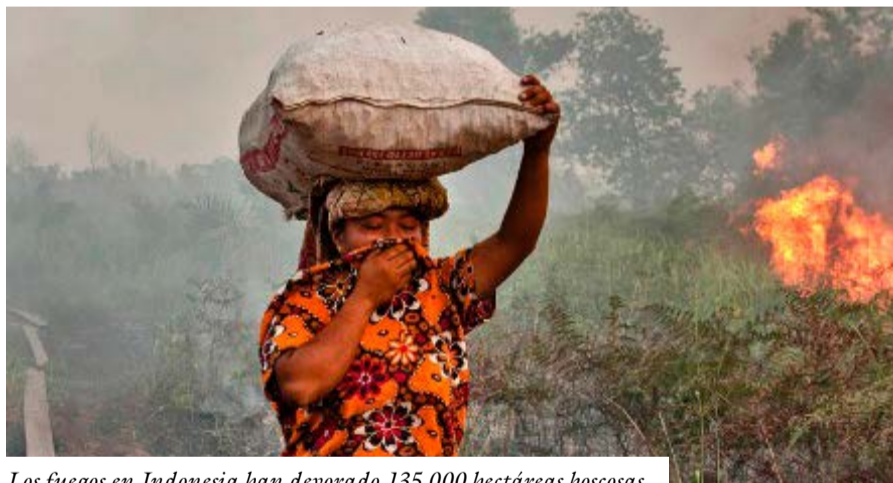
Los fuegos en Indonesia han devorado 135 000 hectáreas boscosas.

Ese es el mayor número de lugares bajo tal categorización desde los devastadores fuegos de 2015 en el país. Los actuales han arrasado más de 135 000 hectáreas de montes y obligaron a decretar el estado de emergencia en seis provincias de la isla de Sumatra y en una de la de Borneo.