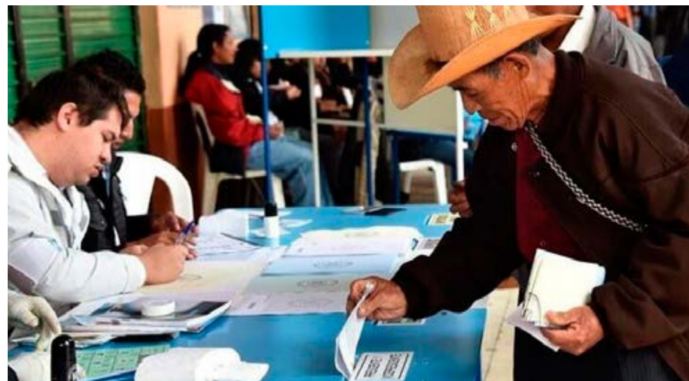
Casi ocho millones de guatemaltecos están convocados a elegir un nuevo presidente.

La vigilancia se incrementó en Iztapa, (Escuintla), Tajumulco y Esquipulas Palo Gordo (San Marcos), San Antonio Ilotenango (Quiché) y San Jorge (Zacapa), municipios donde se repetirán las elecciones para corporaciones municipales debido a los disturbios de la primera vuelta.