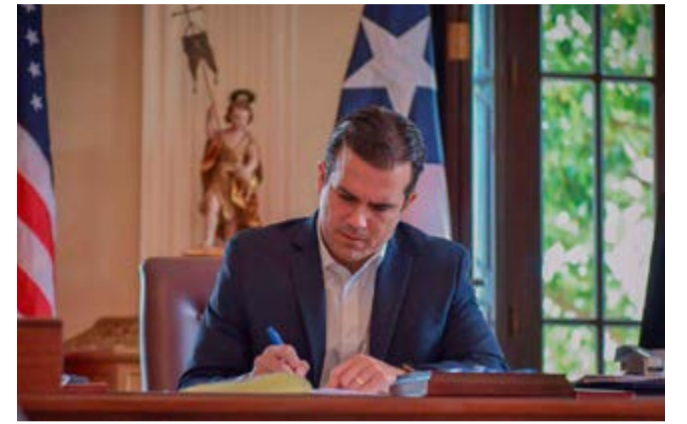
Roselló firmó 58 leyes en un solo día.

El derecho a la información pública, aclaró Blondet, deriva del derecho a la libertad de expresión, consagrado en la Carta de Derechos de la Constitución de Puerto Rico, tal como lo dictaminó el Tribunal Supremo de Puerto Rico en 1982.