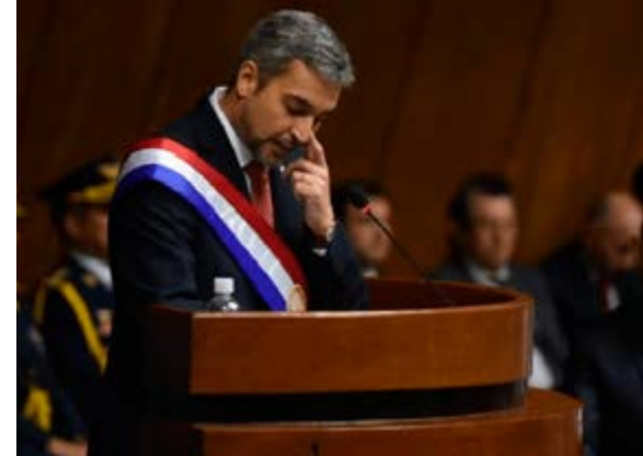
La formación derechista en el poder impide el enjuiciamiento del presidente Mario Abdo Benítez.