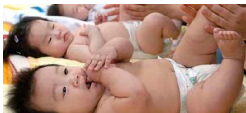
El país asiático registró en 2018 la tasa de natalidad más baja de su historia.

El jefe del ejecutivo nipón ha calificado al envejecimiento poblacional y la baja tasa de natalidad como una crisis nacional y prometió reformas laborales y de otro tipo para ayudar a aliviar la carga de las familias y alentar a las parejas a tener más hijos.