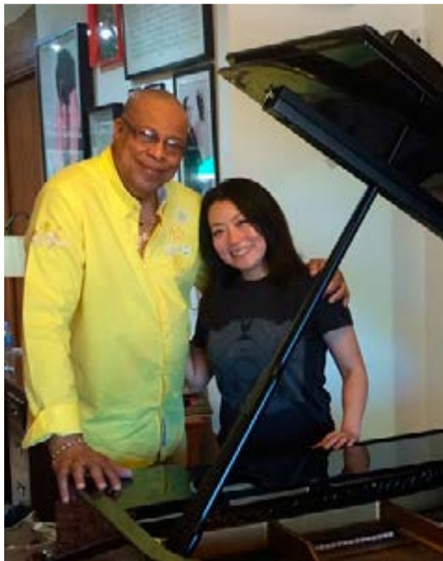
Chucho Valdés y la japonesa Mine Kawakami combinan sus mundos musicales en un reciente disco.

La artista japonesa comenzó a tocar el piano a los tres años y se graduó en la Escuela Superior de Música y Teatro de Múnich, Alemania, y además en el Real Conservatorio Superior de Música de Madrid, España. Una vez acudió a un recital de Valdés e inesperadamente emergió una necesidad imperiosa de interactuar con su obra y en particular con Amanecer , una pieza que le fascina.