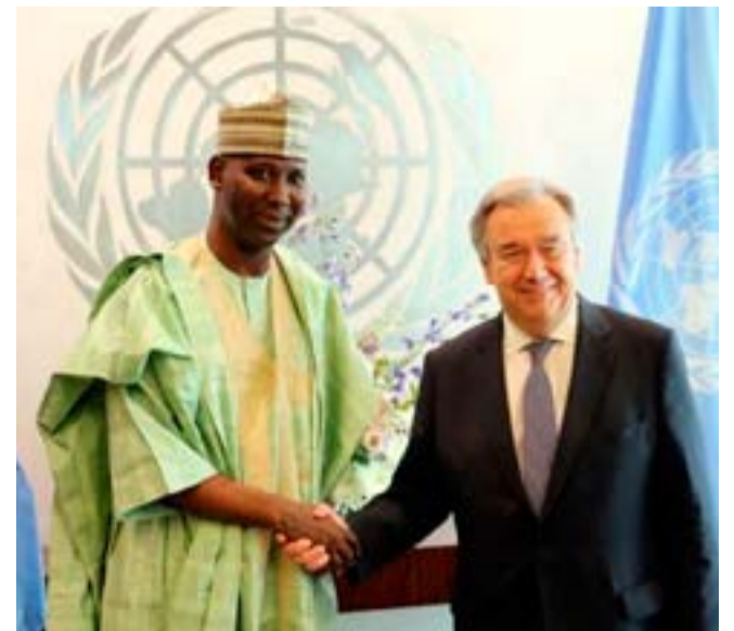
El nigeriano Tijjani Muhammad-Bande asumirá en septiembre la presidencia de la Asamblea General de las Naciones Unidas.

El continente africano es uno de los subrepresentados pues solo tiene tres integrantes no permanentes, que ahora son Sudáfrica, Guinea Ecuatorial y Costa de Marfil; mientras que las potencias occidentales dominan entre los cinco miembros permanentes, lo cuales son Estados Unidos, Reino Unido, Francia, China y Rusia.