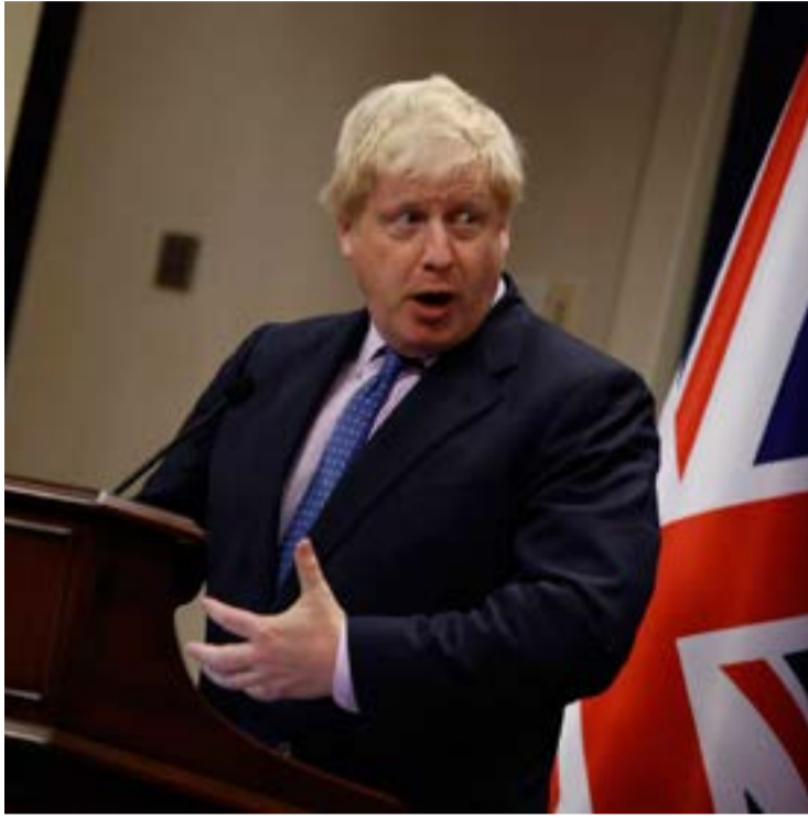
Boris Johnson, en su línea dura sobre el Brexit, se perfila como un serio candidato a ocupar el cargo.