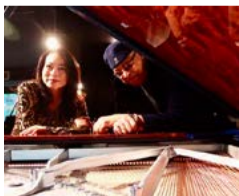
Chucho a cuatro manos