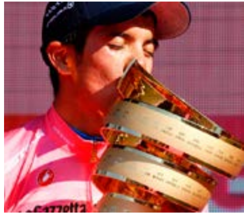
Richard Carapaz logró un título histórico.

Su desempeño llamó la atención de combinados europeos, y en 2016 recaló en la