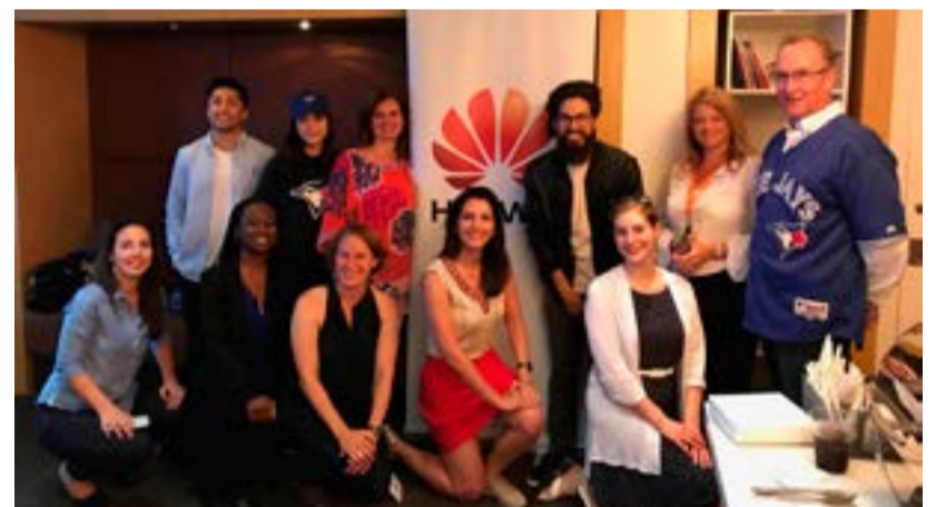
Huawei reclutará a jóvenes de todo el mundo para mantener su liderazgo.

De ese modo, según la coalición Engage Cuba, que promueve el levantamiento del bloqueo y quiere mejores lazos bilaterales, en total suman 22 los aspirantes demócratas a la Casa Blanca que están de acuerdo con un acercamiento a la Mayor de las Antillas.