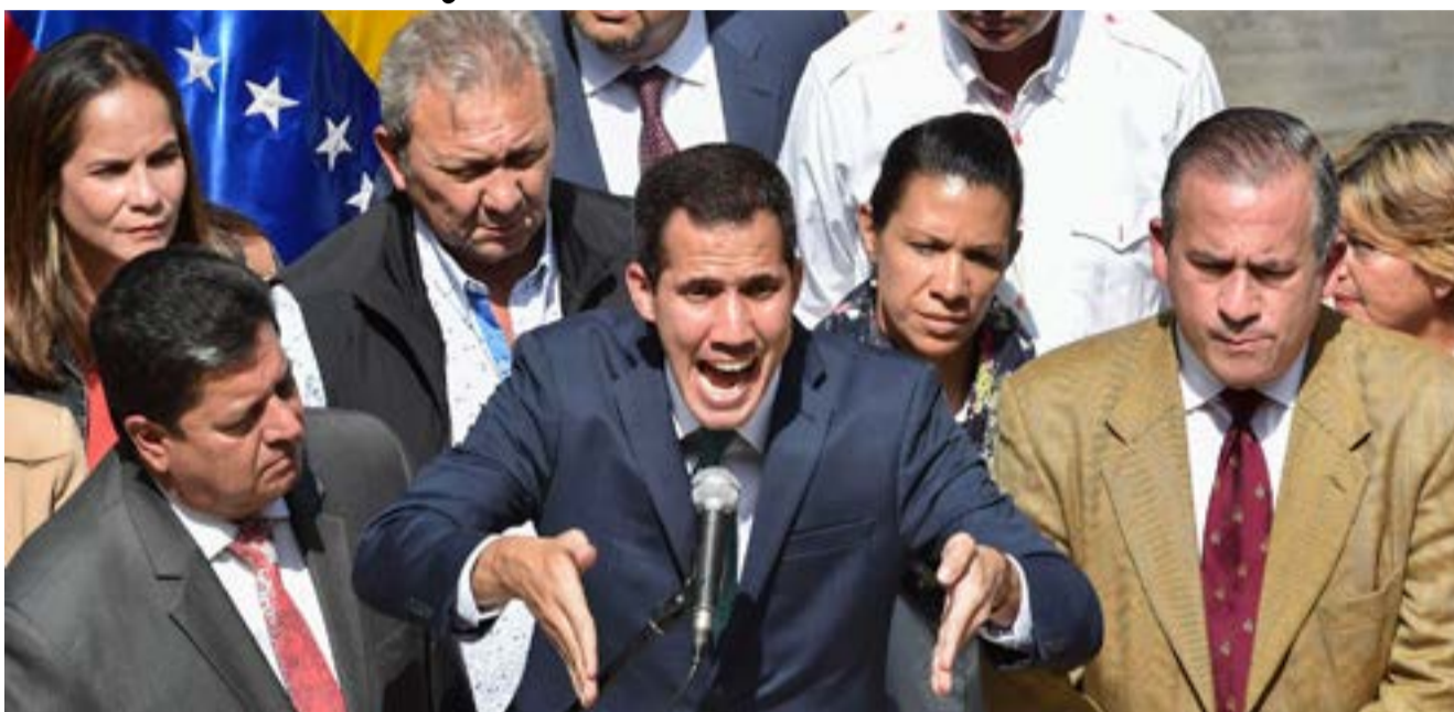
El autoproclamado presidente de Venezuela Juan Guaidó debe explicar los turbios manejos de sus acólitos.

Sus funciones, asignadas en carta firmada por Guaidó, incluían la atención de desertores, logística y seguridad de los “ciudadanos venezolanos, civiles y militares, que ingresan a territorio colombiano, buscando ayuda y refugio”. Sin