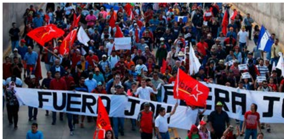
Las protestas en Honduras contra el presidente Juan Orlando Hernández crecen cada semana.