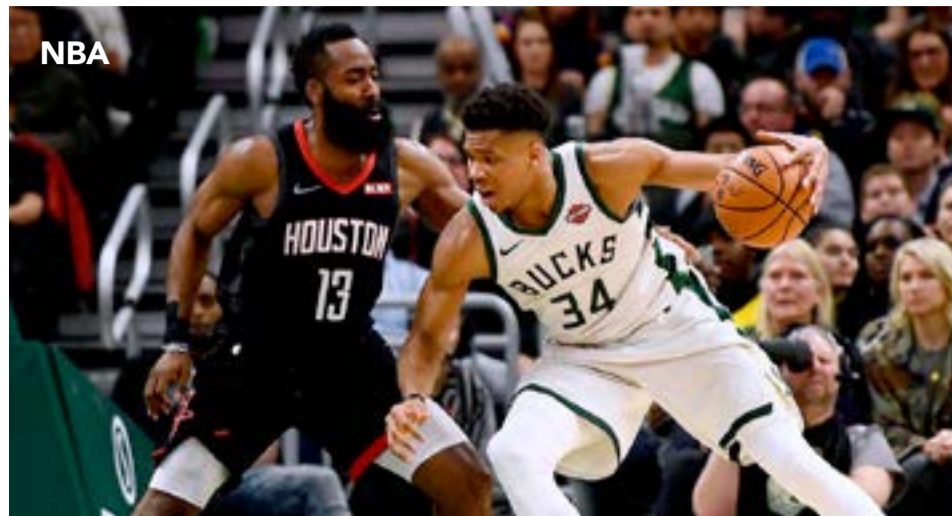
Giannis Antetokounmpo (a la derecha) se impuso a James Harden en el duelo por el MVP.