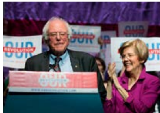
Los senadores Bernie Sanders y Elizabeth Warren.

El legislador por Vermont, quien ocupa el segundo puesto en la mayoría de las encuestas sobre los candidatos demócratas, manifestó que ese cerco ha sido gravemente perjudicial para las empresas estadounidenses y el pueblo de la Mayor de las Antillas.