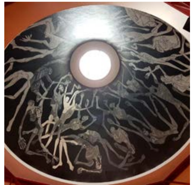
La Fundación que lleva su nombre conmemorará el centenario del insigne artista ecuatoriano.

"Te rendimos pleitesía, hermano, artista, pintor. Eres gloria de Ecuador con firmeza e hidalguía. Vaya el canto y la