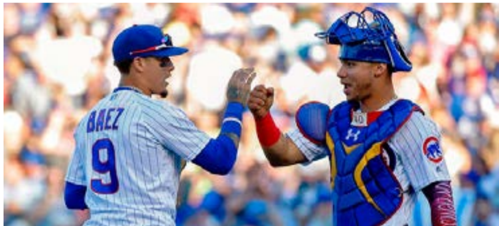
El boricua Javier Báez y el venezolano Willson Contreras integrarán el equipo de la Liga Nacional.

Los elencos de la Liga Americana poseen 44 éxitos para situarse al frente del concurso por la mínima diferencia, y el año pasado en el Nationals Park, de la capital estadounidense, el circuito menos antiguo se llevó el triunfo 8-6.