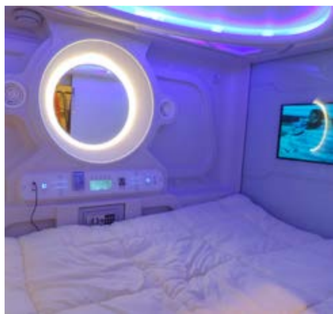
El peculiar hospedaje en Bolivia se inspira en un concepto desarrollado por los japoneses desde los años 80.

Cuenta con 44 camas cápsulas de acero de uso individual, distribuidas en ocho habitaciones, con un sistema que no permite que los sonidos de la calle perturben el descanso del huésped.