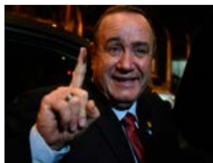
El candidato derechista ganó unas elecciones marcadas por el abstencionismo.

Tras dar a su candidato ganador anticipado en la segunda vuelta del 11 de agosto, el Partido Vamos festejó, en cambio, la perseverancia de un hom-