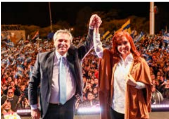
El binomio de Alberto y Cristina Fernández registró un rotundo triunfo en las elecciones primarias.

Alegría para la mayor fuerza política opositora, tristeza y rostros desenchajados desde el oficialismo, las conocidas