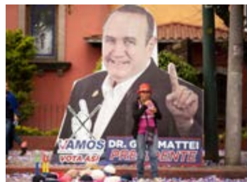
Más de lo mismo