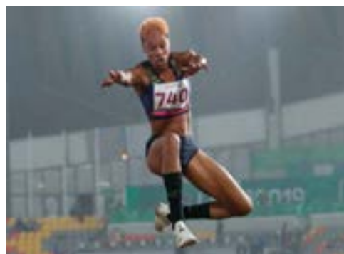
Lo que dejó Lima