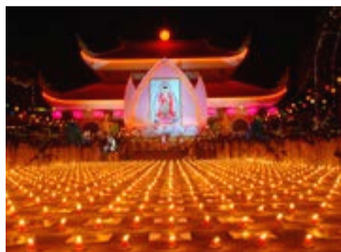
Festival de los fantasmas