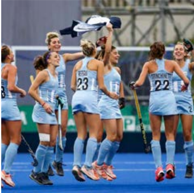
Con las Leonas del hockey al frente, Argentina dominó en los deportes colectivos de estos Juegos Panamericanos.

Muy cerca de los punteros logró colocarse Colombia, protagonista de lo que su Comité Olímpico nacional calificó de actuación histórica sustentada en los resultados de varias disciplinas con la medalla de oro por primera vez en los anales del deporte o la modalidad desde que se practica en el país.