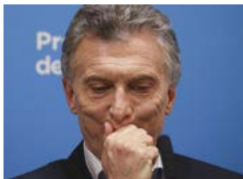
Argentina se rebela

Asimismo, Messenger, WhatsApp e Instagram —los dos últimos parte también del conglomerado de la red social— deberán cumplir las reglas propuestas.