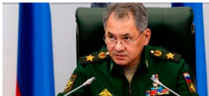
El ministro ruso Serguéi Shoigu patentizó el respaldo de su país a Venezuela ante la política desestabilizadora de EE. UU.

Cifras de la OCDE indican que Chile es el quinto país menos productivo de ese grupo de 34 naciones, pero también uno de los que presenta jornadas de trabajo más largas.