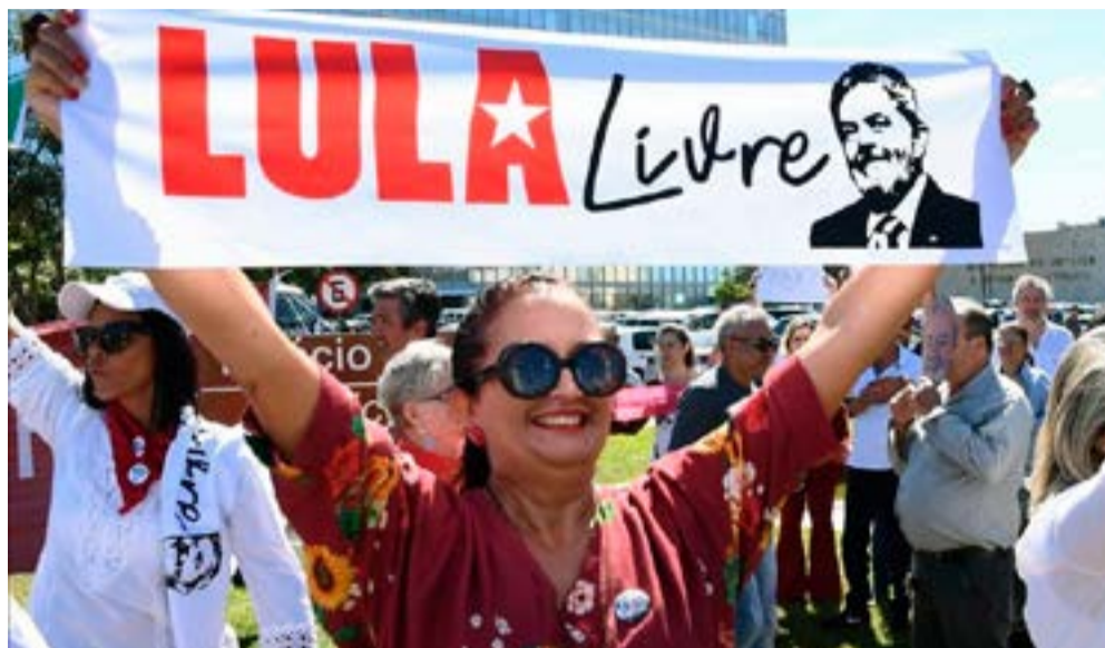
Los reclamos por la liberación de Lula se multiplican ante las irregularidades que signaron su enjuiciamiento político.