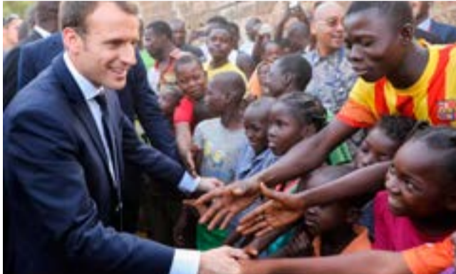
Seis décadas después, Francia sigue extrayendo los recursos de sus ex colonias africanas.

Hasta el año 2004 Haití tuvo que pagarle la misma tasa a Francia. En 1825, cuando reconoció la independencia de Haití, el entonces presidente haitiano, Jean-Pierre Boyer,