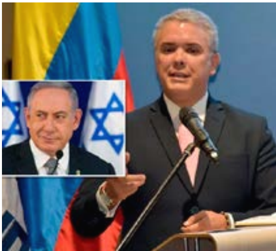
Tel Aviv apoya las maniobras en la frontera de Colombia.

Explicó que la empresa anglo-israelí Daincorp, que venía operando en el Medio Oriente como contratista de guerra, se estableció recientemente en Cúcuta para reclutar y entrenar a desertores venezolanos.