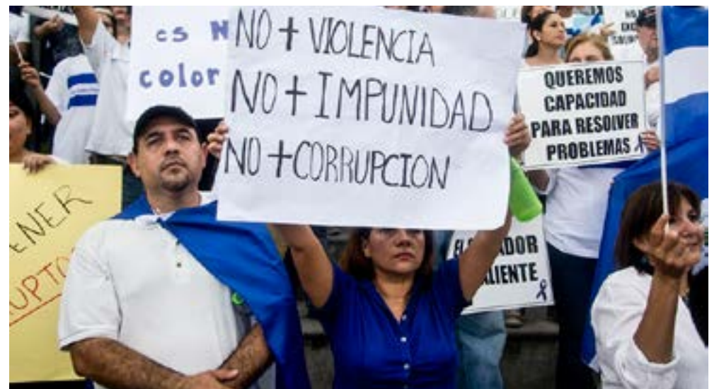
En El Salvador se reaviva la polémica en torno a la forma de encarar la lucha contra la corrupción.

Tal criterio cobra sentido, en tanto la administración de Bukele apunta ya a las elecciones legislativas y municipales de 2021, en las cuales aspira a barrer aupado, nuevamente, en un discurso contra quienes define como "los de siempre".