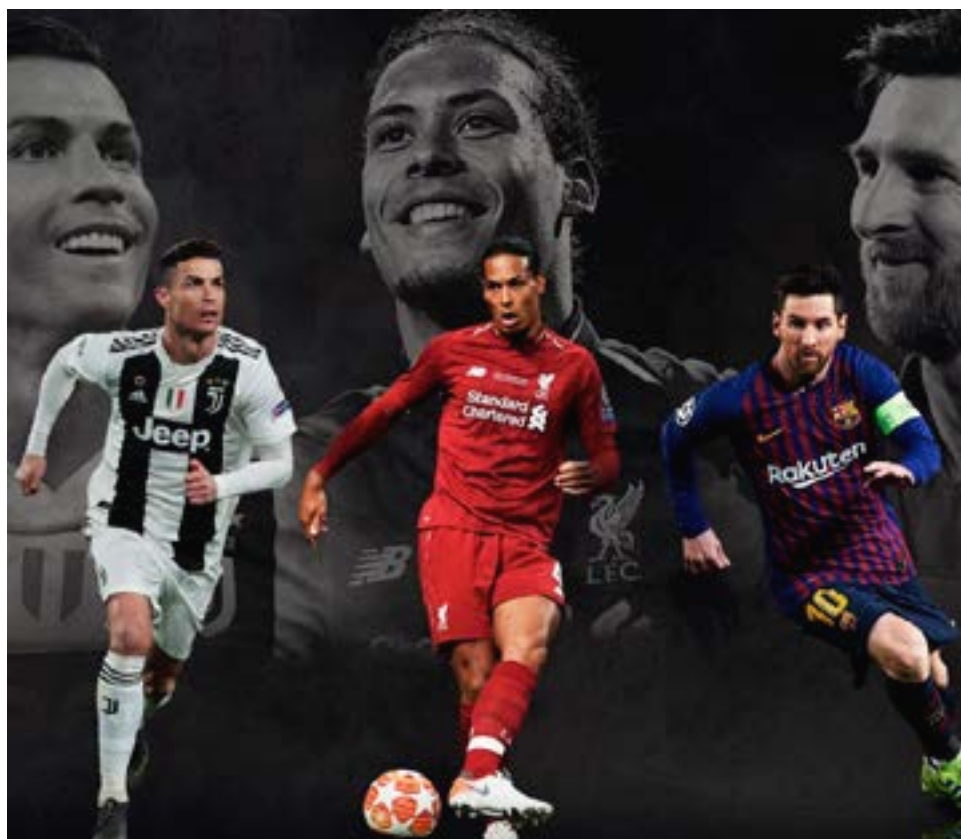
El holandés Van Dijk (centro) es la alternativa en el premio The Best a los casi omnipresentes Cristiano Ronaldo y Lionel Messi.

Algo sí tengo bastante claro: el ser humano es el único animal sobre la faz de la Tierra que choca dos veces con la misma piedra. Crucemos los dedos.