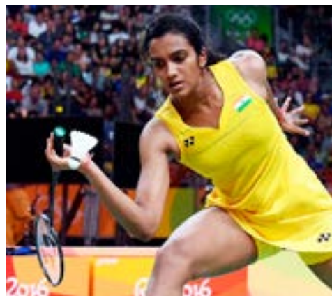
Puserla Venkata Sindhu.