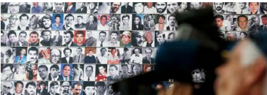
El libro Mi vida son nuestras batallas expone que más de 300 periodistas han sido asesinados en México desde 1983.

Mi vida son nuestras batallas , según su escritor, constituye lectura obligada no solo para los estudiantes de periodismo, sino para aquellos que se solidarizan con los profesionales de la prensa, tan expuestos a agresiones de todo tipo, sin que el peligro los amedrente en el cumplimiento de su deber de informar.