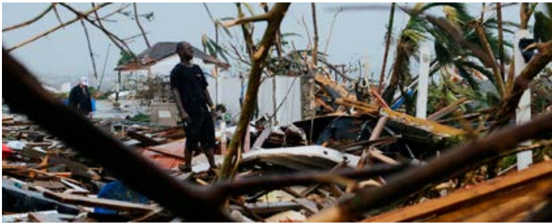
El paso del huracán provocó al menos 30 muertos e incalculables daños materiales en Bahamas.