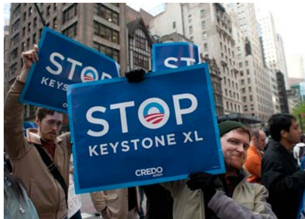
Grupos ecologistas se oponen desde hace años al enclave petrolero en Canadá y EE. UU.

A pesar de esa anuencia de la Casa Blanca, el proyecto de la empresa TC Energy, llamada hasta hace poco TransCanada, ha enfrentado desafíos a nivel estatal, por lo