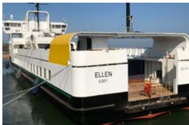
La embarcación realizó su primer viaje el pasado 15 de agosto.

El proyecto de Ellen se inició en 2015 con fondos del mayor programa de investigación e innovación de la Unión Europea, que pretende desplegar más de 100 transbordadores de ese tipo para 2030.