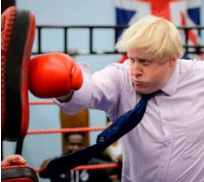
La opción de un Brexit duro impulsada por el primer ministro se estrelló en las votaciones del Parlamento británico.

Por Néstor Marín Corresponsal jefe/Londres