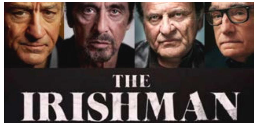
La película con Robert de Niro, Al Pacino y Joe Pesci, se estrenará el 1 de noviembre.