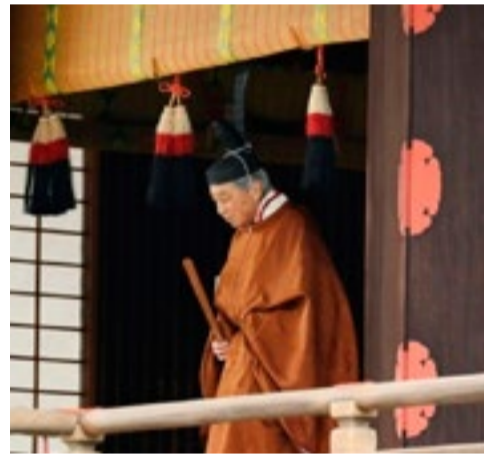
El emperador Akihito abdicó luego de tres décadas de reinado.

En un segundo acto en el que estaban presentes 266 representantes políticos e institucionales, incluidas las mujeres, el nuevo emperador se comprometió a seguir el ejemplo de su padre y "siem-