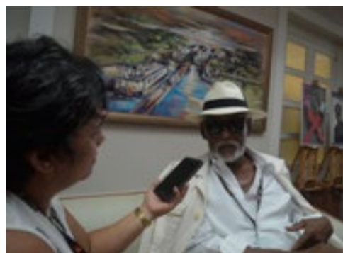
Maestro del cine