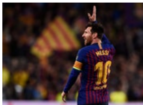
Impronta de Messi