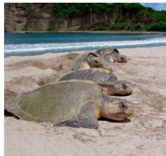
El fenómeno afectará el hábitat de las tortugas marinas verdes.

Si bien el aumento del nivel del mar es una amenaza para los mismos, los expertos indican que también lo son las es-