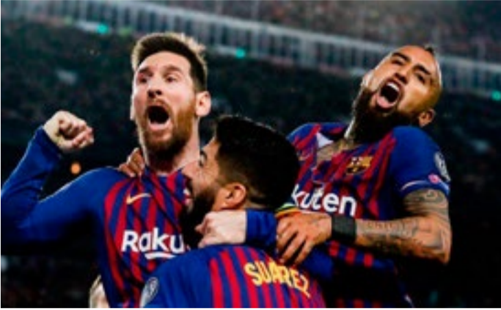
Messi llegó a 600 goles con el Barça.

Las loas a Lionel Messi llueven por todos lados. El genio del FC Barcelona dejó visto para sentencia el duelo de Champions contra el Liverpool y allanó su camino hacia los más importantes premios individuales, léase el Balón de Oro y el FIFA The Best. Sí, porque gane o no el título de Europa el club azulgrana, nadie, ni de cerca, tuvo mejores prestaciones que el argentino en la temporada.