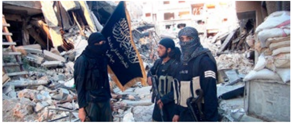
El grupo terrorista opera en las zonas de Siria ocupadas ilegalmente por EE. UU. y sus aliados.

Esos detalles, sin embargo, no explican cómo y por qué las capacidades tecnológicas y militares de rastreo de Estados Unidos y la coalición internacional que comanda, no acaban de capturar al cabecilla, al que irónicamente liberaron sin explicaciones en 2004