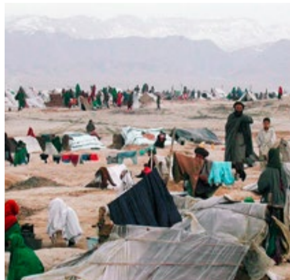
Los enfrentamientos provocaron ya más de 50 000 desplazados en la provincia de Nangarhar.

De acuerdo con la versión oficial afgana, el ejército ha hecho retroceder a los terroristas con infantería y ataques aéreos. Sin embargo, cada vez son más frecuentes los enfrentamientos en esa convulsa región con importante saldo de muertos y heridos.