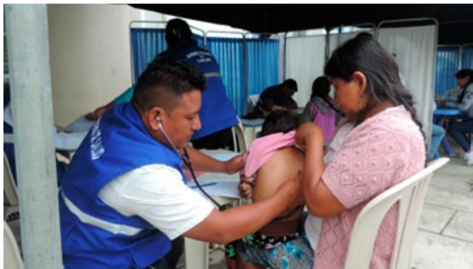
La Brigada Médica Cubana atiende gratuitamente a miles de pacientes en lugares recónditos.

En 2016 surgieron estas Ferias de Salud por iniciativa de Morales y en saludo al 90 cumpleaños del líder histórico de la Revolución cubana, Fidel Castro.