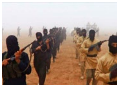
Historia de no acabar

El nuevo ataque al orden constitucional en Venezuela cerró un primer tercio del año marcado por una agresión multiforme contra la nación suramericana, traducida en intentos por instaurar un gobierno paralelo, el recrudecimiento de las sanciones económicas, tentativas de intervención bajo pretextos humanitarios y sabotajes al sistema eléctrico nacional.