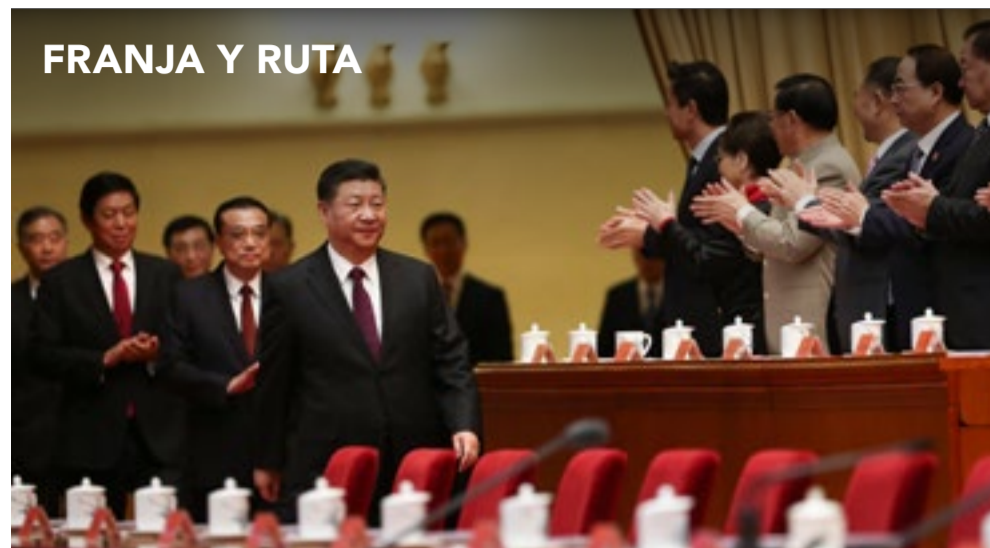
La iniciativa de Beijing es respaldada actualmente por 129 países y 29 agrupaciones mundiales.