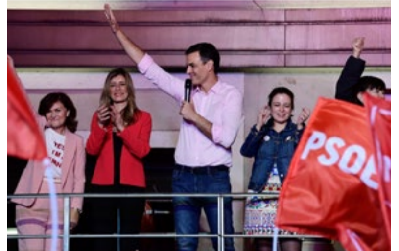
Pedro Sánchez explora posibilidades para formar el Gobierno de España.

Cuba no negocia su solidaridad con Venezuela ni con ningún otro país, remarcó Fernández de Cossío, al reafirmar la posición soberana y libre de cualquier injerencia asumida por la nación caribeña.