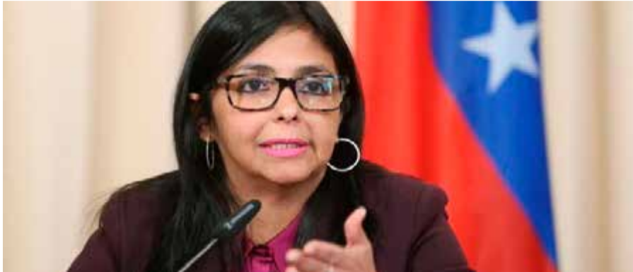
La vicepresidenta venezolana, Delcy Rodríguez, rechazó planes de intervención militar.