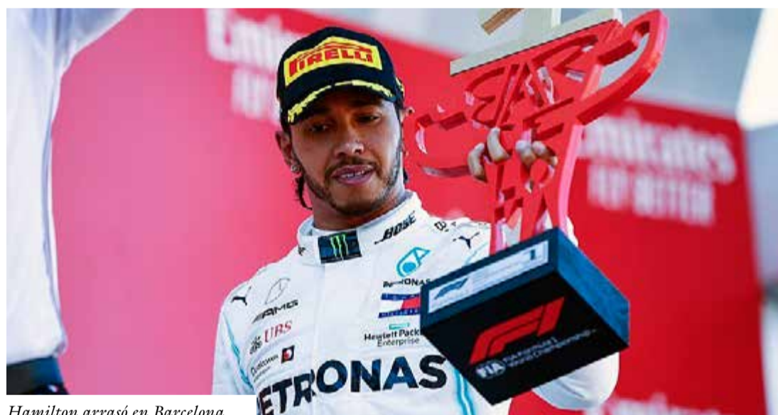
Hamilton arrasó en Barcelona.

En total, quedan con vida cuatro clubes de Argentina, seis de Brasil, uno de Uruguay, dos de Ecuador y tres de Paraguay.