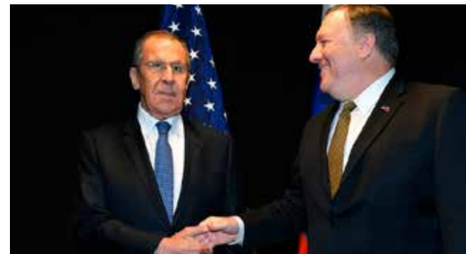
Secretario norteamericano de Estado, Michael Pompeo (derecha) y su similar ruso, Serguéi Lavrov, reunidos en Sochi.

El tema de la estabilidad estratégica fue uno de los más concretos de la cita de Sochi, según consideran analistas.