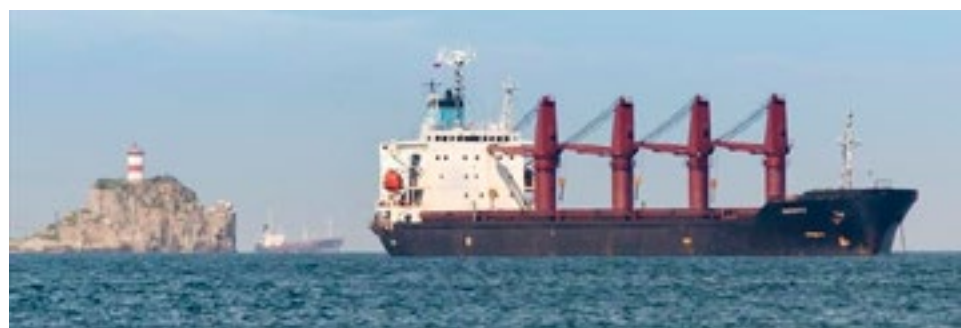
EE. UU. se apoderó del barco norcoreano Wise Honest por “violar” sanciones.

Rousseff fue depuesta del cargo de presidenta por un golpe parlamentario-judicial en 2016.