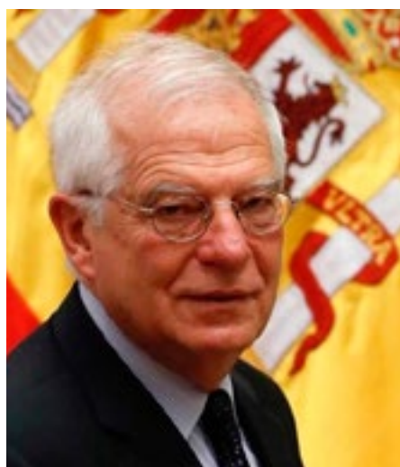
El canciller español repudió las medidas que recrudecen el bloqueo contra Cuba.

Por Eduardo Rodríguez-Baz Corresponsal jefe/Madrid