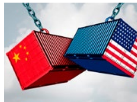
Escala guerra comercial