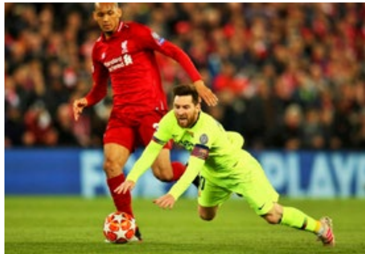
El Barcelona de Messi naufragó ante otra remontada épica del Liverpool.

Hace tres años falleció. Y desde entonces, el Barcelona no volvió a ganar la Liga de Campeones de Europa. El Ajax mucho menos. Esta temporada todo hacía indicar que, sin planificación de ningún tipo, el fútbol le dedicaría un homenaje. En algún momento todo el mundo lo pensó. Ventajas de tres goles no se pierden casi nunca.