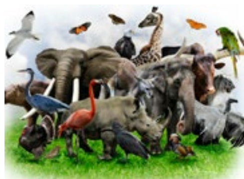
¿Extinción en masa?

*Docente e investigador del Instituto de Estudios Latinoamericanos de la Universidad Nacional de Costa Rica. Tomado del portal Firmas Selectas de Prensa Latina www.firmas.prensa-latina.cu . Usted puede encontrar en ese sitio más artículos de este y otros destacados intelectuales.