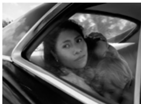
La estrella de Roma