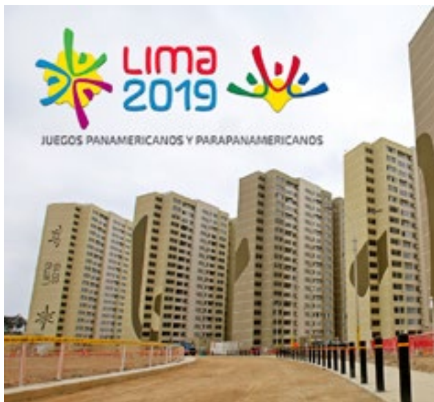
Villa que acogerá a las delegaciones deportivas.

Asimismo, la delegación cubana visitó las instalaciones de la Villa Panamericana y diversos escenarios de las competencias y se reunió con el equipo cubano de tiro, que entrena en Lima para su participación en los Juegos, y con el seleccionado masculino de voleibol que participa en el torneo panamericano Sub-21.