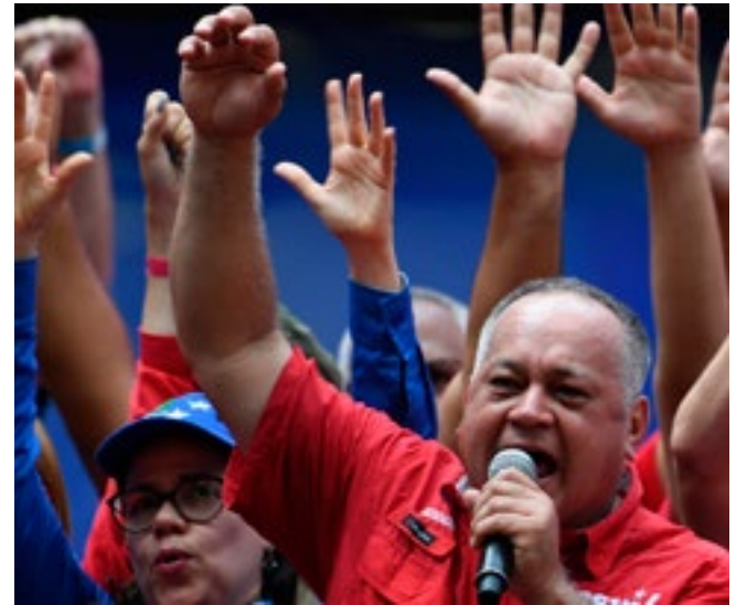
El presidente de la Asamblea Constituyente, Diosdado Cabello, aseguró que los responsables serán enjuiciados.

Las autoridades venezolanas denunciaron que la operación buscaba llamar a la violencia a la sociedad como parte de la agenda de ese sector, enfocada en desconocer a las autoridades legítimas del país suramericano.