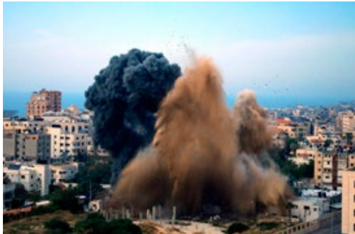
Al menos 12 civiles murieron a causa de los ataques israelíes.

El presidente Mahmoud Abbas informó que dio instrucciones al representante permanente de Palestina ante las Naciones Unidas, Riyad Mansour, para que considere la posibilidad de convocar una