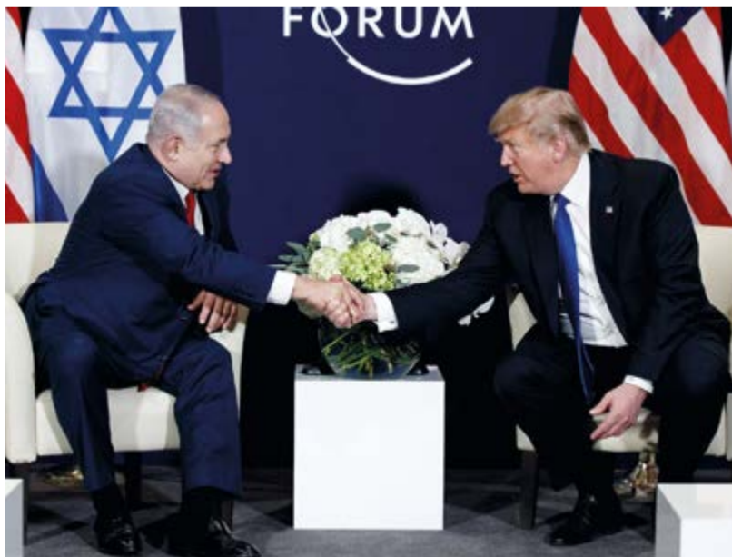
Envuelta en una supuesta proposición económica, en realidad la Casa Blanca persigue favorecer a su socio de Tel Aviv.

Por Armando Reyes Calderín Corresponsal/Beirut