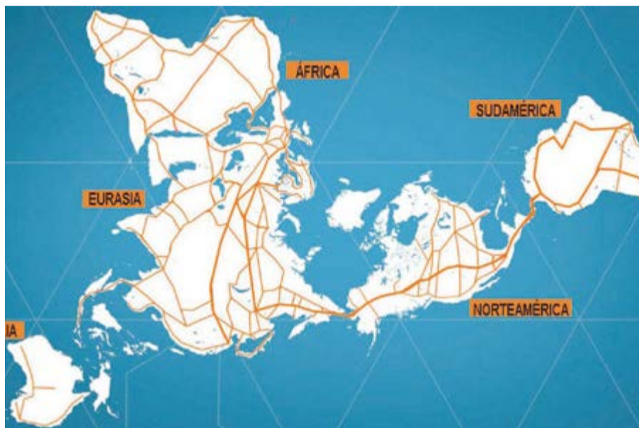
La Iniciativa de la Franja y la Nueva Ruta de la Seda, del gobierno de Xi Jinping, aparece como pilar de la hegemonía económica global que alcanzaría China entre 2030 y 2050.

estratégicos de infraestructura, extracción de recursos energéticos y corredores comerciales que conforman la Iniciativa de la Franja y la Nueva Ruta de la Seda, anunciada en 2013 por el gobierno de Xi Jinping como pilar de la hegemonía económica global que alcanzaría China entre 2030 y 2050. Frankopan articula la argumentación y la estructura narrativa de su libro a partir del estudio