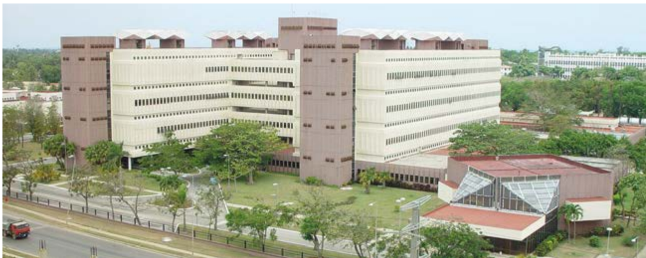
Entre las fortalezas que hoy tiene Cuba, está el desarrollo de la industria biotecnológica y farmacéutica, significó el presidente Miguel Díaz-Canel. (En la foto el Centro de Ingeniería Genética y Biotecnología).