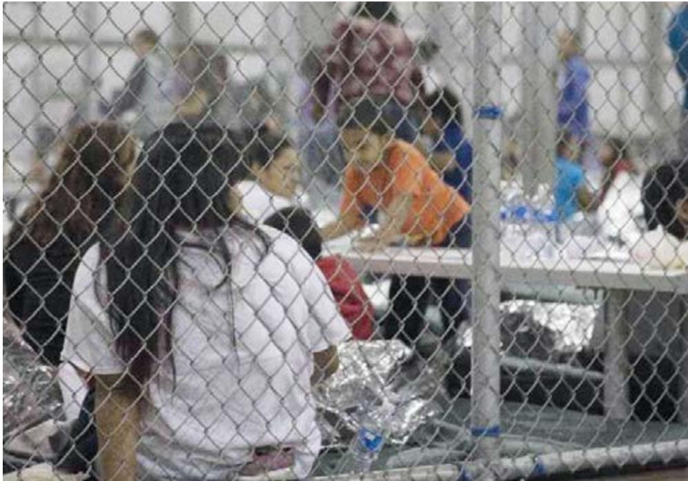
De macabras calificó las condiciones de algunas instalaciones, la directora ejecutiva de Unicef, Henrietta Fore, quien visitó recientemente uno de esos refugios.

Por Ibis Frade Corresponsal/Naciones Unidas