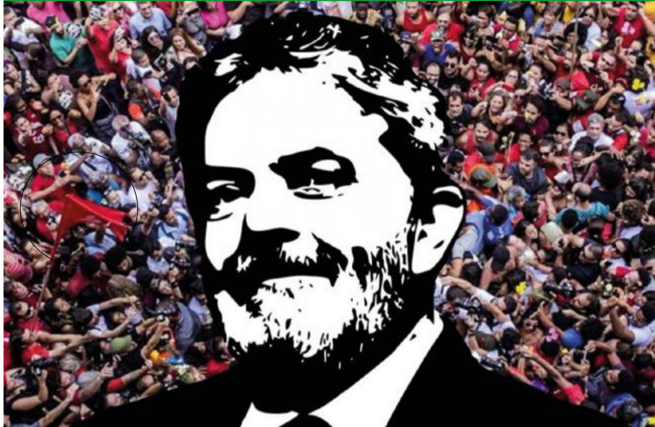
En el STF, con más miedo que justicia, votaron los ministros tres contra dos y no aprobaron el recurso para liberar a Lula.