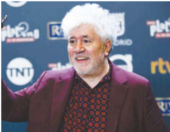
Almodóvar —69 años—, posee una extensa filmografía, que incluye 22 largometrajes y 10 cortos.