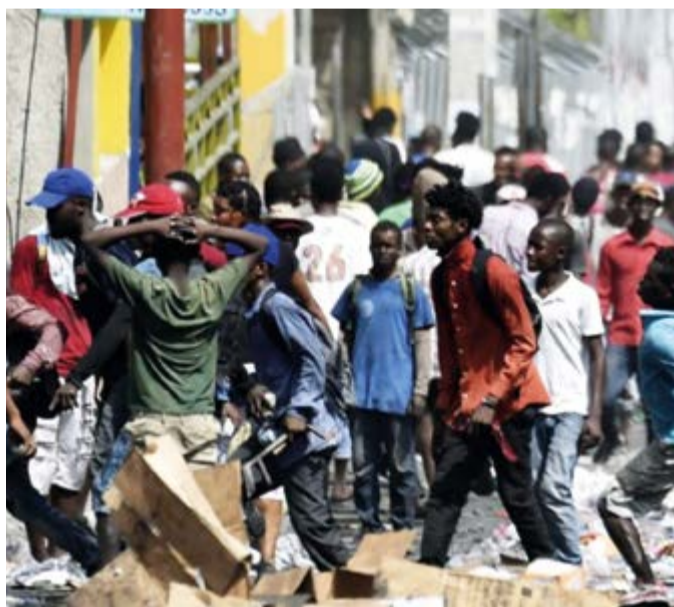
Desde marzo el país experimenta una fuerte inestabilidad, marcada por cíclicas protestas, huelgas e incremento de la inseguridad.

En mayo pasado, la Oficina Nacional de Identificación anunció que los documentos de identidad están disponibles para todos los ciudadanos, por lo que los más de tres millones de haitianos que hoy carecen de cédulas, podrán ejercer su derecho al voto. Para el presidente Jovenel Moïse, la celebración de esta contienda es una realidad, y recientemente afirmó a la prensa extranjera, la necesidad de despolitizar y fortalecer el Consejo Electoral Provisional “para inspirar confianza en las próximas elecciones parlamentarias de octubre”. Sería la primera