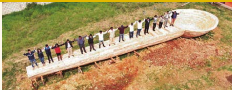
En su confección se emplearon 30 árboles de sauce; mide 20,06 metros de largo, 5,06 de ancho en el cuenco y 1,51 de alto.