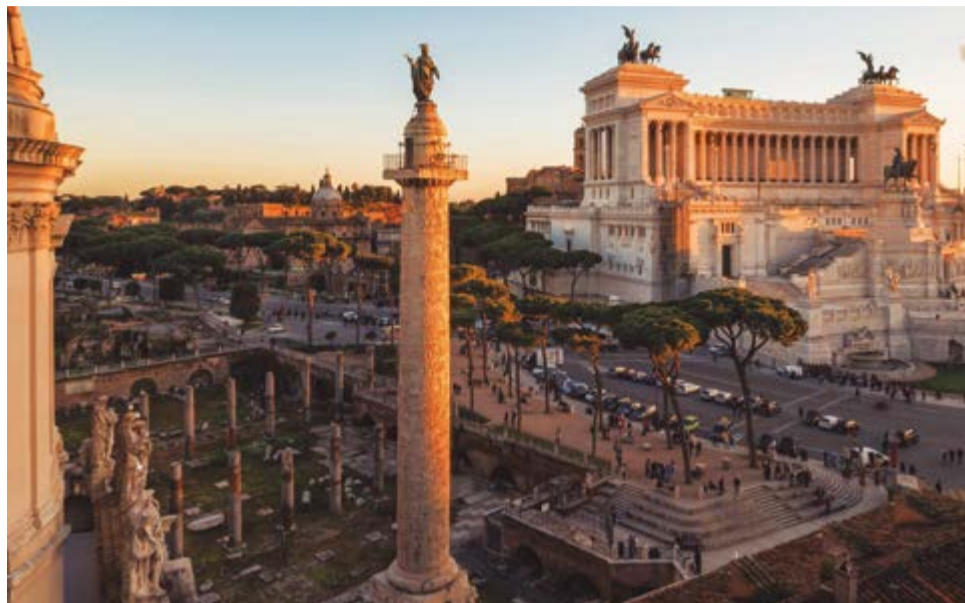
Fue inaugurada en el año 113 para exaltar la figura del emperador Marco Ulpio Nerva Trajano, bajo cuya dirección el imperio alcanzó su mayor extensión territorial.

Sucesor de Nerva (96-98) y antecesor de Adriano (117-138), Trajano fue el primer emperador de origen provinciano, nacido el 18 de septiembre del 53 en la península ibérica, aunque su familia tenía raíces itálicas. Promotor de grandes obras públicas y de infraestructura, Trajano ordenó la construcción de su propio foro a continua-