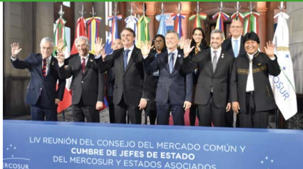
(De derecha a izq.): Evo Morales, Bolivia; Mario Benítez, Paraguay; Mauricio Macri, Argentina; Jair Bolsonaro, Brasil; Tabaré Vázquez, Uruguay; y Sebastián Piñera, Chile.

De lo celebrado, además de las varias declaraciones conjuntas rubricadas, estuvo