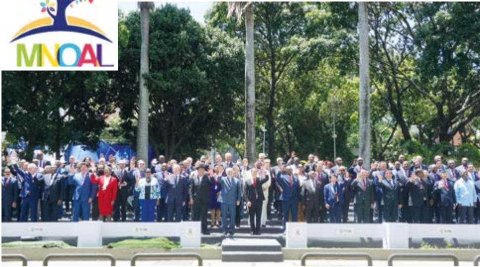
Bajo el lema Promoción y Consolidación de la Paz a través del Respeto al Derecho Internacional, los 120 representantes del Mnoal abogaron por el respeto al multilateralismo.

Por Odette Díaz Fumero Corresponsal/Caracas