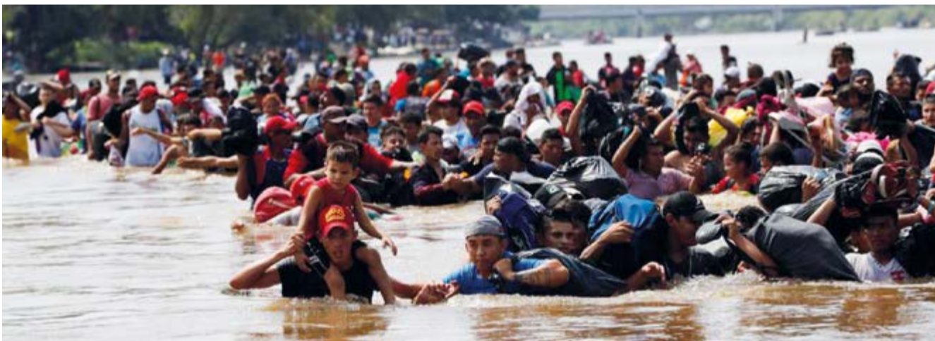
El Presidente, con la vista puesta en satisfacer a su base republicana de cara a las elecciones de 2020, mantiene su posición de criminalizar a quienes entran de forma irregular.

La presión de la Junta de la Vigilancia Médica, afín a la práctica privada, forzó la salida de los especialistas cubanos y afectó a cientos de personas que ya tenían turno para ser operados. Los cubanos realizaban también aquí operaciones láser de retinopatías de origen diabético, y el total de cirugías superaba ya las 23 000 en menos de cuatro años.