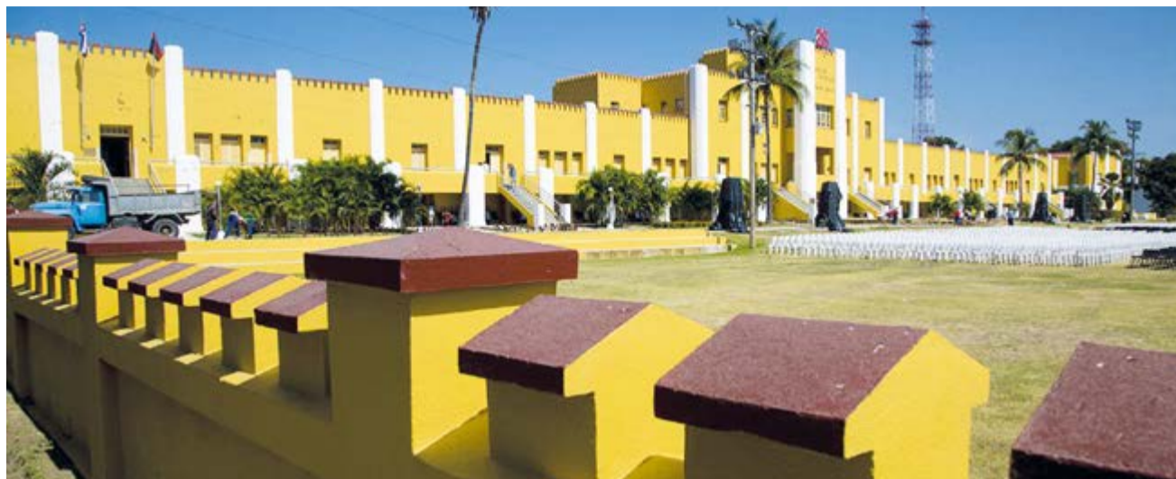
El Moncada —como sucedió con otros cuarteles— la Revolución lo transformó en la Ciudad Escolar 26 de Julio y preservó la fachada que tenía en 1953.