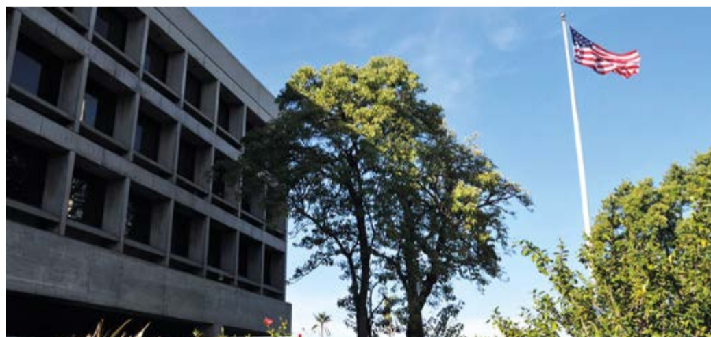
La embajada de EE.UU. confeccionó el informe publicado en El País .

Con mayor virulencia al referirse a la relación sindical con el Frente Amplio señala que “por años, los líderes comunistas han ocupado posiciones centrales en los sindicatos y dentro del Ministerio de Trabajo”. El informe 2019 sobre Clima de Inversiones para Uruguay, publicado por la embajada, se expande hacia otros asuntos para decir que este país “está experimentando una crisis en su sistema educativo”, apoyando así una de las campañas electorales de los opositores partidos Nacional y Colorado. Ambos de ganar los comicios de octubre venidero, apuntan a reducir y a eliminar los procesos anuales de negociaciones salariales, que constituyen derechos laborales conquistados décadas atrás.