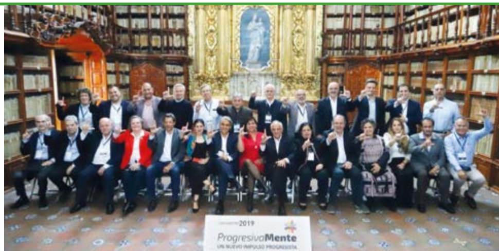
Es preciso responder al empleo de la ley como instrumento de persecución política en el continente, alertaron en la Declaración de Puebla .

Líderes progresistas e intelectuales latinoamericanos denunciaron en México, en una declaración conjunta, la persecución política que persiste contra el expresi-