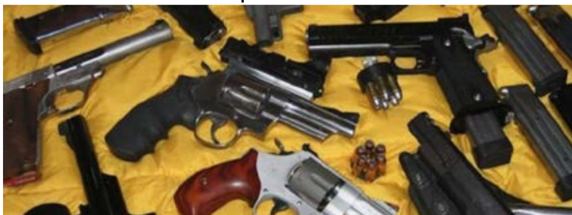
En el quinquenio 2011-16, se rastrearón 74 515 armas de fuego de escenas delictivas, todas estadounidenses.