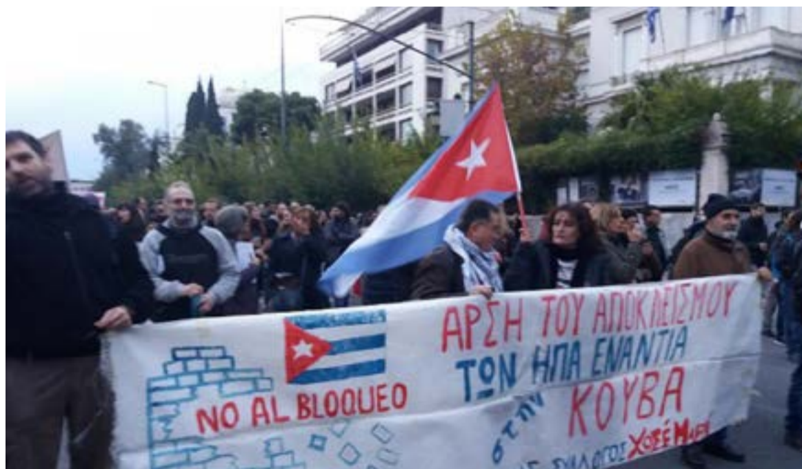
"El mundo verá de lo que somos capaces de hacer y el mundo nos acompañará en nuestra resistencia", significó el mandatario cubano en el acto central por el 26 de julio.

Cuba resiste y va por más, concluyó el mandatario cubano en la Plaza de la Patria de la ciudad de Bayamo, escenario plétórico de historia patria.