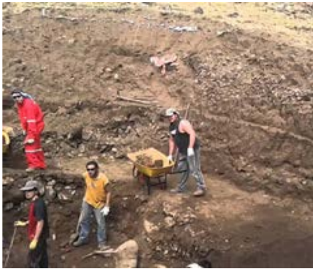
Las excavaciones se concentraron en Puerto Inglés, en la isla Robinson Crusoe, la mayor del archipiélago de Juan Fernández.

Por Rafael Calcines Armas Corresponsal/Santiago de Chile