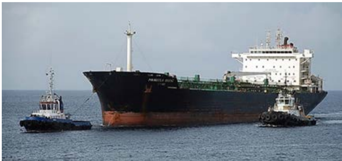
El presidente cubano, Miguel Díaz-Canel, denunció que "Estados Unidos ha comenzado a actuar con mayor agresividad para impedir la llegada de combustible a Cuba".

Estados Unidos busca el estallido social en Cuba y una de las maneras para provocarlo es perseguir e impedir los embarques de combustible a la Isla, para sumirla en apagones y cortes a los servicios públicos vitales. Resulta otra faceta del asedio al pequeño vecino del sur, acostumbrado a resistir, incluso en los años 90 cuando se "desmenguó" la Unión Soviética, como dijera Fidel Castro. Fueron años de doble bloqueo, largos apagones, carencias alimentarias y de transporte y otras penurias para el pueblo cubano. El presidente estadounidense Donald Trump pretende reeditarlos bajo los compromisos con el senador cubano-americano Marco Rubio y otros personeros del "establishment", quienes desde la Florida mantienen secuestradas las relaciones EE.UU.-Cuba. "Hoy denunció ante el pueblo de Cuba y el mundo que la administración de los Estados Unidos ha comenzado a actuar con mayor agresividad para impedir la llegada de combustible a Cuba", así lo expresó el presidente Miguel Díaz-Canel en el discurso central del acto nacio-