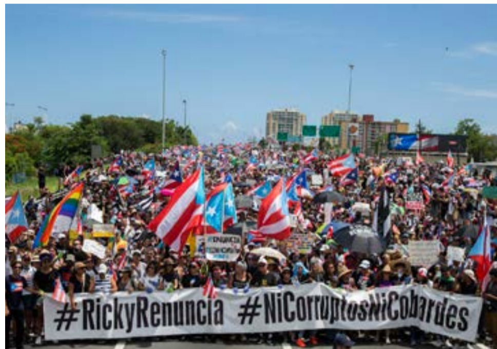
Las masivas protestas desembocaron en la renuncia del gobernador Ricardo Rosselló.

“Las protestas, por otro lado, indican que los puertorriqueños están necesitados de un instrumento político que los organice y represente, no obstante, es de esperarse que una foro constitucional produciría un verdadero terremoto en el tablero geopolítico regional y las reacciones de la Casa Blanca serían de una desenfadada belicosidad”, aseguró Borón en sus valoraciones de esta crisis. Lo único claro hasta ahora es que ni Wanda, ni Rivera Schatz y ni otro candidato de la claue política, logrará complacer los reclamos de los que protestan en las calles de Puerto Rico.