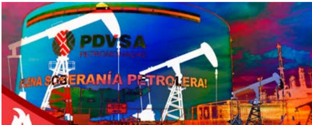
Los planes imperialistas contra Pdvsa cuentan con el apoyo de la derecha interna, enfatizó Cabello.

“Denunciamos que es una operación de crimen organizado transnacional para robarse los recursos de Venezuela; el Estado continuará ejerciendo las acciones ante todas las instancias judiciales para defender los derechos del pueblo”, aseguró Rodríguez. Ante esta situación, Cabello enfatizó que “cualquier agresión que ocurra sobre nuestra Patria, garantizará que Estados Unidos no reciba ni una gota de petróleo de Venezuela. El petróleo es de los venezolanos”, recaló el dirigente.