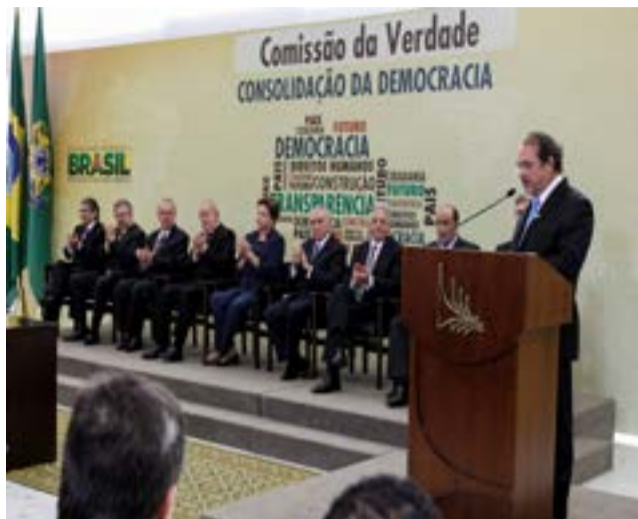
Amnistía Internacional, en la Comisión de la Verdad, instó a los militares a reconocer su responsabilidad por los abusos durante la dictadura.

Por Oswaldo Cardoso Corresponsal/Brasilia