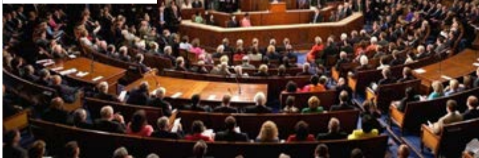
Los números parecen garantizar el éxito, pero realmente depende de que el liderazgo republicano permita someter a votación la iniciativa.

nadores, con el título Ley de Libertad de los estadounidenses para viajar a Cuba de 2019, fue enviado al Comité de Relaciones Exteriores. La iniciativa está acompañada por una acción similar en la Cámara Baja.