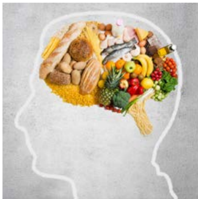
Todos los seres vivos se alimentan, aunque el ser humano es el único que cocina y al hacerlo transforma los productos de la naturaleza.

Mientras, cocina y ciencia continúan con su química especial, con esa relación que evoluciona a lo largo de los años. Sí, definitivamente "somos lo que comemos", pues una buena alimentación nos ayuda a mantener sano nuestro organismo. Desde la innovación, se pueden transformar nutrientes, proteínas y minerales, en sorprendentes platos de comida. El hombre experimenta con nuevos métodos que buscan el asombro de los sentidos desde una nutrición balanceada. Entonces, podríamos preguntarnos: "Barriga llena, ¿ciencia contenta?"