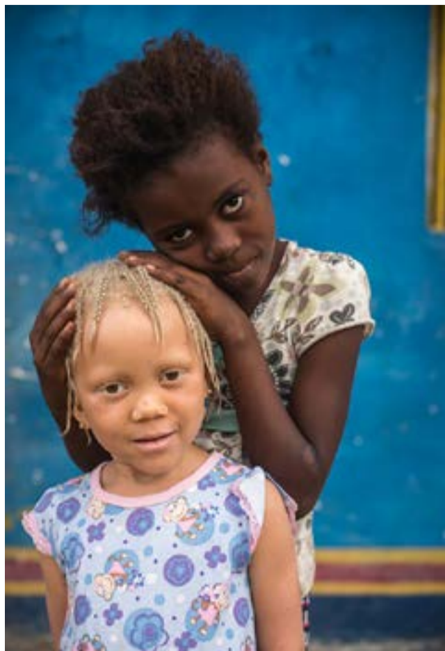
Algún día lo haré , teje un mensaje de esperanza en los rostros, sueños e historias de niñas sobrevivientes a conflictos y crisis.

La exposición, organizada por esa Oficina y apoyada por las misiones permanentes de Francia y Marruecos ante Naciones Unidas, además de exhibirse en el vestíbulo de visitantes de la sede de la organización multilateral, se mostrará en la valla exterior de ese edificio, en Nueva York.