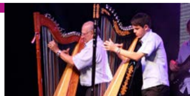
Existe el objetivo de declarar al arpa paraguaya como Patrimonio Cultural Inmaterial de la nación.