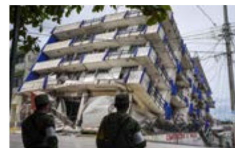
Miles de efectivos —humanos y técnicos— para la defensa, con una precariedad total de los mismos frente a incendios, inundaciones, tsunamis, terremotos y otras catástrofes naturales.