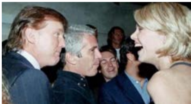
Por medio están las relaciones de Epstein con miembros de la elite, entre ellos el actual mandatario, Donald Trump.

Por Martha Andrés Román Corresponsal/Washington