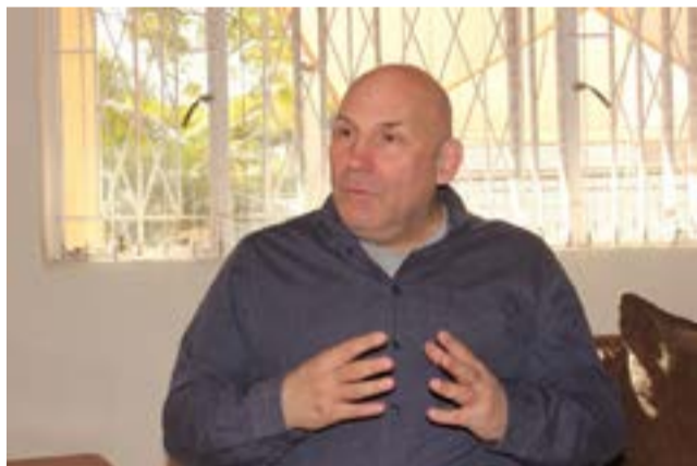
La agudización de sanciones contra Cuba es una obsesión dictada por políticas nacionalistas y el odio, significó Nicholas Wolpe.

Un estudio de la Contraloría General de Colombia dado a conocer en abril pasado calificó de catastrófica e irreversible la eventual explotación de hidrocarburos por la mencionada modalidad y alertó de las graves consecuencias derivadas del fracking en otros países, como derrames, roturas en tuberías y altos niveles de contaminación. El documento de más de 200 páginas indicó que esa técnica está insuficientemente estudiada, por lo que el Estado no está preparado para usarla.