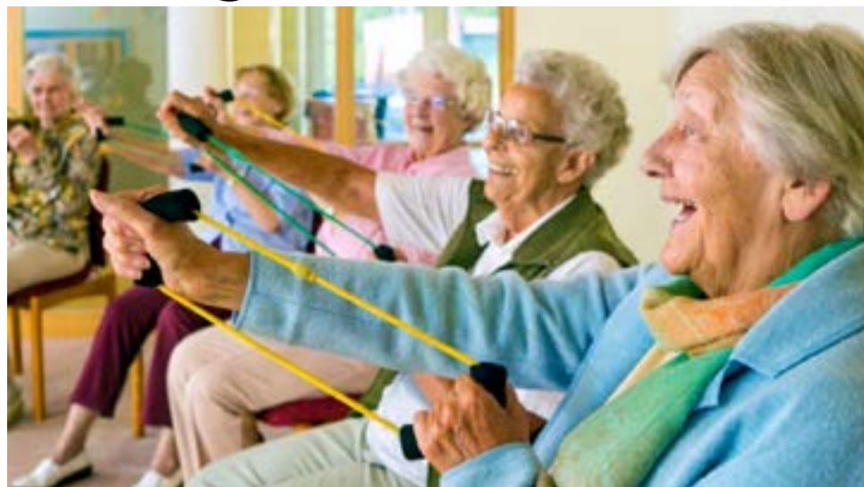
La longevidad de un ser vivo está determinada por sus telómeros, los que contienen la información genética en el interior de una célula, según el estudio científico español.

Por otra parte, señala, nuestro estilo de vida también influye en el estado de los telómeros: sabemos que en humanos el estrés, fumar o consumir determinados alimentos los acorta, mientras que hacer ejercicio, por ejemplo, los mantiene. Sin embargo, todavía no se entendía bien qué relación había entre los telómeros de cada especie y su longevidad, pues hay animales que los tienen muy largos y viven poco, mientras que otros los tienen más cortos y viven más tiempo.