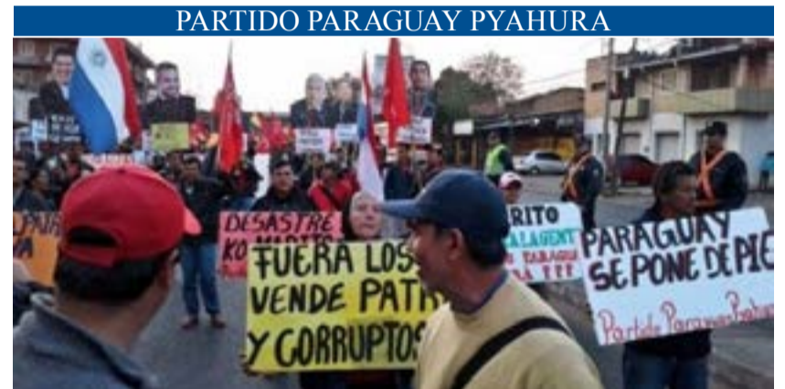
Gran marcha campesina tras un recorrido que comenzó el día 9 de agosto.

Allí lo invitaron a cortar la torta decorada con los colores de la bandera cubana y una simple inscripción en letras cursivas: 93 aniversario. Tomó el cuchillo, y antes de hundirlo en el pastel dijo, como susurrando, más para sí que para quienes lo rodeaban: “Todos éramos fidelistas. Todos éramos sus discípulos. Todavía lo somos”.