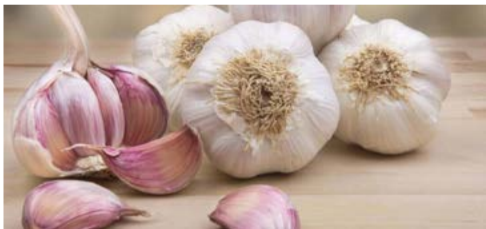
Presente en la cocina latinoamericana su uso se extiende a todo el mundo, en parte por sus amplios beneficios para la salud.

registrados de supercentenarios. Es decir, lo que importa a la hora de envejecer no es la longitud absoluta de los telómeros, sino la velocidad a la que se acortan, puntualiza.