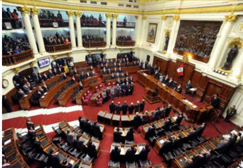
Existe una persistente crisis política, determinada por el bloqueo de la mayoría parlamentaria neoliberal a reformas planteadas por el Ejecutivo.