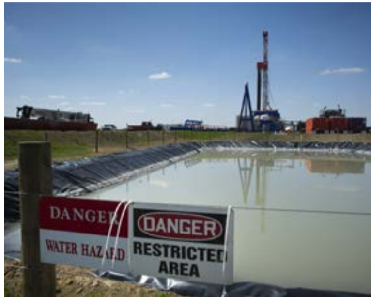
Son conocidos los perjuicios del fracking para los ecosistemas.

El acuerdo entre la estatal petrolera colombiana Ecopetrol y la multinacional Occidental Petroleum Corp para aplicar en Estados Unidos la fracturación hidráulica ( fracking ), reaviva el debate sobre un eventual uso aquí de esa polémica técnica. La organización No al fracking en Colombia ha insistido en advertir de los perjuicios a los ecosistemas que pueden derivarse del empleo de dicha técnica, pues considera que eleva la sismicidad y que afecta severamente la salubridad por la reducción y contaminación de los recursos hídricos. Sin embargo, en fecha reciente trascendió que las mencionadas compañías acordaron la conformación de una "alianza estratégica". Ese acuerdo tiene la finalidad de ejecutar un plan conjunto para el desarrollo de yacimientos no convencionales en la cuenca Permian en el estado de Texas (Estados Unidos), refiere