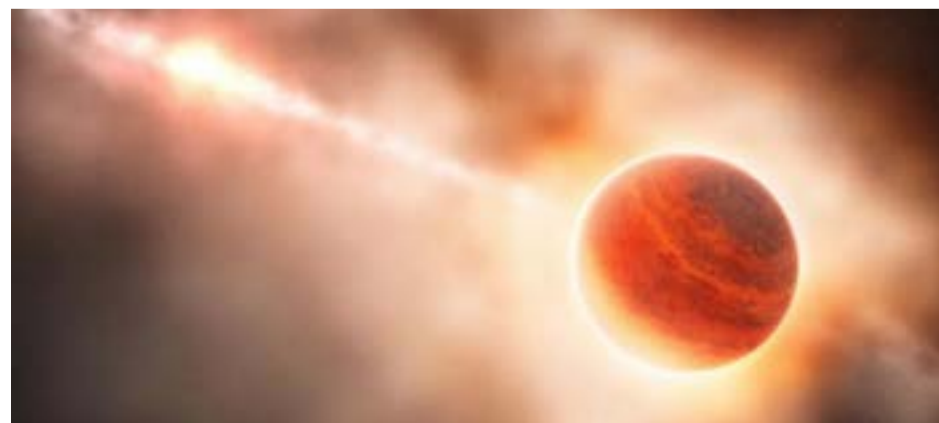
Los científicos creen que puede haberse mudado, en el último millón de años, al Desierto Neptuniano.

El exoplaneta fue detectado con el telescopio NGTS, Next Generation Transit Survey, que se encuentra en el observatorio europeo de Cerro Paranal en el desierto de Atacama en Chile. Su nombre científico es NGTS-4b, según explica el estudio publicado en la revista Monthly Notices of the Royal Astronomical Society . Es un poco más pequeño que Neptuno, tiene tres veces el tamaño de la Tierra, y se encuentra a 920 años luz de distancia de nuestro planeta. NGTS-4 orbita alrededor de su estrella en apenas 1,3 días, y en ese período recorre una distancia equivalente a la órbita de la Tierra alrededor del sol. Los científicos creen que puede haberse mudado "recientemente" al Desierto Neptuniano, en el último millón de años. Otra posibilidad es que haya sido más grande y su atmósfera esté en pleno proceso de evaporación. De cualquier manera, y al margen de otros detalles, constituye una curiosidad astronómica.