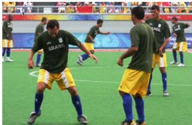
Los atletas en el campo tienen parálisis cerebral, pero se someten a un proceso de clasificación funcional.

Después de su destacado desempeño en los recién concluidos XVIII Juegos Panamericanos, en los que se ubicó en el segundo lugar por países, Brasil se propone que su selección de fútbol siete, integrada por atletas con parálisis cerebral, mantenga la hegemonía en los Juegos Parapanamericanos, a realizarse del 23 de agosto al 1 de septiembre en Lima, indicaron autoridades deportivas del gigante suramericano.