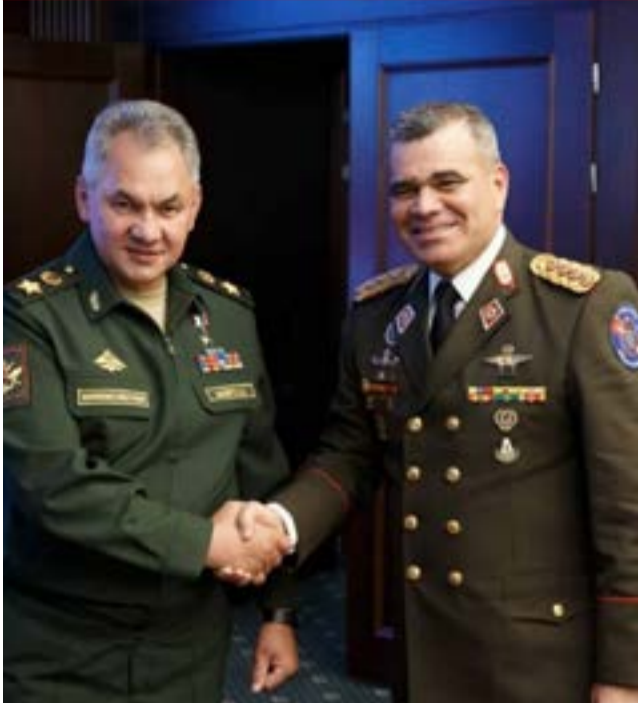
Los ministros de Defensa: de Rusia, Serguéi Shoigú (izquierda) y de Venezuela, Vladimir Padrino.